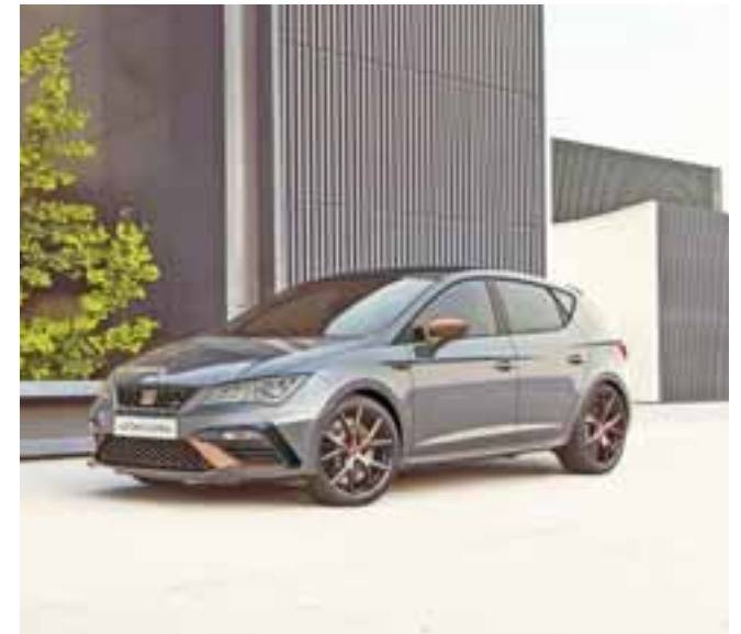
Colores. Las opciones disponibles son Blanco Nevada, Negro Medianoche, Plata Urbano y Gris Magnético. / SEAT

novecientos pesos es el precio de esta edición especial y ya está disponible.