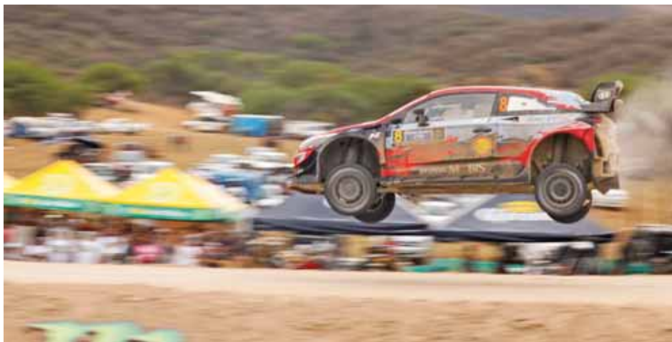
Brinco. Su segundo lugar marcó el tercer podio de 2020 para la marca coreana.

Pilotos como Ogier, Ingrassia, Tänak y Järveoja demostraron su solidaridad ante esta situación e inclusive ninguno de ellos celebró su resultado. El rally terminó con el 75% de la ruta tras 21 etapas completadas, por lo que FIA dará el total de los puntos al ganador.