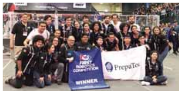
General Motors apoyó a 11 equipos de estudiantes de preparatoria en el regional de este año.

Ahora, estudiantes de preparatoria ganaron el regional de la competencia de robótica FIRST en el Tecnológico de Monterrey, Campus Santa Fe, donde se realizó la segunda de tres competencias regionales de robótica de este programa. Esto suma al éxito obtenido en el regional de Monterrey el pasado 8 y 9 de