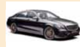
Mercedes-AMG S 65 Final Edition.

El motor más grande de AMG, el V12 de 630 caballos, dejará de ser fabricado. La marca lo atribuye a los motores V8 desempeño con menores consumos y alta eficiencia. El fabricante ha decidido despedirlo con una exclusiva edición limitada Mercedes-AMG S 65 Final Edition, de la cual únicamente habrá 130 unidades. Destaca su pintura metalizada negro obsidiana, rines de 20 pulgadas y la placa de la serie en la consola central. Aunque esta edición pone fin a una era, la marca de la estrella promete seguir fabricando motores que combinen performance y eficiencia al más alto nivel. AUTOS RPM