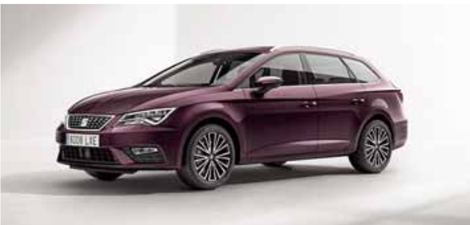
Desde afuera se aprecia un techo panorámico sensacional que otorga gran amplitud y claridad al interior.