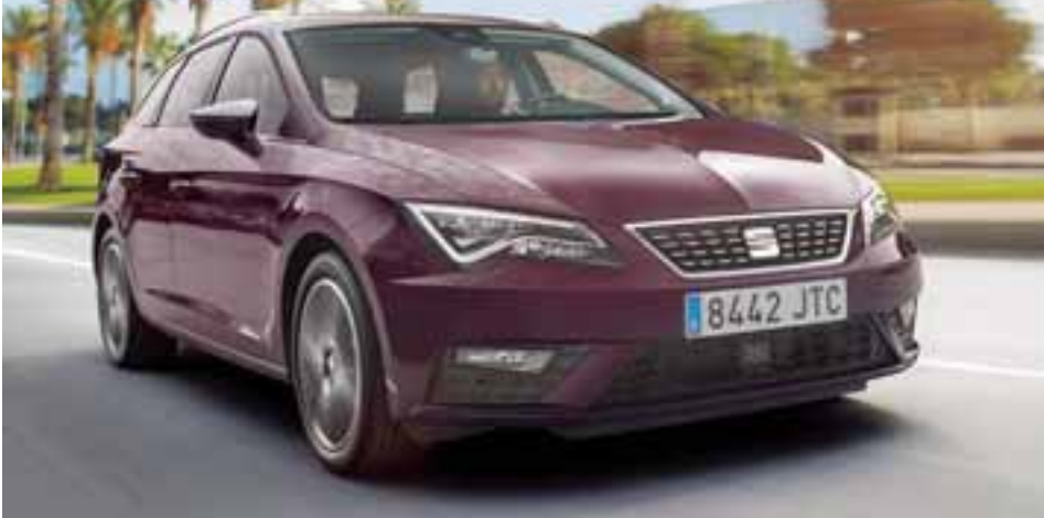
Con líneas completamente dinámicas, el León ST combina gran espacio interior y muy buen equipamiento.

La firma española mantiene el modelo vagoneta de su afamado León, para satisfacer a quienes desean mucho espacio interior, muy buen equipamiento y un manejo dinámico a un precio accesible