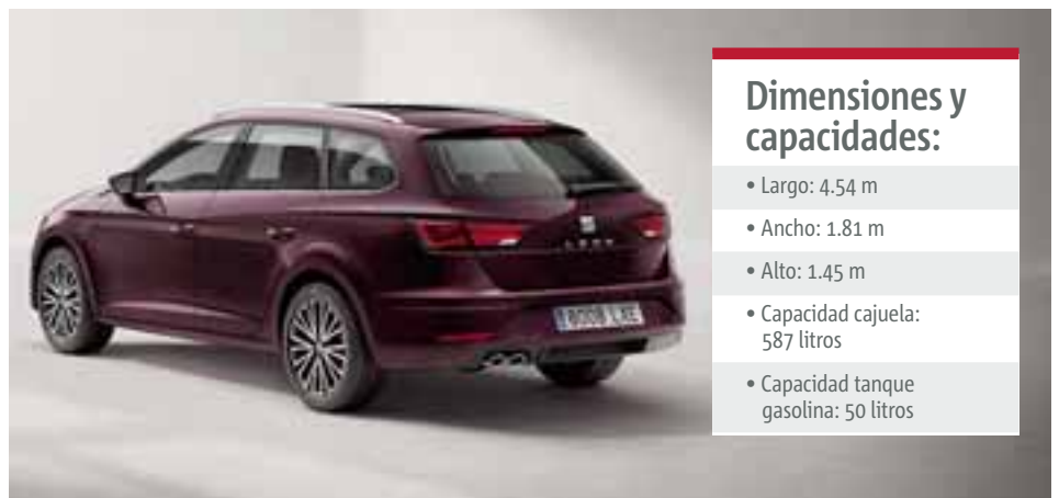
Ofrece gran espacio en cajuela y que puede llevar algunos aditamentos en el techo, gracias a toda la gama de accesorios originales.