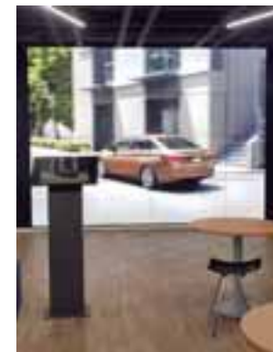
Los clientes podrán interactuar en las instalaciones de nueva generación.

Además, para aquellos que quieran realizar su servicio de mantenimiento o reparación, podrán ver con total transparencia los procedimientos realizados a su vehículo. Con asesoría de un mecánico ex-