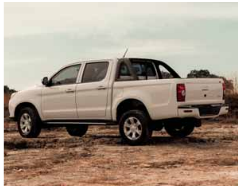
Cuenta con 5 años de garantía total, defensa a defensa y excelente equipo de seguridad.

Giant Motors Latinoamérica y JAC, presentaron Frison T6 en nuestro país