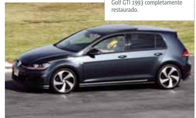
Es necesario mantener tener las dos manos al volante, brazos flexionados y la mirada al final de la curva.

XI GTI Track Day recibió más de 100 autos inscritos. En esta edición se presentó un Golf GTI 1993 completamente restaurado.