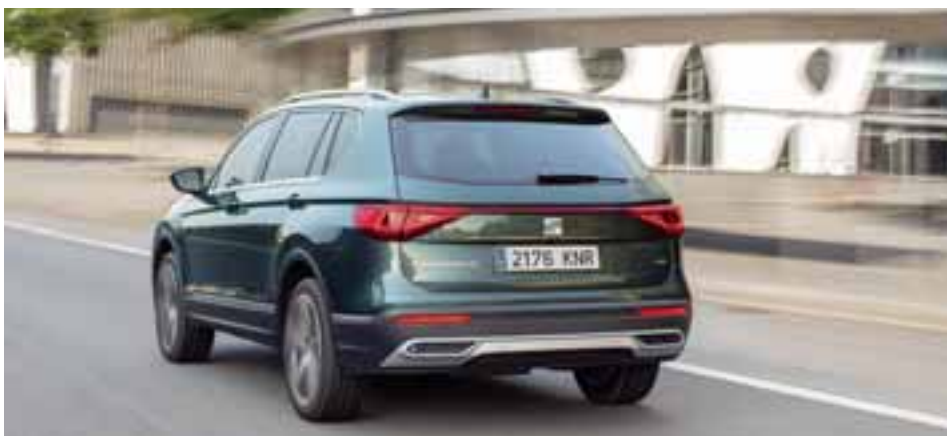
Trazos y líneas bien definidas en los costados, discretas y que permite un análisis visual muy acertado.