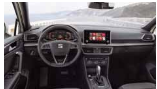
El sistema digital Cockpit de SEAT de 10.25", que permite personalizar la información y, en la consola central, una pantalla de 8".