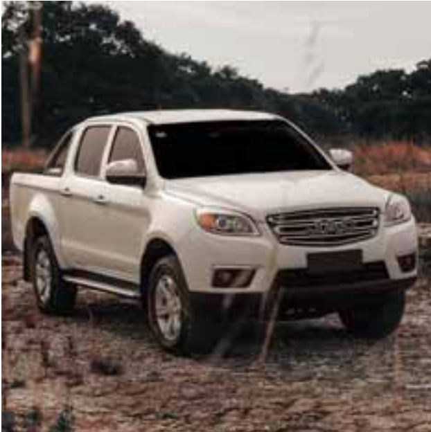
Frison T6 se distingue por tener diseño fuerte y estabilidad en todo tipo de terreno.