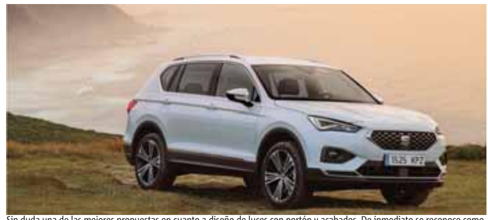
Sin duda una de las mejores propuestas en cuanto a diseño de luces con portón y acabados. De inmediato se reconoce como un vehículo SEAT.