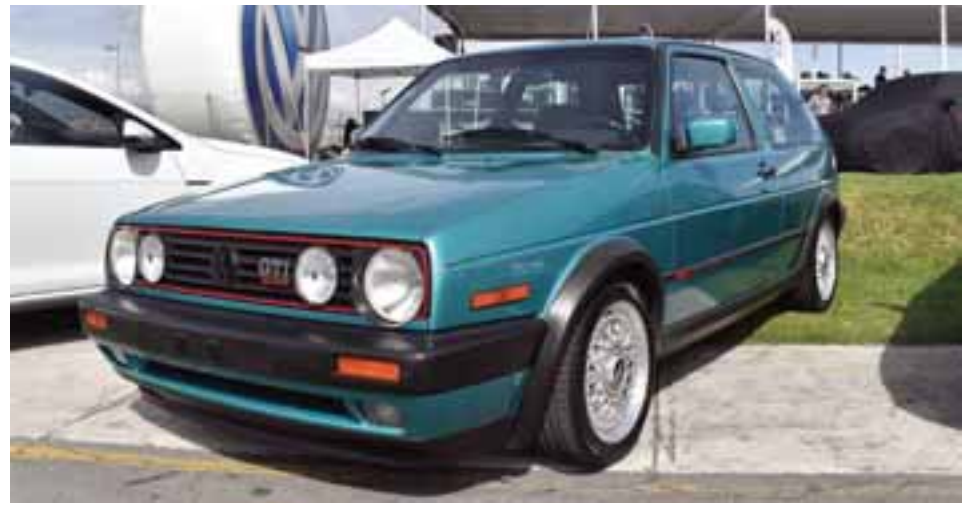
La cita contempló la invitación no sólo a prensa, sino a los amantes y propietarios de diferentes generaciones de GTI.