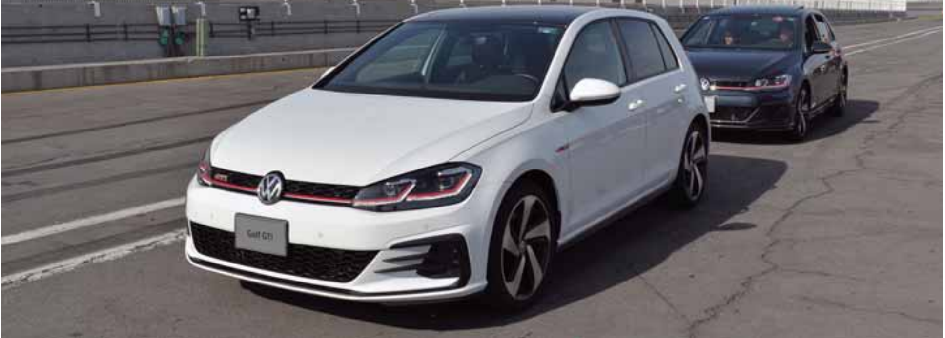
Golf GTI 2018 cuenta con paletas de cambio al volante y está disponible desde 519 mil 990 pesos.

Probamos en la pista del Autódromo de Puebla el carácter de la última generación del Golf GTI en el GTI Trackday 2018