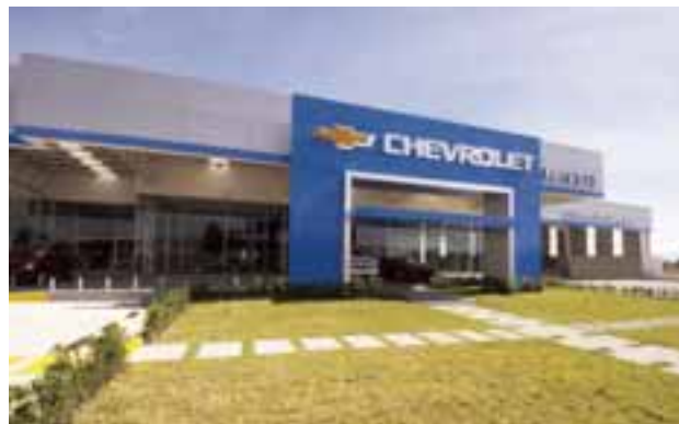
Chevrolet ofrece una experiencia superior, que responde a las necesidades de los consumidores actuales.

Al llegar a este nuevo distribuidor, la intención es que recibas atención personalizada para conocer a detalle todo el portafolio de productos que ofrece la automotriz. Se implementó un plan Possibilities LAB para dar a conocer cada una de las asistencias y tecnologías de seguridad. Podrás interactuar en un video muro gigante controlado por una pantalla táctil y visualizar los vehículos en escala 1:1.