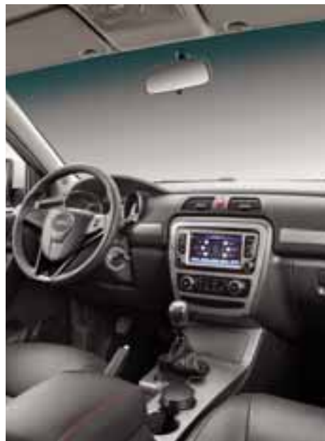
Ofrece conectividad, seguridad y volante multifunción.