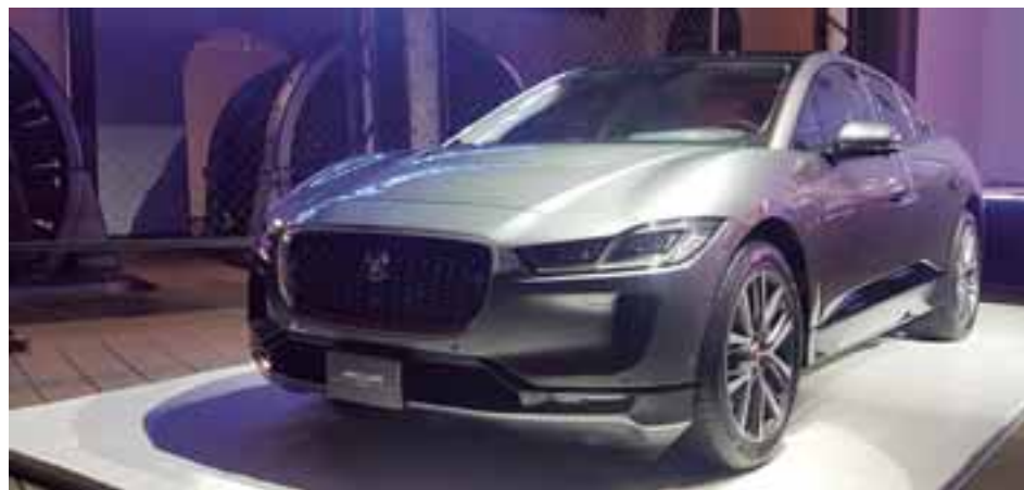
Jaguar I-Pace está desarrollado en la planta de Magna Steyr.

La firma felina reportó 166.7% arriba y Land Rover