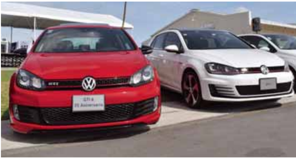
Todas las generaciones de Golf GTI estuvieron presentes en el GTI Trackday 2018.