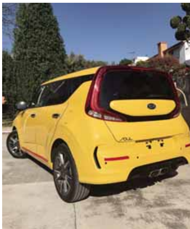
El Soul GT Line cuenta con un escape al centro con salida cromada, frenos más grandes y suspensión deportiva configurada.