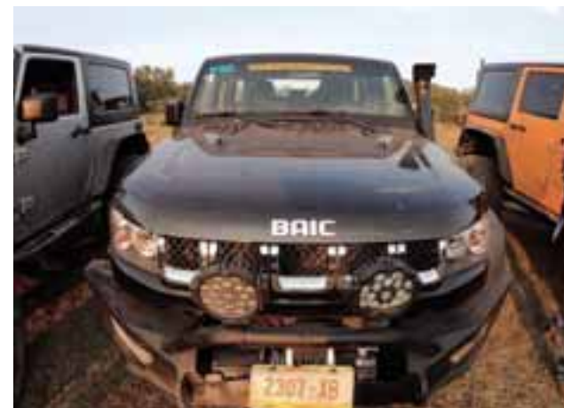
La palanca selectora para el 4x4 es muy sencilla de usar, ya que los movimientos para poner cualquier relación del 4x4 es lineal.