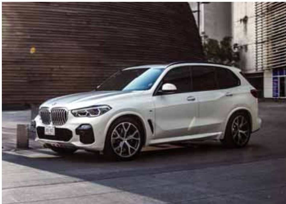
El nuevo BMW X5 ofrece las características familiares de un SAV, y las capacidades de un todoterreno.

Luego del rotundo éxito que la familia de vehículos X ha tenido en el 2018, la marca bávara presentó el nuevo BMW X5 que inicia su cuarta generación