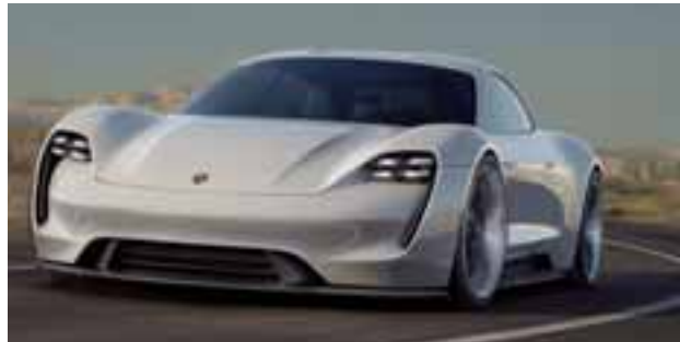
Porsche Mission E estará exhibido en México hasta el 7 de enero de 2019.

Sí, de este auto sólo hay 5 en el mundo, ha sido el prototipo para crear lo que en unos meses veremos en las distribuidoras de la marca en todo el mundo: Taycan. El auto 100% eléctrico de Porsche hoy está en México y goza de un diseño excepcional; la curva de velocidad superior del vehículo que viaja desde el cofre, parabrisas, techo y termina en la parte posterior, hace que el trazo de todos sus ángulos y el lienzo en blanco propongan un tren motriz eléctrico que le erige como uno de los deportivos más avanzados del mundo. La complejidad de piezas de un eléctrico es mucho menor que uno de gasolina, el acomodo de baterías permite un centro de gravedad mucho más controlado y bajo, el auto es