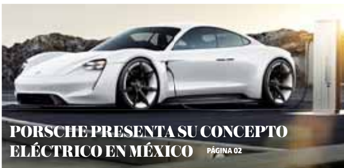
PORSCHE PRESENTA SU CONCEPTO ELÉCTRICO EN MÉXICO PÁGINA 02