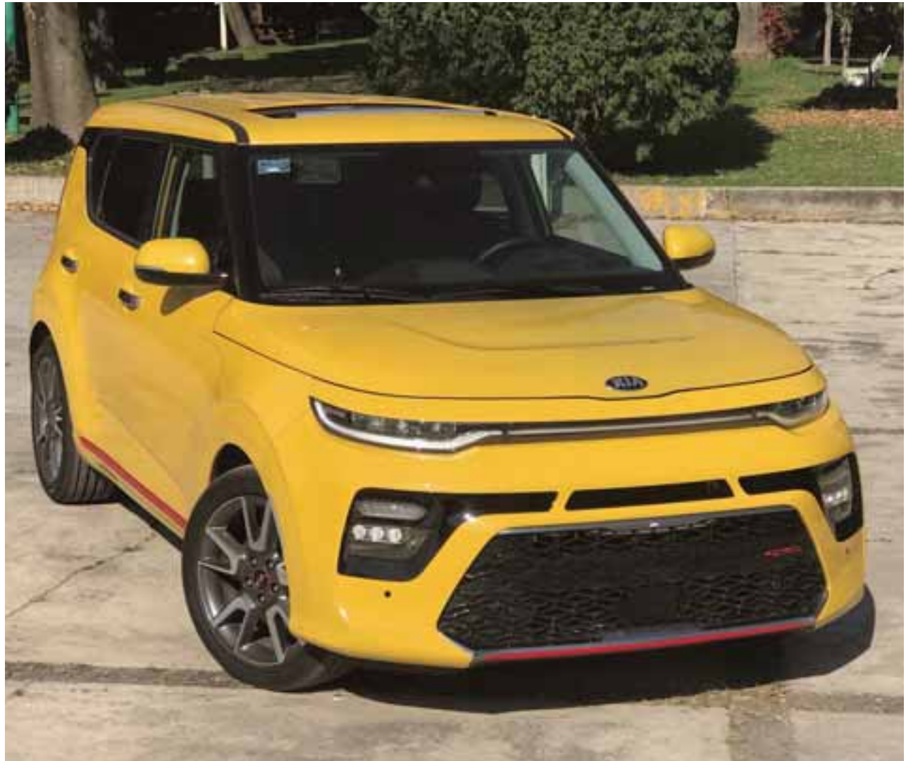
Sus nuevas líneas esculpidas, los detalles y la iluminación hacen que este Soul sea más futurista e innovador que su predecesor.

No cabe duda, KIA lo ha hecho muy bien en esta tercera generación del Soul, un vehículo que no pasa desapercibido y que ahora con certeza robará más miradas.