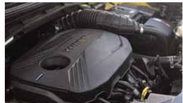
Su motor 1.6 litros turbo, versión probada, arroja un gran rendimiento y buenos consumos de combustible.