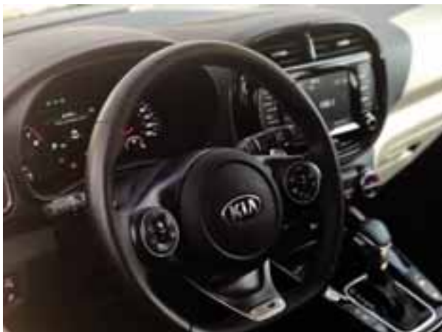
Los interiores están bien logrados, volante multifunción y pantalla táctil de mayores dimensiones destacan en esta tercera generación.