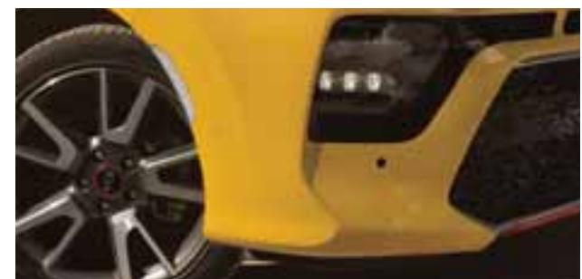
KIA ha dotado a este nuevo Soul de los sistemas de asistencia más avanzados para un manejo totalmente seguro.