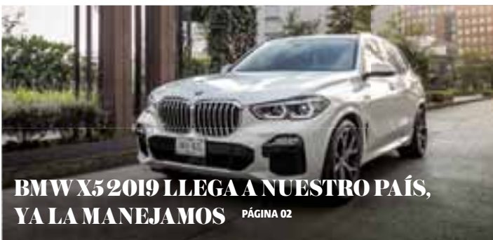
BMW X5 2019 LLEGA A NUESTRO PAÍS, YA LA MANEJAMOS PÁGINA 02