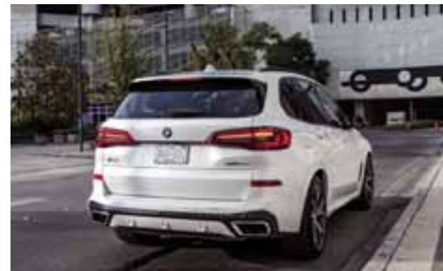
Uno de los elementos exteriores más destacables de este vehículo es su gran parrilla en forma de riñón doble BMW.

El nuevo BMW X5 está disponible con la última generación del motor V8 de BMW y del tradicional motor de 6 cilindros en línea. Ambas opciones se acoplan con una transmisión Steptronic de 8 velocidades. La unidad de 8 cilindros del BMW X5 xDrive50iA ofrece una potencia máxima de 462 hp, mientras que el BMW X5 xDrive40iA con motor a gasolina de seis cilindros en línea alcanza una potencia máxima de 340 hp.