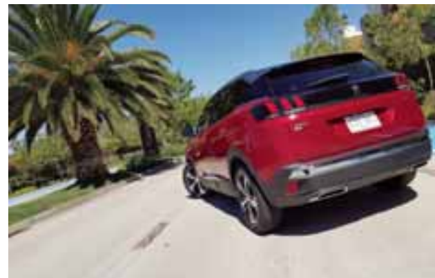
Su techo Black Diamond y una banda negra brillante en la parte trasera destacan por los faros LED de 3 garras que iluminan de noche y de día. |AUTOS RPM

Rebasar, acelerar y llegar a ritmos de 130 km/h es cosa tan sencilla como apretar el acelerador a la mitad, el Peugeot 3008 sabe y le gusta ir rápido, consumir poco y además brindar la mejor seguridad de conducción en todo momento, esto gracias también a sus excelentes frenos que en ningún momento mostraron fatiga, incluso abusamos de ellos en un par de ocasiones y respondieron de manera muy efectiva.