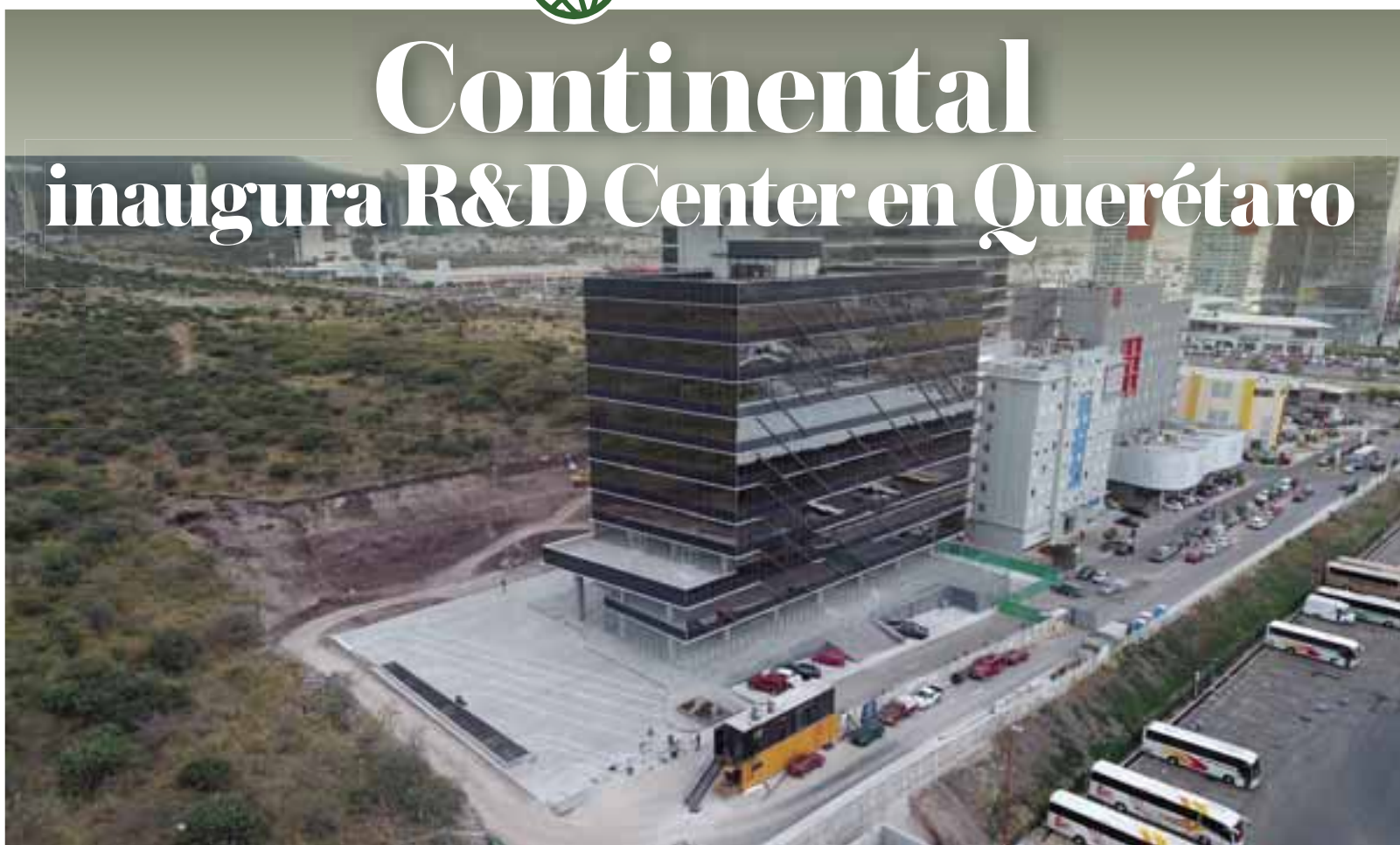
La empresa alemana desarrolla mucho más que neumáticos y rebasa sus fronteras, prueba de ello este nuevo centro de innovación y desarrollo.

Suma a este nuevo centro algunos más del extranjero y queda claro que México no es sólo un país maquilador, sino productor de inteligencia de valía para la movilidad. Soñamos con un país de científicos, hoy la industria automotriz lo hace realidad.