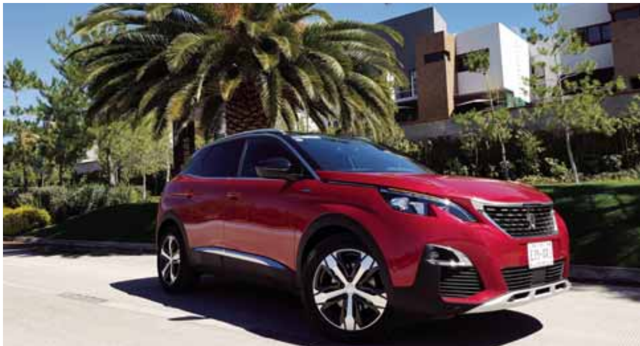
Con un notable diseño, este SUV afirma su robustez sin perder la elegancia. |AUTOS RPM

Un producto netamente galo, con verdadera tecnología de punta, diseño sobrio y un manejo al más puro estilo europeo