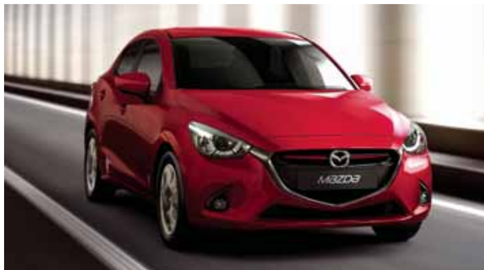
El diseño replica la visión estética conocida en Mazda como Kodo, de acuerdo a la filosofía de replicar el dinamismo de un felino en movimiento.

luz. El nuevo Mazda 2 Sedán también es más silencioso. Se añadieron materiales que incrementan la insonorización en la cabina, disminuyendo el ruido del motor y del camino. En materia de seguridad, ofrece bolsas de aire frontales, laterales y laterales tipo cortina, sistemas ABS, EBD y BA, control dinámico de estabilidad (DSC) y control de tracción (TCS).