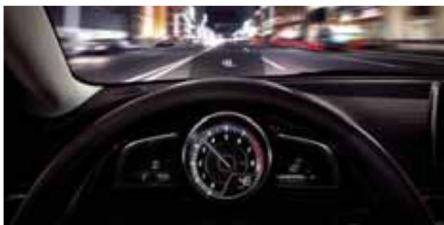
La tecnología es, sin duda, una de sus cartas poderosas. El sistema Head Up Display permite que el conductor mantenga la vista al frente.

Mecánicamente integra un motor 1.5L SKYACTIV® de 106 hp y 103 lb-ft, acoplado a una transmisión de 6 velocidades con modo manual y automático, así como botón de modo sport. La distintiva tecnología Skyactiv® de la marca brinda, tanto un mayor desempeño, confianza y confort, como seguridad. Esto es posible, primeramente, gracias a que es rígido y liviano a la vez. También el sistema G Vectoring Control hace modificaciones sutiles en la entrega de potencia, genera un cambio en la distribución de peso del vehículo al tomar una curva, acelerar o frenar y brinda una mayor