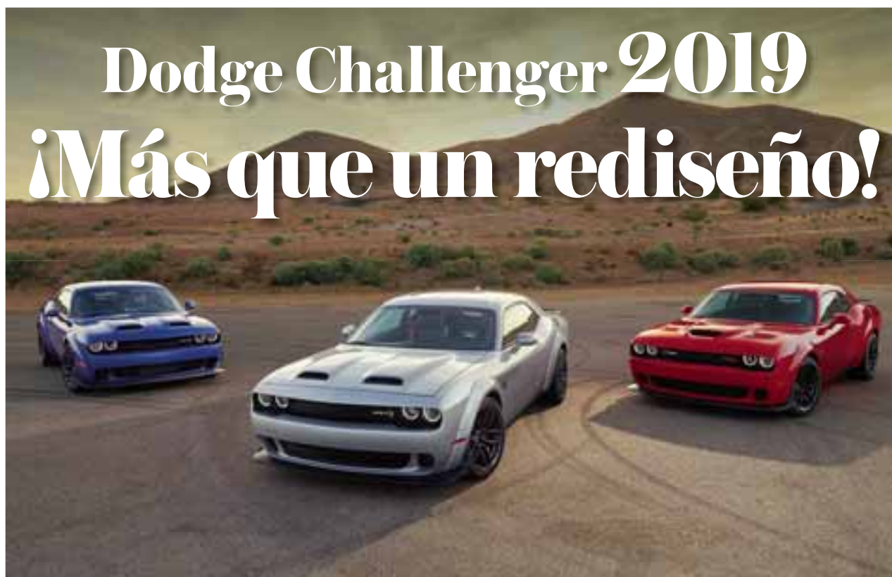
Porque todo es mejor en familia Dodge Challenger 2019. | DODGE

El servicio en Mazda será tan breve como decir Zoom-Zoom, es decir: 40 minutos. Sí, 40 minutos en los que usted podrá ir a dejar su auto, pulsar el botón de su cronógrafo, tomarse un café, contestar correos o ver un capítulo de su serie favorita. Así de rápido su Mazda estará listo, y si no lo está, usted no pagará nada. Eso es lo que yo llamo atreverse a conquistar dentro de un mercado tan competido. Quien dé mejor servicio tiene asegurado al cliente, no importa el tamaño de mercado, su desempeño será como marca y agencia inigualable. Mazda hoy crece 5% en un mercado que cae el 10%, y va por más con esta clase de servicio.