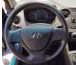
El interior es modesto, pero funcional, bien logrado de acuerdo al segmento. | HYUNDAI