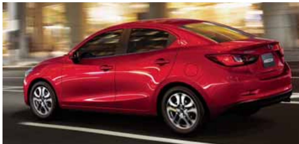
Mazda 2 Sedán se posiciona en un segmento de gran competencia, en donde Volkswagen Vento y KIA Rio sedán deberán estar muy atentos. | MAZDA