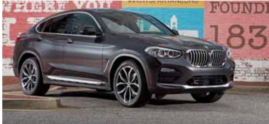
BMW X4 2019 ofrece tecnologías de vanguardia y actualizaciones estéticas sumamente acertadas.

El motivo de nuestro viaje es que llegará a nuestro mercado en el segundo semestre de 2018, así BMW México nos permitió ponerle las manos encima, pero las sensaciones de manejo vendrán después. El diseño exterior del nuevo BMW X4 es un caso de estudio en dinámica muscular y presencia imponente. La superficie limpia y los acentos modernos de primera clase encabezan esta interpretación actualizada de la inconfundible estética X4. Este ejemplar asume el papel de atleta llamativo en la familia de modelos BMW X. El interior del nuevo BMW X4 emana un toque moderno y de alta calidad combinado con un atractivo dinamismo. La disposición centrada en el conductor de la cabina, el panel de instrumentos bajo y la posición de asiento ligeramente elevada ayudan a crear una experiencia de conducción muy segura. Los asientos deportivos redise-