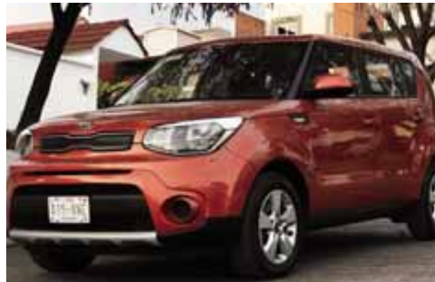
Kia Soul LX Pack | AUTOS RPM

LX La LX es la versión de arranque, cuenta con una transmisión manual de 6 velocidades, un motor 1.6 litros, que otorga 122 hp y un extraordinario consumo de combustible: 14.km/l en promedio en ciudad. En cuanto a la conec-