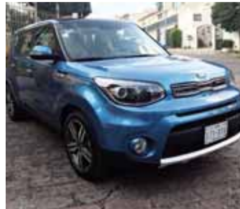
Kia Soul EX Pack | AUTOS RPM

rámico y un motor de 2.0 l y 150 hp y una transmisión automática de 6 velocidades, pantalla touch multimedia de 8" con conectividad Android Auto y Apple Car Play, botón de arranque y llave inteligente; iluminación ambiental en bocinas,