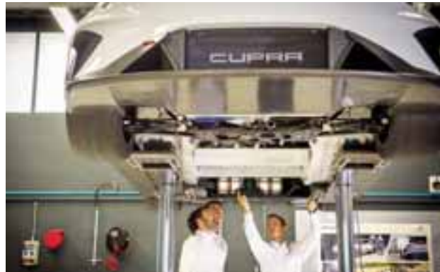
El trabajo de supervisión de los ingenieros llega hasta el último detalle, en la imagen se aprecia que el futuro de la marca contempla propulsión eléctrica.

En este lugar, ubicado a 40 minutos de Barcelona en la localidad de Martorell, todo aficionado sabrá que es la meca de la marca. Y hoy es un gran centro logístico que lleva autos de gran desempeño hacia