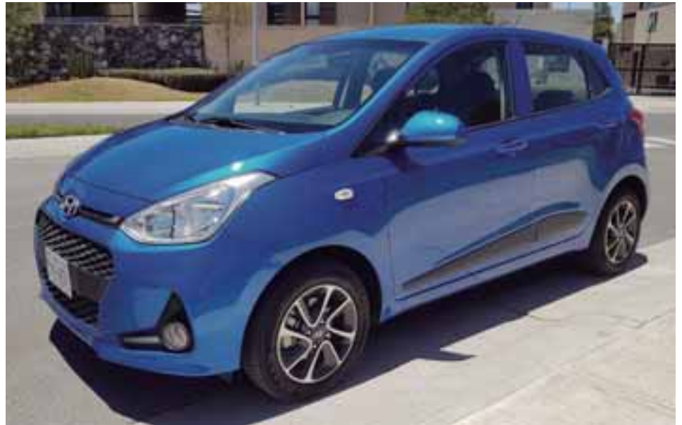
No pierde la carga genética de sus hermanos mayores. Presume una parrilla grande que hace juego con la fascia y luces. | HYUNDAI