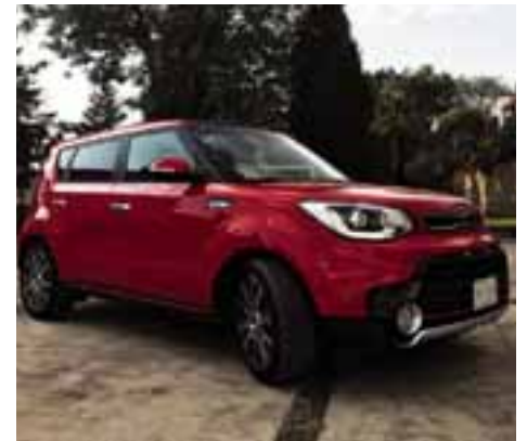
Kia Soul SX DCT Turbo | AUTOS RPM

volante multifuncional en piel y asientos en piel. Un vehículo que responde bien, que es cómodo y con el espacio necesario para que sea considerado una muy buena opción familiar o para un soltero con un estilo de vida dinámico.