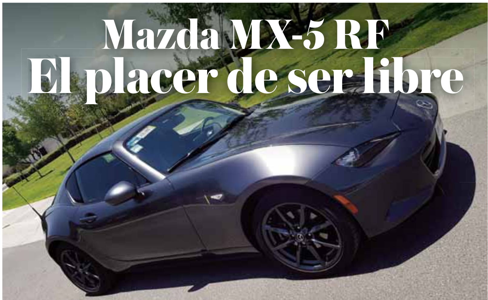
Un largo cofre que da cabida a los grupos ópticos y un diseño muy vanguardista: es un Mazda MX 5. | AUTOS RPM

Ya queremos manejar ese Swift que está por introducir en próximos días.