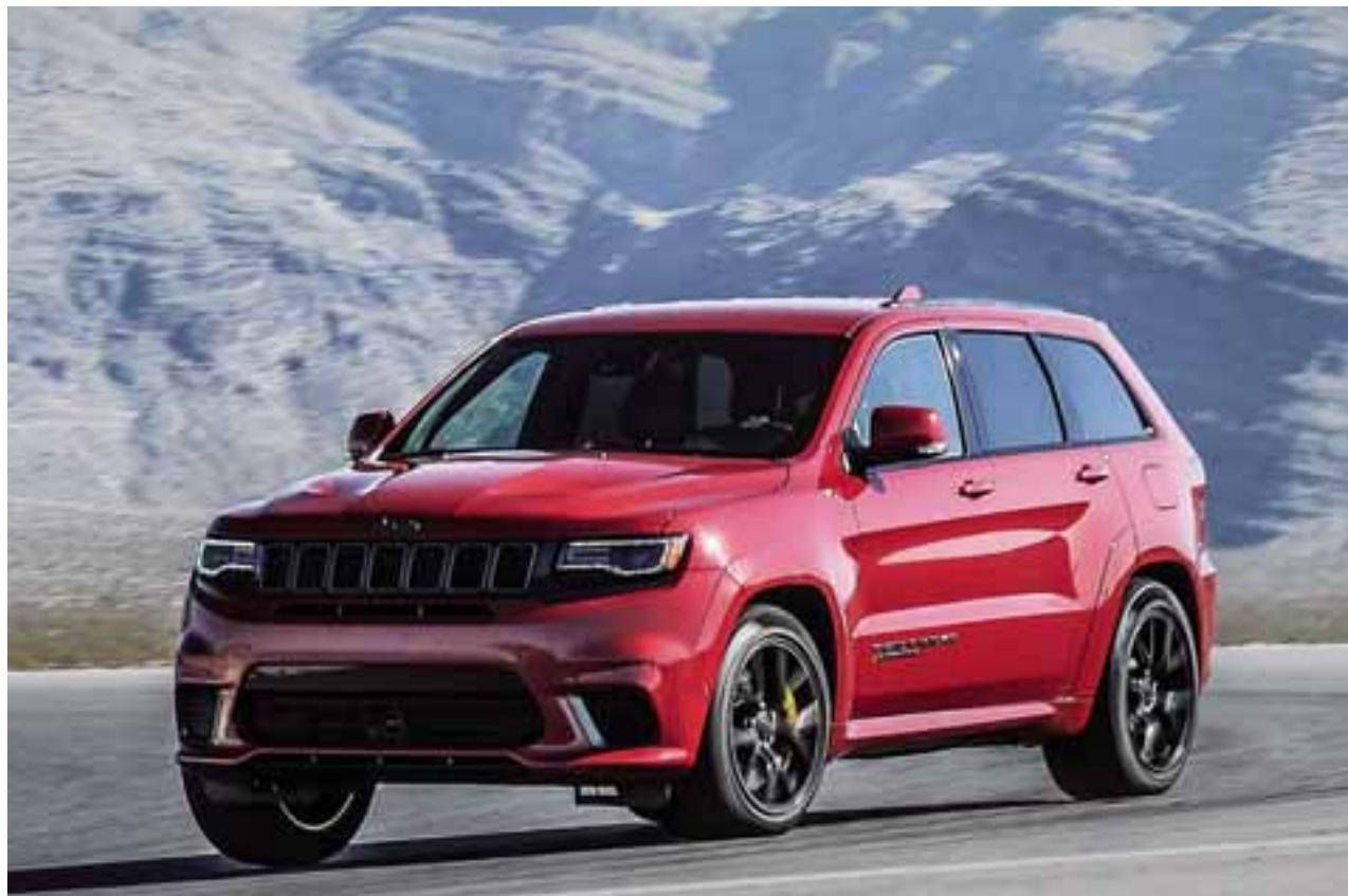
Con 707 caballos este Jeep es el SUV más potente de la historia. | JEEP

Jeep Grand Cherokee Trackhawk posee el sistema Selec-Track de Grand Cherokee Trackhawk utiliza un software de alto rendimiento para configurar previamente