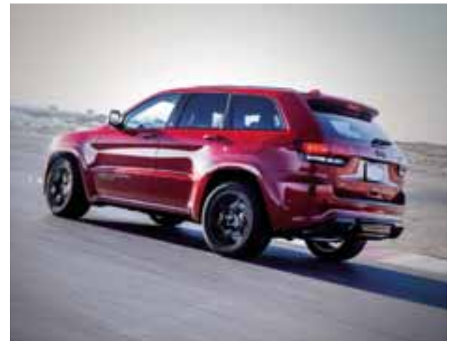
Está disponible en 5 colores diferentes: granito, marfil, negro diamante, rino y rojo Adrenalina. | JEEP