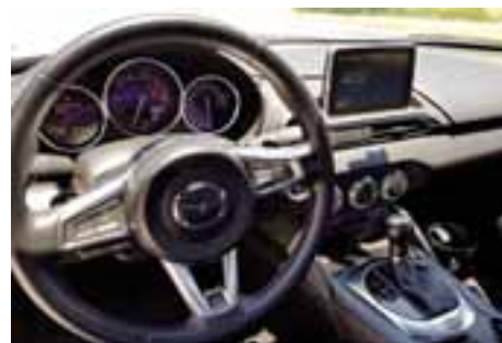
Los interiores lucen acentos deportivos sumamente bien logrados. | AUTOS RPM

No se necesita ir más allá de los 140 km/h para realmente disfrutar un auto personal. Es decir, a 100 km/h se siente y percibe un aire de libertad y seguridad muy al estilo de Mazda, es decir, preciso y divertido. Finalmente, si abusamos de la velocidad en caminos maltratados, el auto pasará la factura, ya que el esquema de suspensión tiende a ser dura más que confortable, pero nada que nos extraña o moleste.