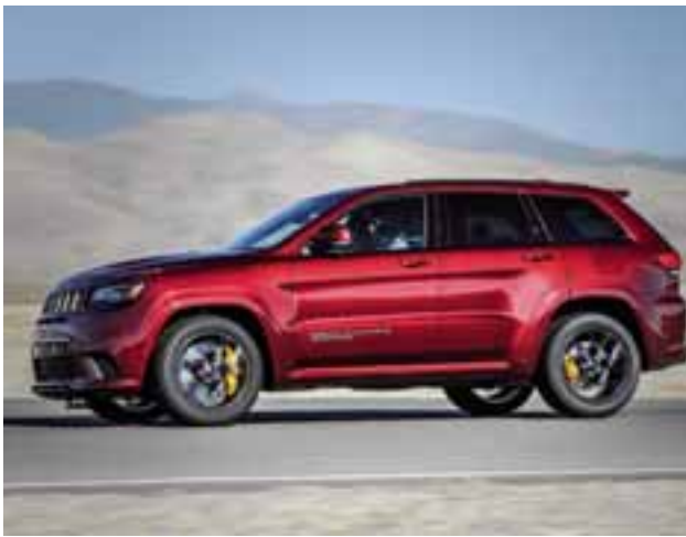
Se han solicitado las 50 primeras unidades, pues se trata de un modelo muy demandado a nivel mundial. | JEEP