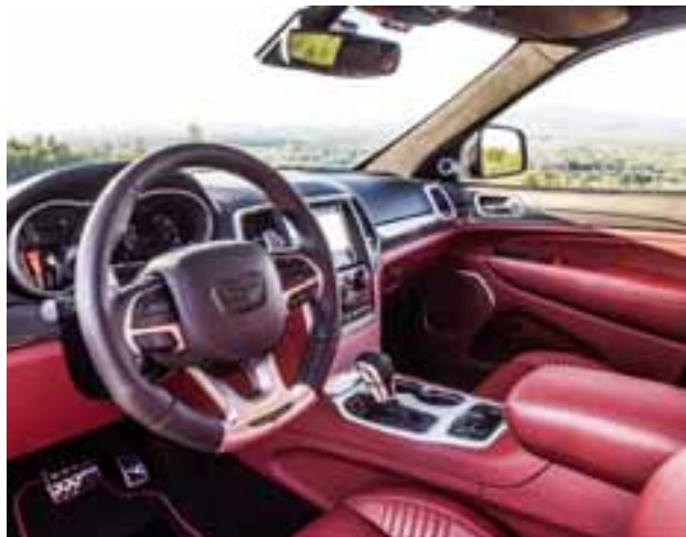
El interior está totalmente orientado a replicar la fiera que luce por fuera, es un deportivo, no cabe duda. | JEEP