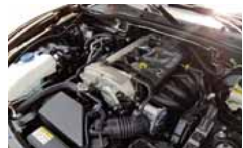
Su motor eroga una potencia de 155 caballos a una caja manual o automática de 6 cambios, suficientes debido a su bajo peso. | AUTOS RPM