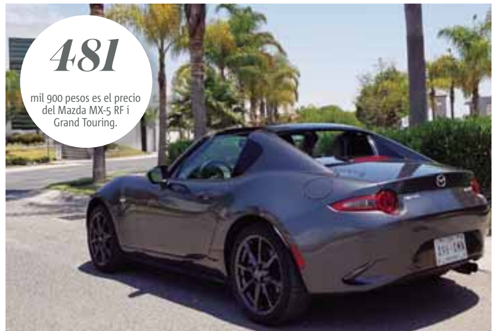
Con un techo en aluminio que se guarda automáticamente en menos de 13 segundos, es uno de los mejores roadster del mercado. | AUTOS RPM