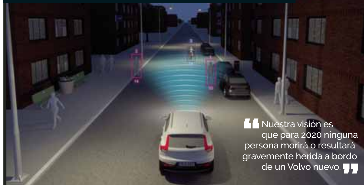
Volvo XC40 es el modelo más pequeño de la nueva gama, pero es enorme en seguridad. Cada Volvo es testado en un laboratorio especial situado en Suecia.

Está dirigida a evitar o mitigar colisiones con otros vehículos que circulan por delante. La mayoría de las colisiones provocadas en ciudad ocurren a velocidades inferiores a 30km/h. El City Safety puede ayudar a evitar una colisión cuando la velocidad es igual o inferior a 15 km/h. A velocidades superiores, la severidad del impacto se puede ver reducida. El Sistema City Safety se desactiva a velocidades superiores a 50 km/h. El propósito principal del City Safety es ayudar a un conductor que se ha distraído un momento y que se encuentra ante una situación crítica.