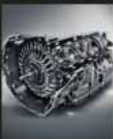
Transmisión 9G-TRONIC de 9 velocidades