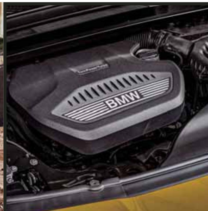
Con el sistema TwinPower Turbo dile adiós al tubolag, cambia a modo manual y sentirás que estás manejando un hot hatch.