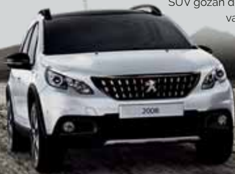
SUV PEUGEOT 2008

Actualmente una gama amplia y seductora de SUV está lista para usted y para su futuro, sus nombres son: 2008, 3008 y 5008, por lo que estrenar en 2018 no será coincidencia.