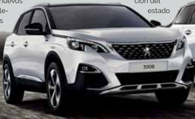
SUV PEUGEOT 3008