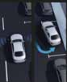
Piloto automático PARKTRONIC con asistencia de estacionado