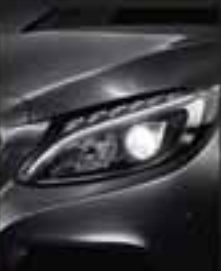
Faros LED High Performance con regulación automática