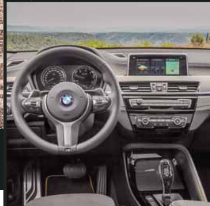
En el interior encontramos buena calidad de materiales y una sencilla manipulación del sistema de infoentretenimiento. Es un BMW.