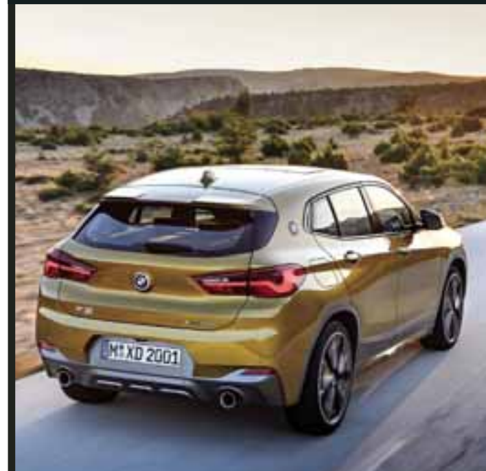
La parte trasera dibuja una silueta muy agresiva, ideal para un público joven que quiere comerse el mundo.