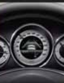
Asistencia de frenado activa para reducir accidentes