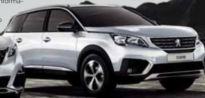
SUV PEUGEOT 5008