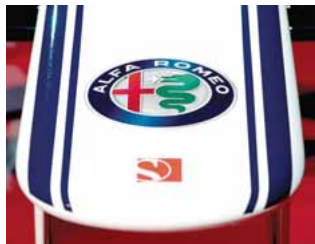
Alfa Romeo regresa a la F1 luego de más de 30 años de ausencia. | ALFA ROMEO