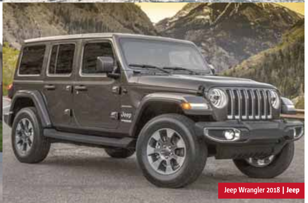
Jeep Wrangler 2018 | Jeep