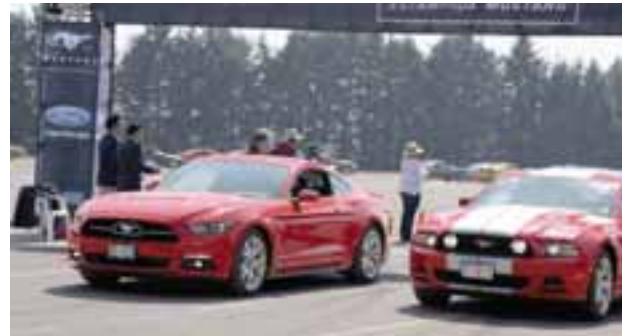
Ford México planeó la logística hace más de 2 años, felicidades.

"Estamos emocionados de haber ganado el título Guinness World Records. Además,