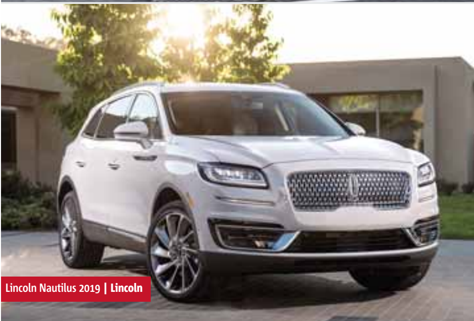
Lincoln Nautilus 2019 | Lincoln