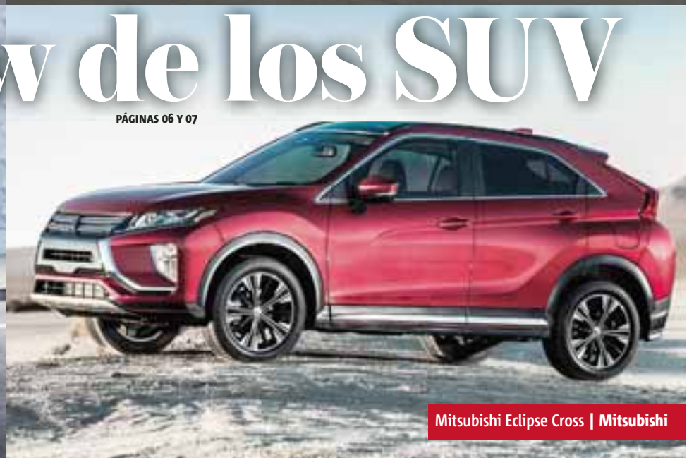
Mitsubishi Eclipse Cross | Mitsubishi