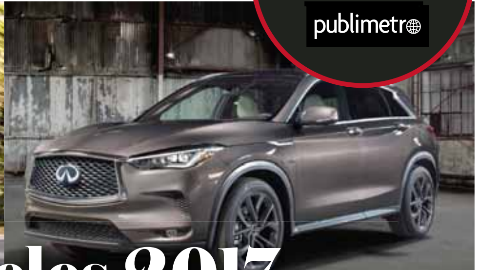
Infiniti QX50 2019 | Infiniti