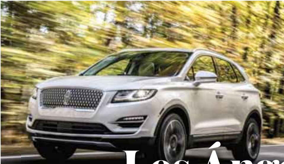
Lincoln MKC 2019 | Lincoln