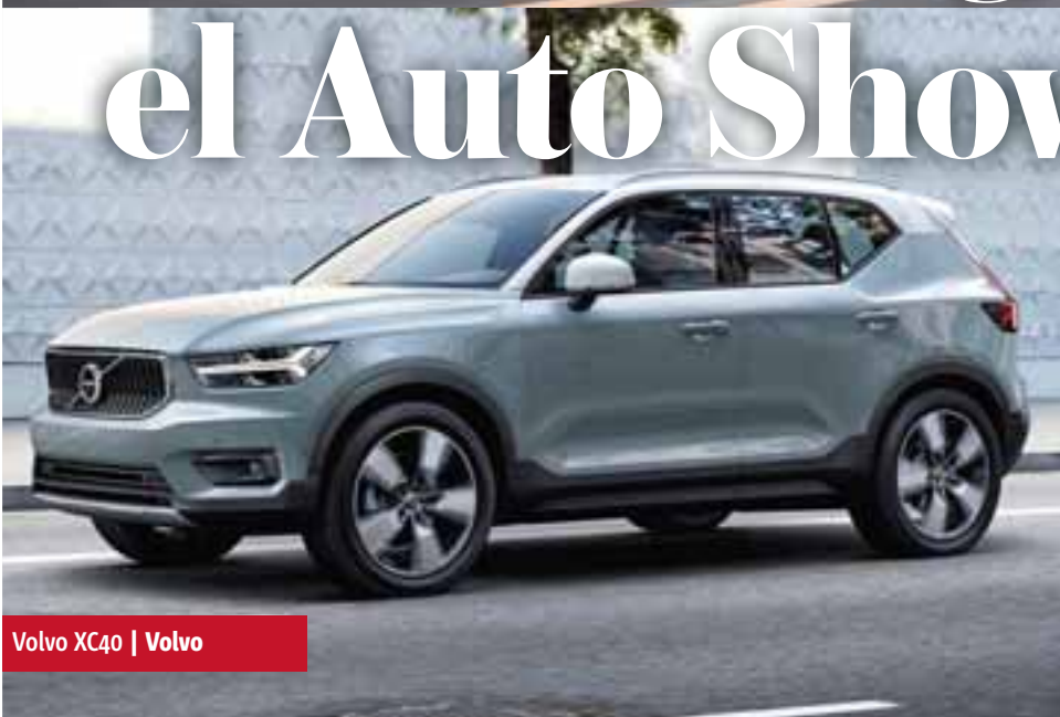
Volvo XC40 | Volvo