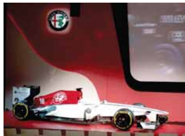
Alfa Romeo correrá con motores Ferrari y harán mancuerna con el equipo Sauber.