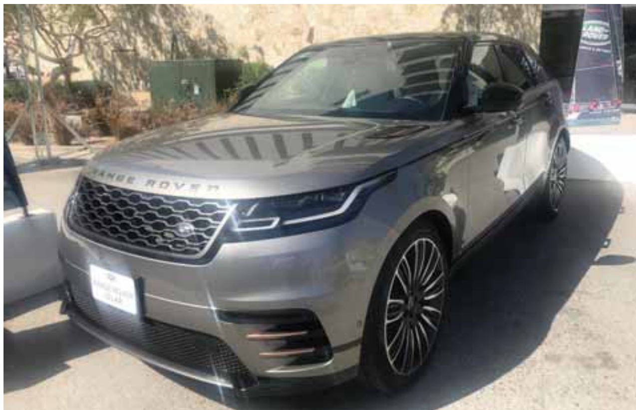
Sus rines de aluminio de 22" ayudan a que la silueta del Range Rover Velar luzca atlética y musculosa. | DANAE CHÁVEZ

Francamente a muchos se les hacía un 4x4 atractivo, pero que dejaba en segundo plano la comodidad, la eficiencia y la tecnología. Sin embargo, el entusiasmo por parte del cliente recibirá en esta nueva generación todo lo que soñó, quizá más. Revisemos: en el Auto Show de Los Ángeles lo presentaron como una estrategia en conjunto, no sólo como un nuevo Wrangler. El modelo Sahara se ofrece con dos puertas o cuatro puertas. De ahí que la emoción llegue a todo tipo de cliente; ya podemos "tirar" el parabrisas de manera sencilla y cientos de detalles alrededor lo posicionan como un verdadero ícono modernizado. Es totalmente nuevo, es decir, su estructura es de siguiente generación con lo cual conseguimos reducción de peso, más eficiencia y mayor capacidad en todos los sentidos. Su capacidad de vadeo es máxima, tanto como lo es su condición de absorción de impactos. Así, los ingenieros han escrito, no una página más de Jeep, sino que han inaugurado un nuevo tomo en esta virtuosa enciclopedia. Podemos coincidir que es perfecto para la ciudad y el campo, los baches y el desierto, las actividades al aire libre o para ir a la oficina. Sin duda, reyes hay pocos y Jeep es el rey del todoterreno; de los caminos más difíciles sobre el planeta, pero también lo es en la jungla de asfalto de su ciudad. En todos ellos ¡es la ley! No se asombre con el precio que anunciará para México, lo vale.