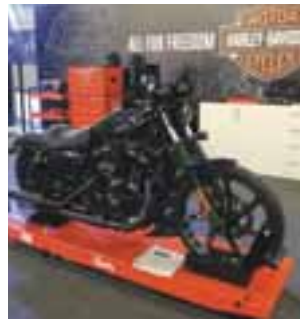
Si no pudiste ir, ¡no te pierdas los 115 años de la marca! | AUTOS RPM

con la seguridad total que, en colaboración con el gobierno de la CDMX, Harley-Davidson México ofreció a sus aficionados. Los clientes también gozaron de atractivas promociones para hacerse de una nueva moto, y qué decir de la barber shop , el salón de tatuajes y el de belleza para ellas; las pruebas de manejo el jump start y hasta un euro bungee formaron parte de la dinámica que cerró con el concierto de Enjambre y Matute.