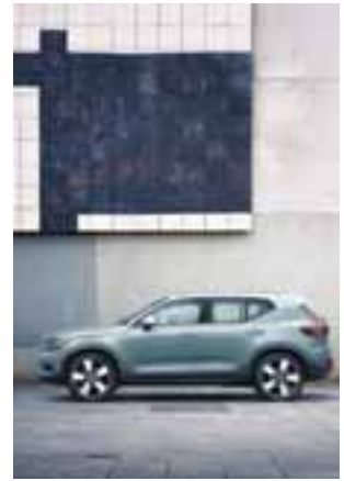
El lateral destaca por su robustez y dinamismo.

El nuevo miembro de la familia XC estará disponible con un motor T5 de 4 cilindros. Sin dar a conocer fechas sí se anunció que habrá opciones híbridas y totalmente eléctricas en un futuro cercano.