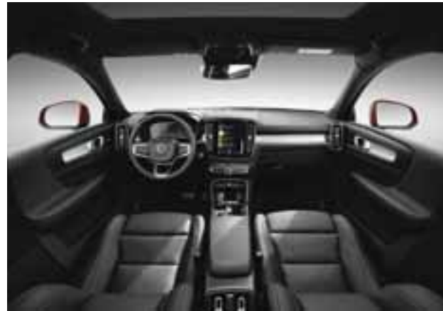
Admiramos un interior con el sello familiar de la marca, pantalla central inmensa y un diseño minimalista, elegante, pero juvenil. | VOLVO

pulgadas y Sensus Connect, que ayudará a un manejo intuitivo del sistema de infotretamiento y de todas las características del vehículo. Además, cuenta de forma estandarizada con el Sistema City Safety.