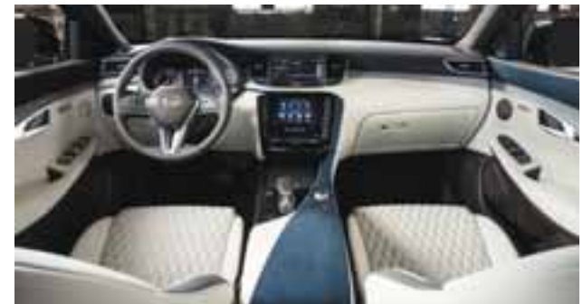
El interior es sofisticado, acogedor y comulga muy bien con las líneas exteriores. | INFINITI