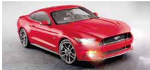
Ford busca romper récord Guinness con Estampida Mustang. | FORD

registro de cada conductor. Después, el 2 de diciembre Ford recibirá los Mustang en el Centro Dinámico Pegaso en un horario de 9:00 a 18:00 horas. Ahí revisarán los documentos oficiales del vehículo: tarjeta de circu-