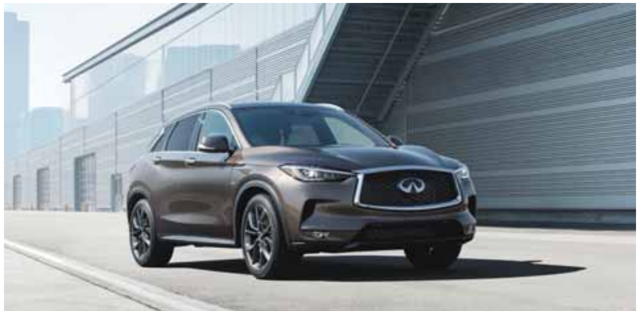
Se espera que este vehículo sea ensamblado en el complejo COMPAS de Aguascalientes, inversión combinada con Daimler.

podrá detener el crono en 6.3 segundos (versión AWD) y alcanzar los 230 kilómetros por hora de velocidad tope. La nueva plataforma está construida en acero Super High Formability, que ahorra peso y mejora la rigidez torsional en un 23% respecto a generaciones anteriores. El sistema de asistencia al conductor conocido como ProPilot Assist se enfoca en asistir al conductor durante su experiencia de manejo, ayudando a que la conducción sea placentera y a mejorar la experiencia detrás del volante. Se brindan ayudas en el frenado, la aceleración y la dirección del vehículo.