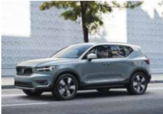
Con el lanzamiento del XC40, queda de manifiesto que la estrategia de la marca sueca seguirá centrada en los SUV. | VOLVO

La versatilidad que muestra el XC40 en cada uno de sus detalles es digno de destacarse, para empezar, se ofrecerá con una amplia gama de combinaciones de color para el exterior que contrastan con su techo panorámico. Su frente, despliega los distintivos faros de Martillo de Thor, su parrilla se percibe mucho