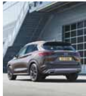
El diseño destaca por su fluidez deportiva y elegante. | INFINITI

Finalmente, en cuestión estética, el pilar de diseño de la marca como poderosa elegancia. Así que el exterior luce aerodinámico y deportivo, pero a la vez no escatima en la elegancia del ejemplar. Todos y cada uno de los elementos de la carrocería fueron diseñados para que el aire corra libre y se reduzcan las turbulencias, mientras que en el interior contamos con materiales de alta calidad, los cuales ofrecen una experiencia acogedora, cómoda y flexible.