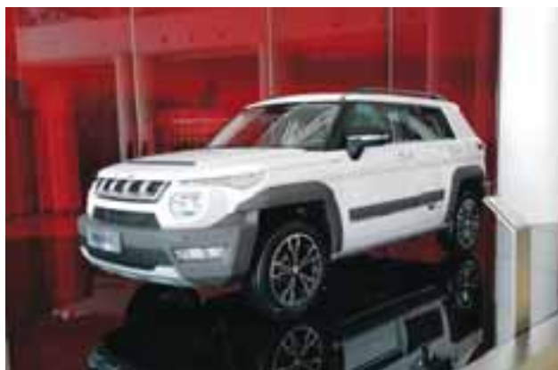
BJ 20 es el modelo todo terreno ligero de la marca. | MARIO ROSSI

Con números por encima de los dos millones de autos producidos en un solo año, BAIC está dispuesta a conquistar el mercado nacional con productos de muy buena calidad, bajo consumo de combustible y garantías que están a la altura de marcas occidentales por demás reconocidas