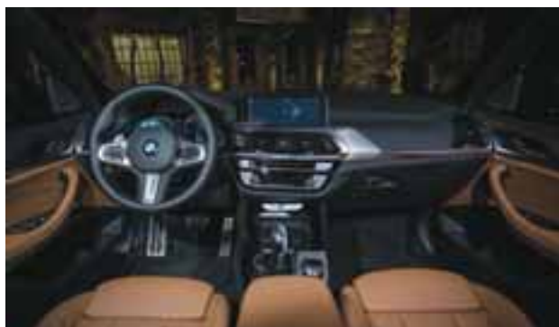
BMW ConnectedDrive – junto con los sistemas de asistencia para el conductor de BMW Personal CoPilot – está conformado por Servicios y apps de BMW ConnectedDrive . | BMW