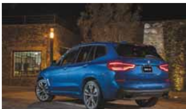
Hill Descent Control : regulación automática de la velocidad en pendientes a menos de 40 km/h. | BMW