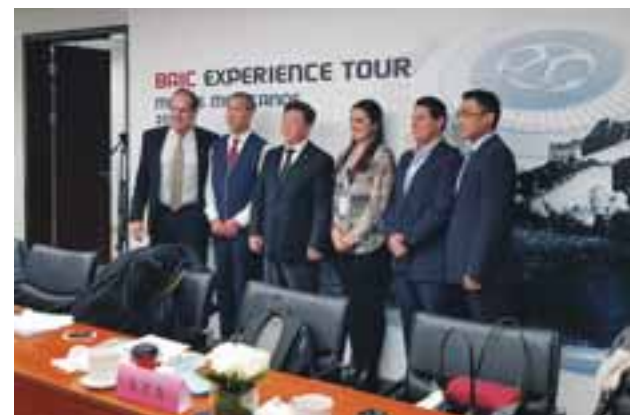
Directivos de la compañía se reunieron con los medios especializados. | MR