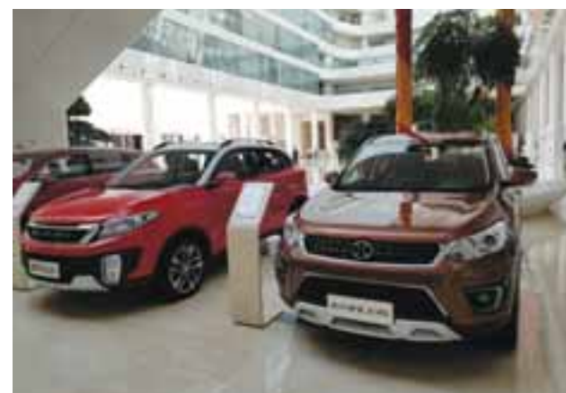
Autos híbridos y eléctricos son el presente y el futuro de BAIC. | MR