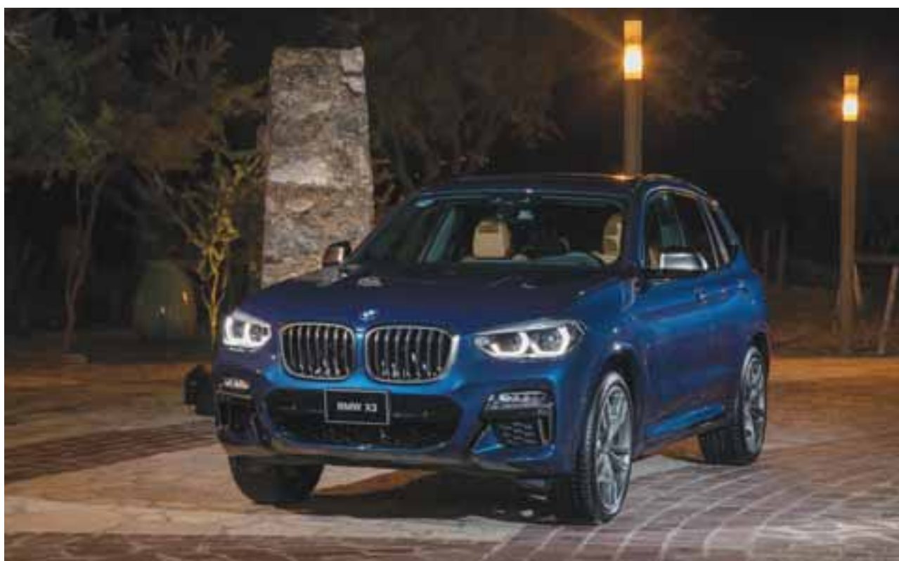
Faros LED y faros de niebla LED. | BMW