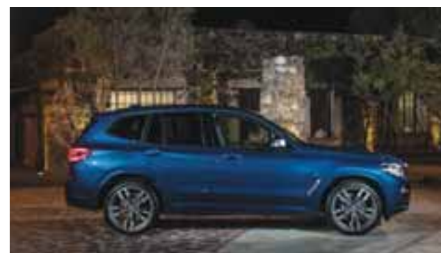
El nuevo X3 presenta una esculpida silueta que es tanto elegante como deportiva. | BMW