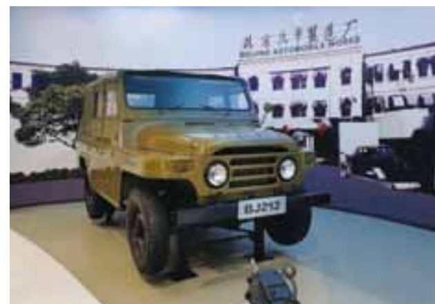
El BJ 212 fue el primer todo terreno de la marca para la milicia. | MR