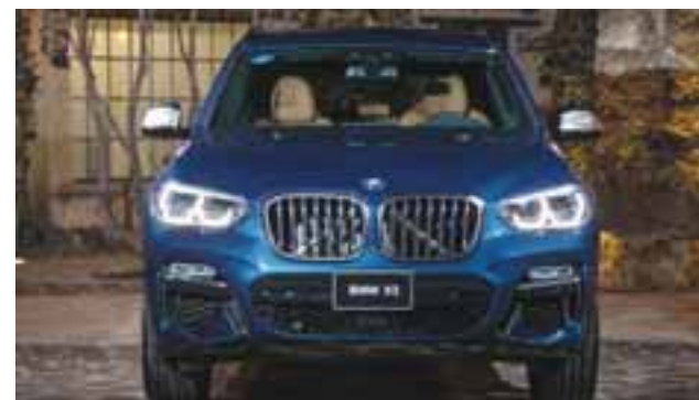
La característica parrilla de doble riñón es más protuberante que en las generaciones anteriores. | BMW