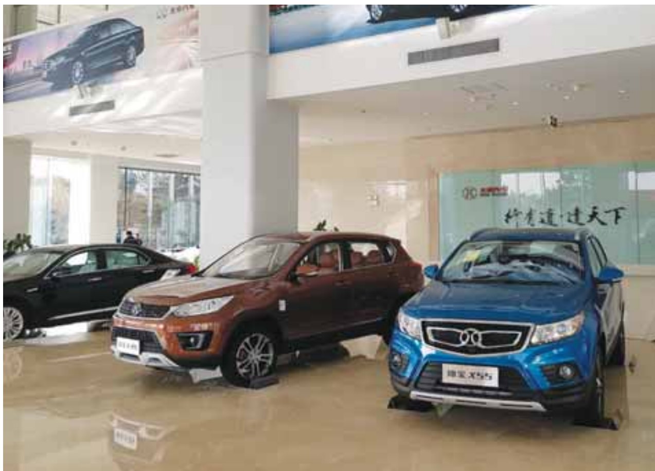
Así es la recepción del corporativo de BAIC en Beijing, China, donde están exhibidos los primeros modelos ensamblados en la planta de Pekín.

X35 y el BJ20. En breve, BAIC nos tendrá mayores sorpresas con autos propulsados con motores eléctricos e híbridos, los cuales ya ruedan con gran éxito en el país asiático, incluso, conocimos sedanes que son capaces de recorrer hasta 500 kilómetros sin recargar baterías. Además, la firma cuenta con una planta de intercambio instantáneo de baterías, en donde un auto llega, cambia la batería en menos de dos minutos y se va.