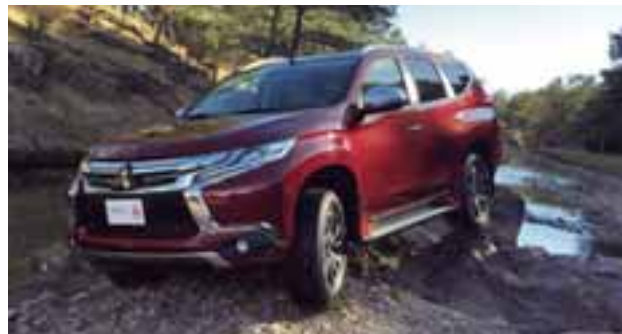
La nueva Montero Sport es un verdadero gato montés, pero más bonito. | N. DELGADO

La nueva generación de la Mitsubishi Montero Sport irrumpe dentro del segmento de las SUV medianas desmarcándose del resto no únicamente por su diseño, sino también por la robustez de sus capacidades, derivadas de una configuración con base en chasis, frente a las configuraciones “monocasco” del resto de sus competidoras directas. Su mayor rigidez y capacidad de torsión, la versión Advance 4 x 4 con cuatro posibles formas de manejo incluyendo la de todo terreno extremo con bloqueo de diferencial, sus tres filas de asientos y