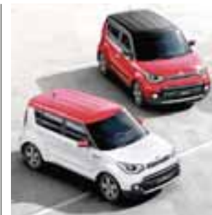
KIA Soul 2018 ahora añade techo panorámico asientos en piel suave y tres motorizaciones diferentes. | KIA

de Nissan en Aguascalientes, tendrá un precio de 370 mil 900 pesos.