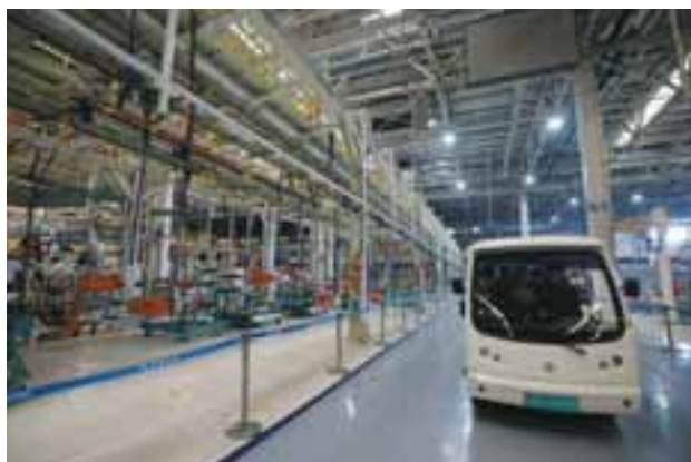
La planta de producción de BAIC puede ensamblar hasta 300 mil autos al año.