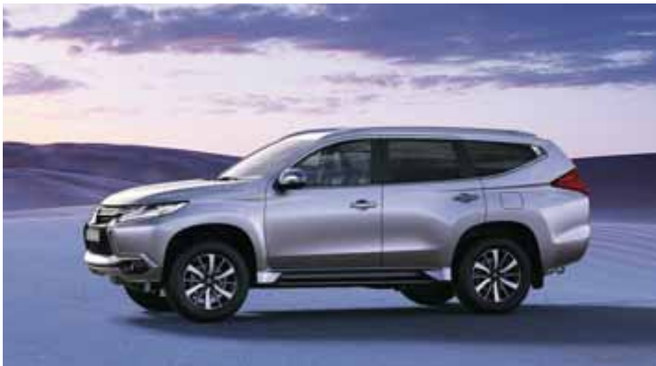
Llegará a marcar pauta en el segmento de los vehículos familiares de aventura. | MITSUBISHI

Como buen Mitsubishi, además del camino, destaca fuera de este, con la opción a tracción integral con bloqueo de diferencia electrónico, que no todos tienen.