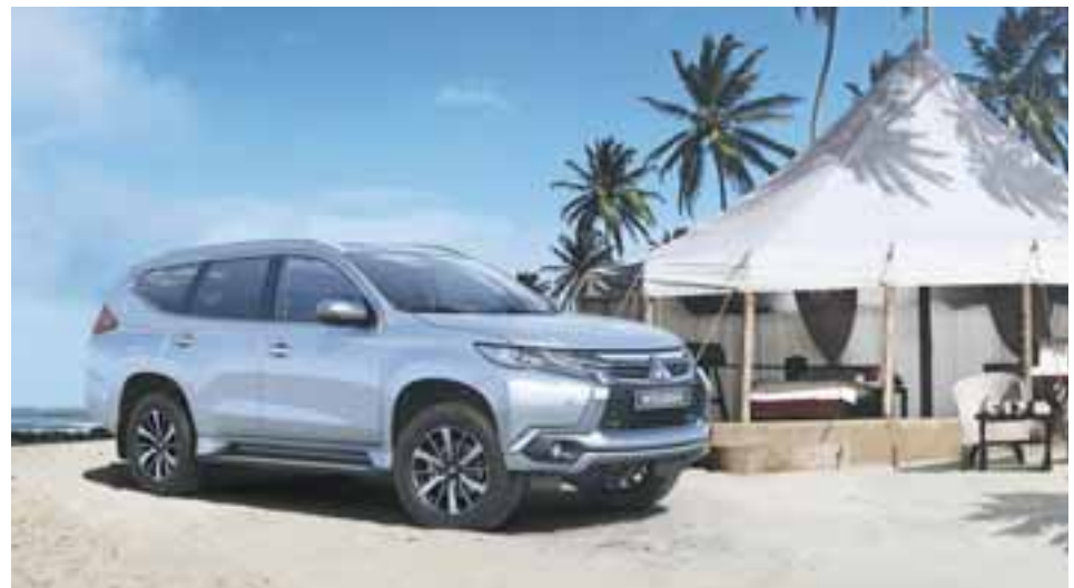
Tuvimos oportunidad de constatar su enorme capacidad todo camino, pero también de enamorarnos con su diseño. | MITSUBISHI