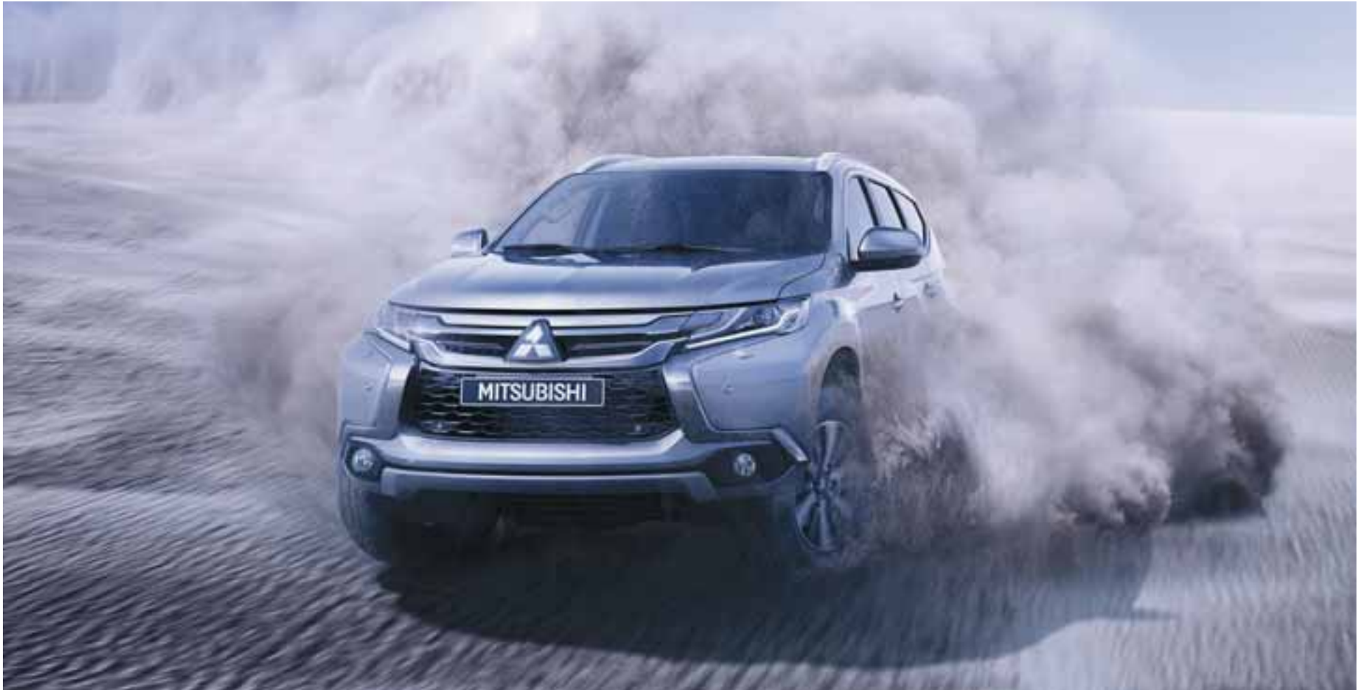
Mitsubishi Montero Sport es un verdadero gato montés. | MITSUBISHI

Mitsubishi Montero se propone como un vehículo familiar, personal y de emoción, ideal para todas las facetas de tu vida