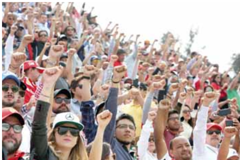
Durante la vuelta 19 todos los asistentes elevaron su puño derecho en señal de apoyo a los caídos en los sismos del 7 y 19 de septiembre.

Sin embargo, quien hizo vibrar el asfalto nacional fue ni más ni menos que el héroe local Sergio El Checo Pérez, ya que con cada pasada a través de las tribunas la afición enloquecía, motivación