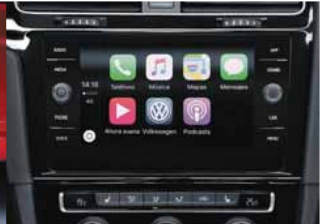
Rines deportivos y en el interior lucen algunos detalles cromados junto con una nueva pantalla de ocho pulgadas bien integrada en la consola. | GOLF