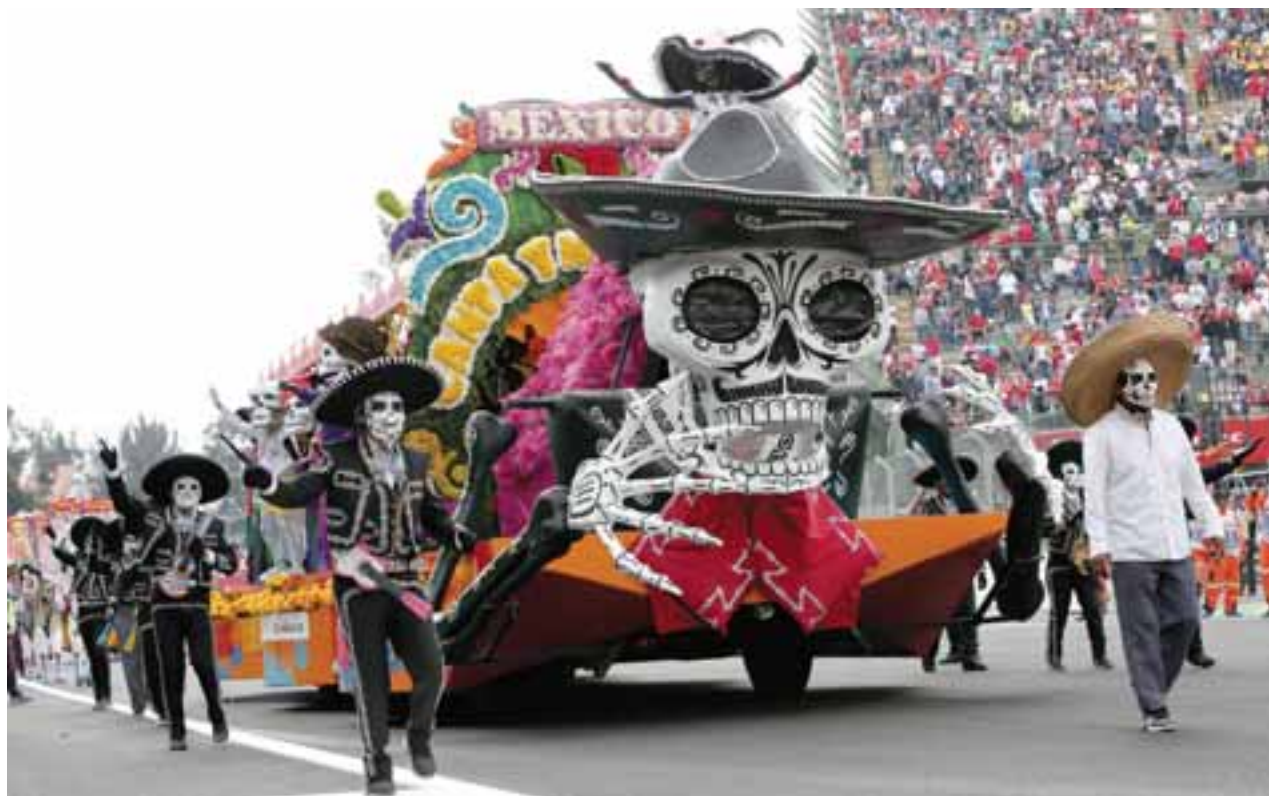
El ambiente festivo se enriqueció con el tradicional desfile del Día de Muertos. | PAOLA GONZÁLEZ

Ejemplos hay muchos, pero esta semana VW introduce su T-Roc como el siguiente crossover de su portafolio y que se situará por debajo de Tiguan, que también tendrá un "hermano mayor" que aún no tiene nombre oficial en México. VW uno de los mayores grupos se aviva en este sector y ésta podría ser su arma letal para conseguir mayor volumen con un diseño sin igual y prestaciones genuinas, un vehículo que, además, no estaría lejos de pensarse para ser fabricado en México. La pregunta es: ¿extrañará los sedanes o hatchbacks?