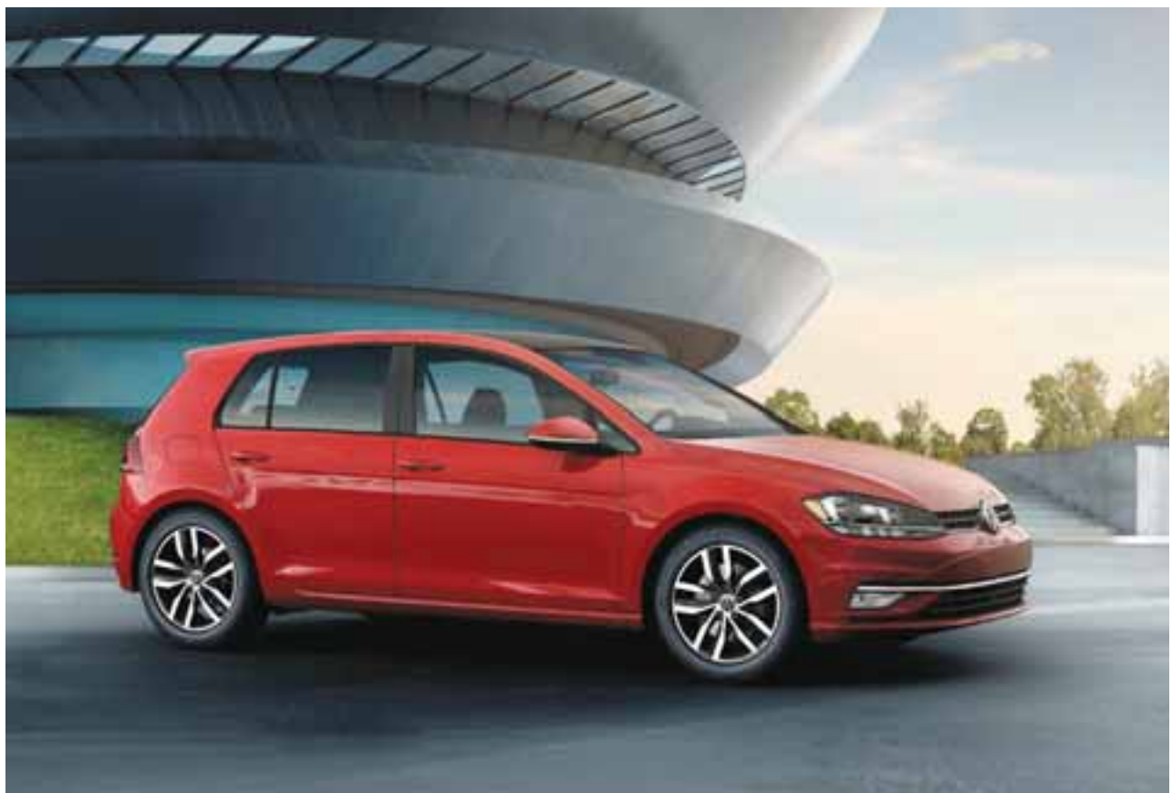
Fascias más prominentes, iluminación LED y un nuevo frente. | GOLF