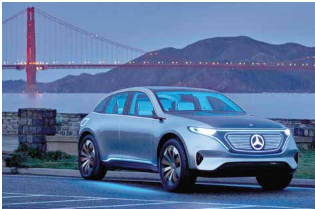
Basado en una nueva división de marca de nombre EQ, se acerca a la producción un hatchback eléctrico, inteligente y conectado. | MERCEDES-BENZ

Esta semana ha estado llena de sorpresas por motivo del Auto Show de Frankfurt . La tecnología autónoma y la electrificación son los grandes protagonistas