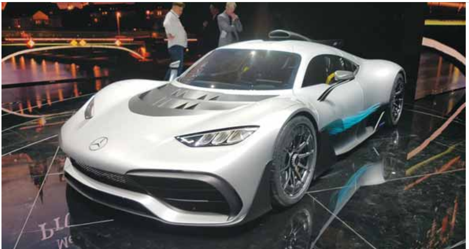
| MARIO ROSSI

Con un estreno mundial en el Salón Internacional del Automóvil (IAA) de Frankfurt por primera vez, el auto bi plaza supersports mostrará la más reciente y eficiente tecnología de Fórmula 1 de la pista de carreras a la carretera casi par de par para representar el punto culminante del 50 aniversario de AMG. Este híbrido de alto rendimiento produce más de mil caballos de fuerza y alcanza velocidades máximas más allá de 350 km/h. El coche de la demostración combina el funcionamiento excepcional de la pista de raza y la tecnología híbrida convencional de la Fórmula 1 del día a día con eficacia ejemplar. Este es un mundo primero. La responsabilidad general de la realización del Proyecto ONE radica en Mercedes-AMG.