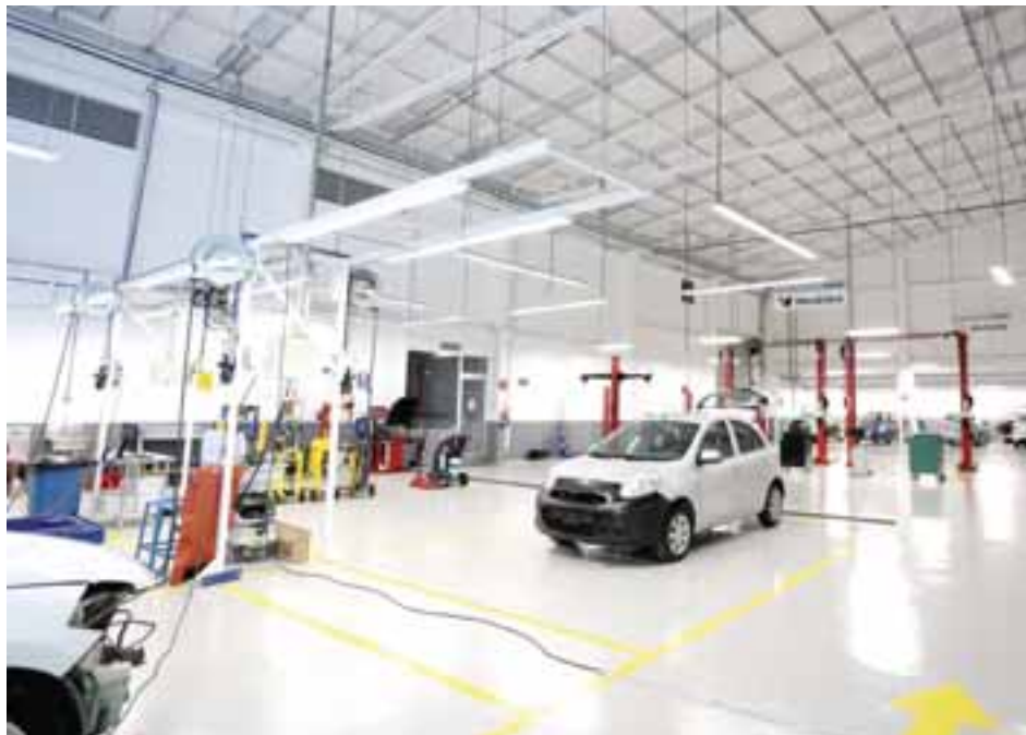
Es uno de los talleres más grandes de la marca nipona en Latinoamérica. | NISSAN

Nissan Jidosha se encuentra ubicado en un terreno de 10 mil m 2 con una construcción total de 4 mil 500 m 2 . Es importante mencionar que sus instalaciones están diseñadas con el enfoque del sistema de producción de las plantas de manufactura de la compañía. Esto significa que