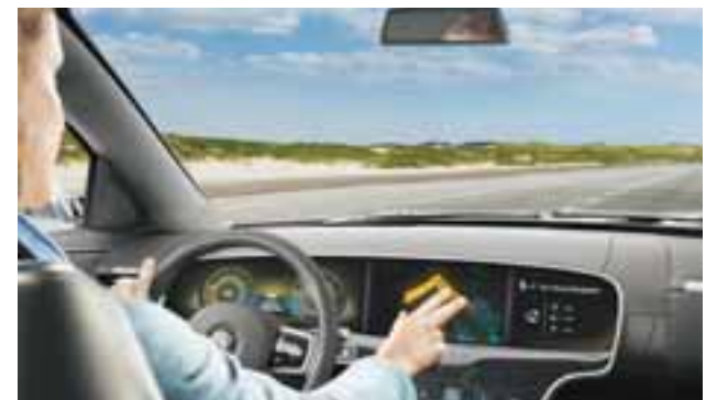
Mediante señales con los dedos usted puede dar instrucciones. Por ejemplo, con tan sólo un movimiento podrá indicar al navegador y a su auto el ir a su casa.