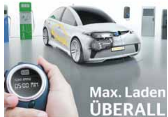
Con el All Charge de Continental, no importa dónde cargue su auto: será capaz de llenarlo de energía con cualquier corriente, librándose del estrés por carga. | CONTINENTAL AG

Es tanto el impacto digital hoy, que los autos se comunicarán, se conectarán a la red; a cada metro de recorrido nutrirán la base de datos de los caminos del mundo y así se harán cada día más exactos y mucho más seguros, mejorando cada vez más la asistencia a conductores en el presente y futuro inmediato, y el manejo autónomo de vehículos en el mediano plazo. “Es tal el impacto que vemos en este año 2017, que ningún auto que se presente en el próximo Auto Show de Frankfurt —que inicia el 14 de septiembre— estará exento de tecnologías de manejo autónomo y conectividad”, afirmó Degenhart en sus oficinas en Hannover, donde lo pudimos conocer. Simplemente, él es el hombre que ha venido a renovar la visión de la empresa y a hacer de ésta el gran tanque de pensamiento hacia el futuro que es.