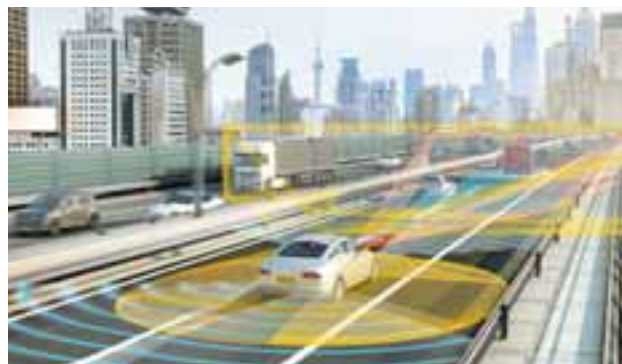
Chofer de velocidad crucero: su auto detectará su nivel de alerta y podrá tomar decisiones en carretera para manejarse con múltiples sensores, cámaras y conectividad.