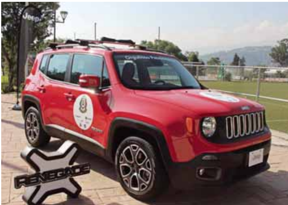
Jeep fue anunciado como el vehículo oficial de la Selección mexicana de fútbol.

Se trata de una alianza estratégica que durará dos años