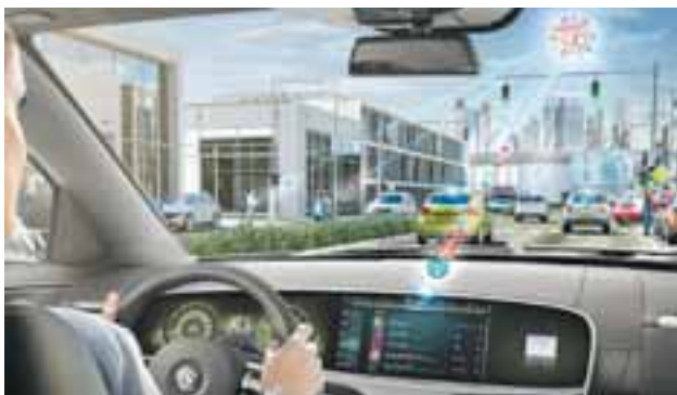
Los autos conectados a la nube podrán ser actualizados en tiempo real. Será como una computadora, donde se añaden microprocesadores para incrementar la velocidad y las funciones de su auto.