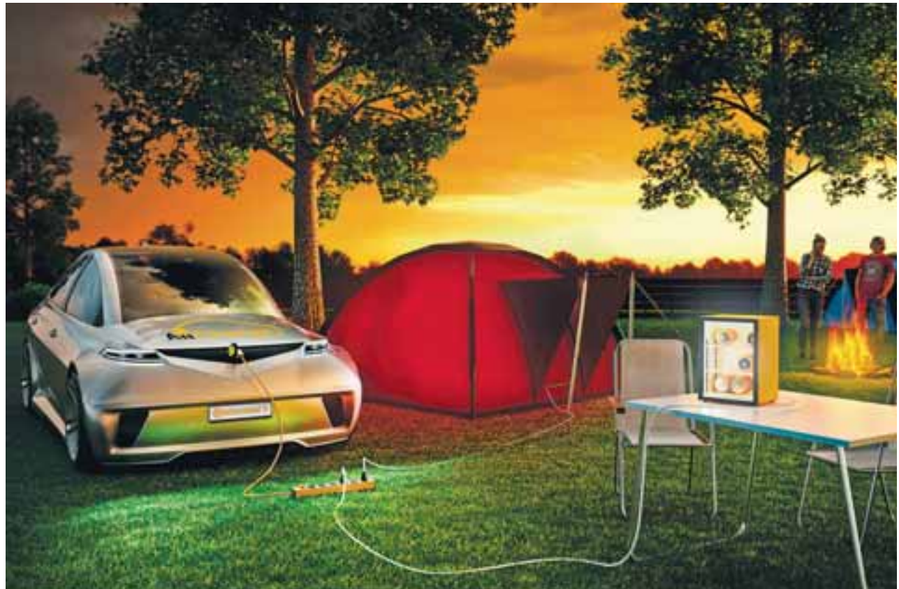
El auto tendrá muchas oportunidades de carga: llegará a su casa y podrá dar energía a muchos aparatos, e incluso, en un día de campo, el auto será su fuente de poder.

El futuro de poder cortar la distancia de frenado, la resistencia al rodamiento, bajar el ruido del camino, mejorar la durabilidad y sus compuestos, es materia de todos los días en Hannover, donde el centro de desarrollo y el centro de pruebas llamado Contidorm, con 50 años de existencia, desarrollan lo mejor según lo que los fabricantes requieran: autos eléctricos, deportivos o camiones, todos necesitan algo distinto. Continental Tire lo hace posible en este lado del negocio, que representa el 26% de todo lo que hacen.