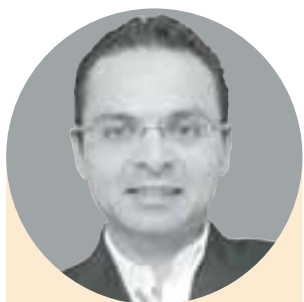
TAQUÍMETRO MEMO LIRA TWITTER: @MemoLiraP * Esta columna sólo refleja el punto de vista de su autor.