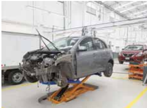
Los novedosos procesos que aquí se siguen son ya un referente. | MARIO ROSSI

cuentan con una operación de flujo continuo, tal y como funciona una línea de producción, lo que permite una mayor sincronización y productividad de los procesos.