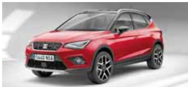
Nuevo SEAT Arona; el crossover definitivo para la ciudad. | SEAT

Llegará a principios del próximo año a nuestro país, a un segmento en crecimiento y consolidación. Se trata del nuevo crossover de la firma de Martorell, que estará montado en la plataforma MQB A0 y que llegará a pelear en el segmento B, de frente con rivales tan importantes como Mazda CX-3, Hyundai Creta, Chevrolet Trax y