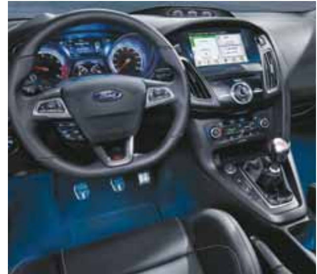
El habitáculo es amplio y permite el acomodo de cinco adultos. | MR