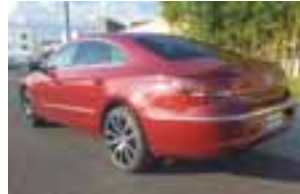
La parte trasera es quizá la más bonita en diseño en la gama VW. | MR

Este auto llega directamente de Alemania y vale mucho la pena hacerlo de colección ya que serán pocas unidades