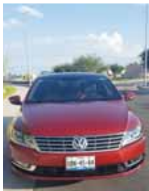
El uso de cromo en la parrilla y laterales le confieren distinción.

Para esta versión, Volkswagen de México ha decidido incorporar un interior de doble tono con piel color negra y roja, detalle que nos agradó, además de que el color exterior es únicamente denominado Rojo Fortana, el cual hace juego con los