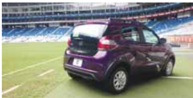
El estilo europeo de este auto es un valor agregado.