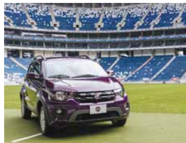
Compacto y sólido son las impresiones que da este nuevo coche de la familia FIAT, el cual ya está en los pisos de venta de la marca. | MARIO CAÑAS