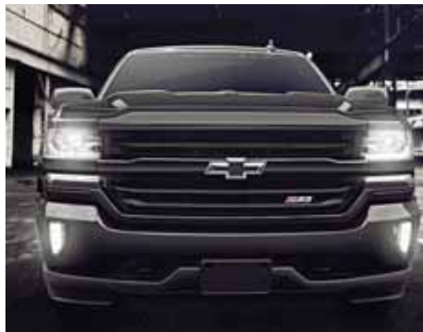
La parte frontal luce en negro total, detalle que los más puristas reconocerán.

En cuanto a infoentretenimiento, Cheyenne Midnight cuenta con la última versión de Chevrolet MyLink con pantalla táctil a color de 8 pulgadas, reconocimiento de voz y smartphone integration con Apple Car PlayTM y Android AutoTM. Además de Blu-Ray DVD con audífonos inalámbricos, sistema de audio Bose y amplificador.