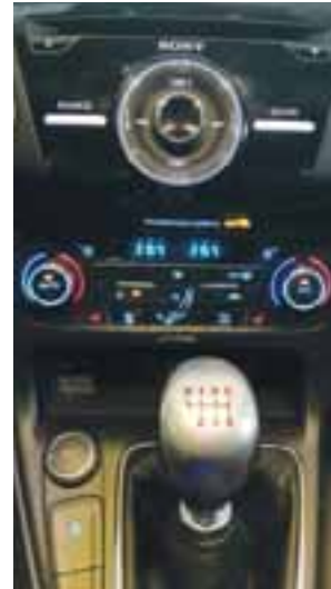
Sony y 10 bocinas con subwoofer emiten el sonido para el ST.

Finalmente, debemos de decir que los frenos actúan de manera correcta y no muestran fatiga. Únicamente si abusamos de ellos en pista, tendrán un leve cansancio, pero la efectividad seguirá siendo la constante del auto.