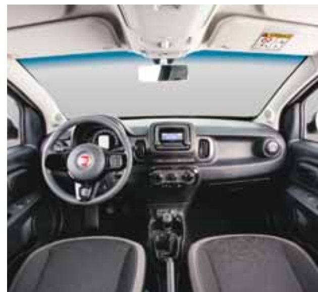
El interior del Mobi luce juvenil y de buena hechura. Todo está a la mano. | FIAT