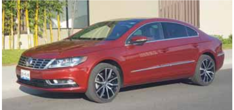
Personal, refinado y atlético, así es el CC que Volkswagen de México comercializa en edición especial. ¡De colección! | MR

El precio de este auto es de 545 mil 990 y ya se encuentra disponible en todas las agencias de Volkswagen del territorio nacional.