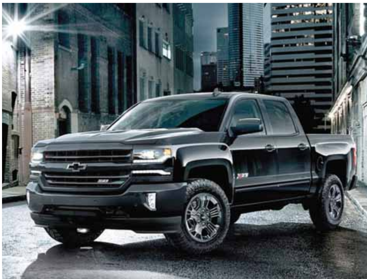
Sólo para México. Esta versión estará lista a partir de enero de 2017 con un precio aún por definir. Lo que sí sabemos es que el motor es un poderoso V8 de 6.2L y 420 hp.

Son 15 años, una planta nueva, pickups en Tijuana completas y cada día más volumen.