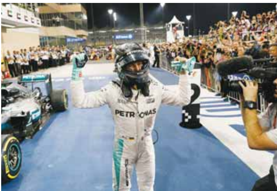
Con nueve triunfos en el año, el alemán Nico Rosberg logró el campeonato de la Fórmula 1 este año, en un cierre de carrera en el que demostró el temple necesario para asegurar el título. Cinco días después de este logro anunciaría su retiro de las pistas de la máxima categoría.