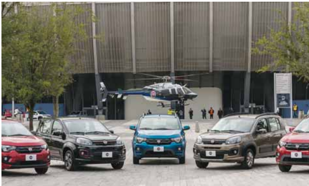
El lanzamiento del Mobi y Uno fue espectacular. El estadio de los Rayados del Monterrey fue el escenario perfecto para conocer de primera mano estos dos nuevos productos, además de la nueva estrategia del Grupo FCA.