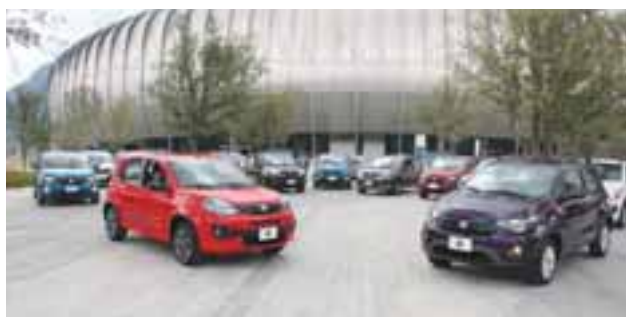
Alineación ganadora. Listos para dar la pelea por la cima del segmento | MC