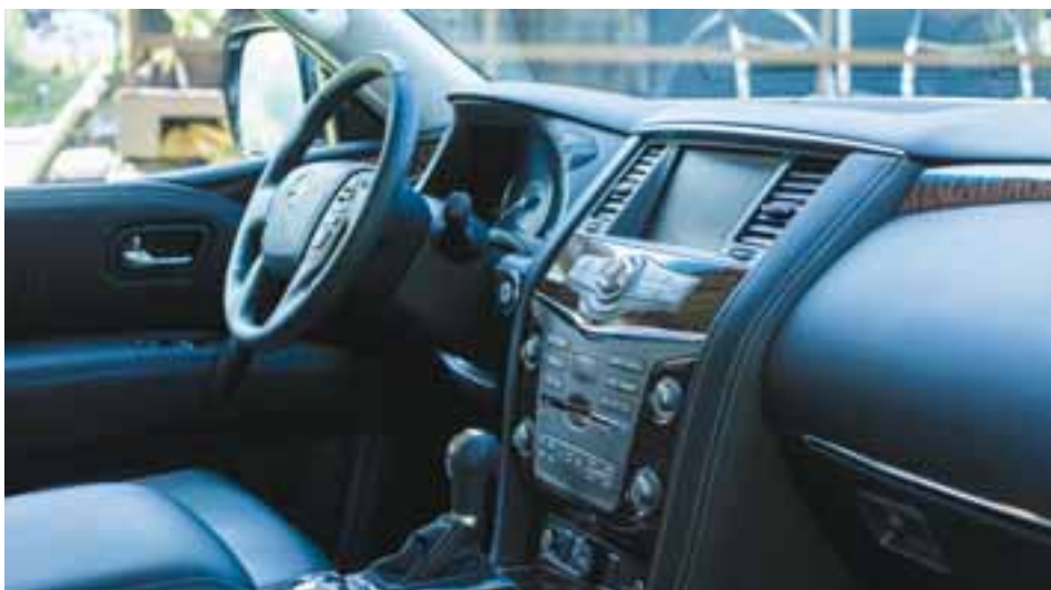
El interior es suntuoso y permite el acomodo de hasta siete pasajeros con amplitud, detalle necesario en este segmento. |NISSAN