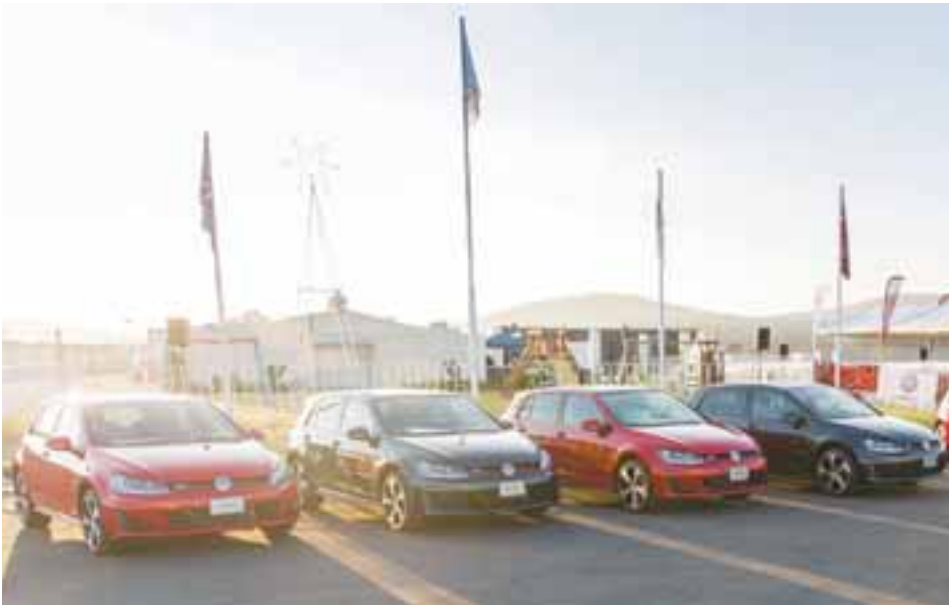
Cuatro décadas se dicen fácil, pero la verdad es que celebrar con los GTI en México fue una oda a la pasión y entusiasmo.