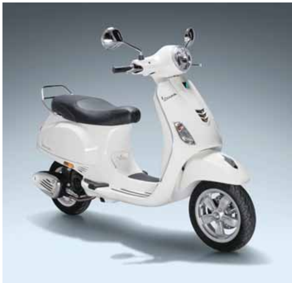
Vespa Clásica en México. Llegará en Edición Limitada de 946 unidades y éstas tendrán un precio de 68 mil 500 pesos. | VESPA

Un nuevo tipo de distribuidor que contará con área de exhibición de las cuatro marcas que llegarán al país a partir de este