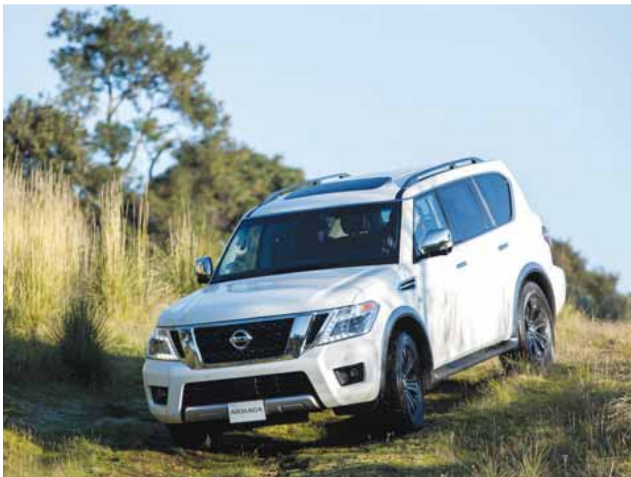
Tanto en pavimento como fuera de él, Nissan Armada permite hacer rutas reales 4X4 sin que, prácticamente, nada la detenga. Son 390 caballos que trabajan adecuadamente a las cuatro ruedas y además, tiene la capacidad de arrastrar hasta casi cuatro mil kilogramos, lo que la coloca como la más poderosa de su segmento. |NISSAN

Asimismo, Nissan Armada tiene la capacidad de colapsar la segunda fila de asientos 60/40 y la tercera fila plegable electrónicamente 60/40 para habilitar un volumen