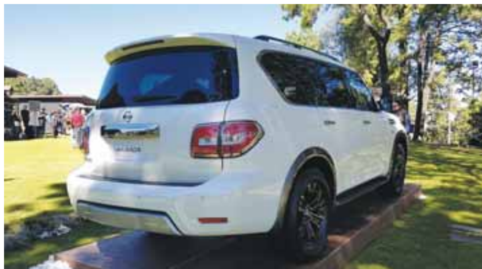
La parte posterior acusa de un portón grande y de funcionamiento eléctrico, lo que facilita su uso. |NISSAN