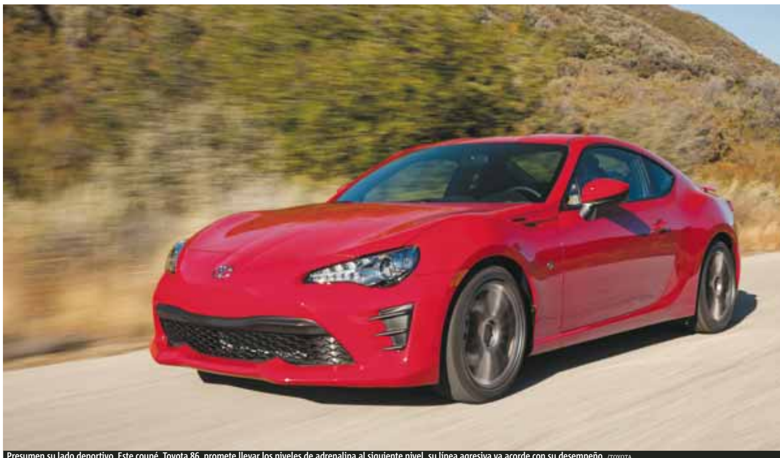
Presumen su lado deportivo. Este coupé, Toyota 86, promete llevar los niveles de adrenalina al siguiente nivel, su línea agresiva va acorde con su desempeño.

Toyota Sienna, la minivan que ha fortalecido Toyota y que, por cierto, ya está en los pisos de venta en nuestro territorio con las mejoras aquí mencionadas, nos ha sorprendido en el apartado mecánico, ya que mejoraron el V6 de 3.5L dotándolo de inyección directa e incrementaron la potencia hasta los 295 hp los cuales trabajan correctamente con una transmisión de ocho velocidades.