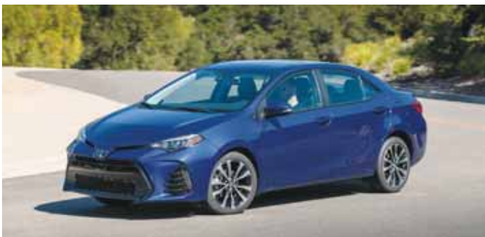
Campeón de ventas. El Corolla estrena armamento para validar su éxito en los mercados en los que compete. / TOYOTA