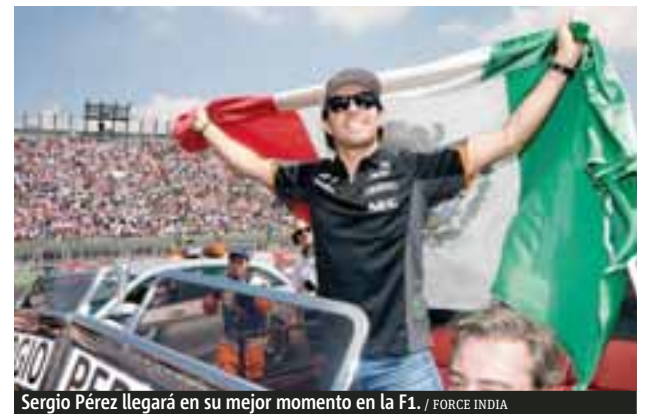
Sergio Pérez llegará en su mejor momento en la F1.

La misión que tienen los encargados de llevar a buen puerto esta carrera no es nada sencilla, toda vez que el regreso de la máxima categoría a nuestro país fue reconocido por la FIA (Federación Internacional de Automovilismo) como el mejor evento de 2015. El campeonato podría definirse aquí.