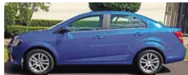
El perfil nos da la imagen de un auto sólido y bien ensamblado con formas emocionales.