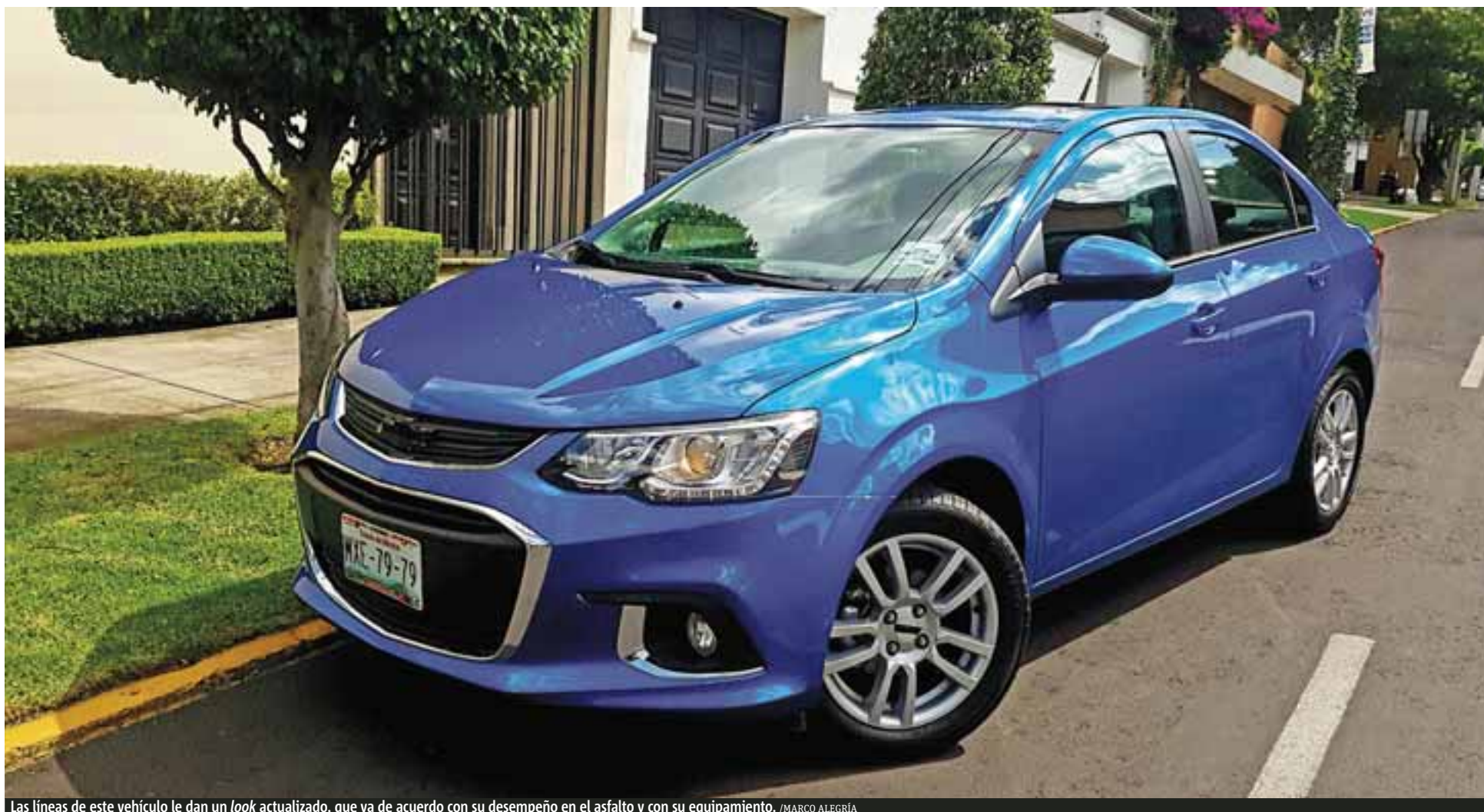
Las líneas de este vehículo le dan un look actualizado, que va de acuerdo con su desempeño en el asfalto y con su equipamiento.

Se pone guapo. Un verdadero consentido en nuestro país se renueva de pies a cabeza. Si bien el cambio es de media vida, Sonic 2017 es más que una cara bonita