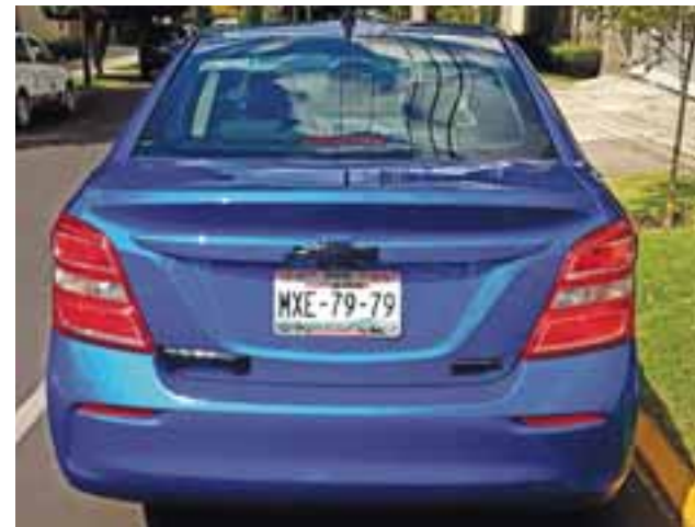
La parte trasera le pone la cereza al pastel en cuestión de diseño. / MARCO ALEGRÍA