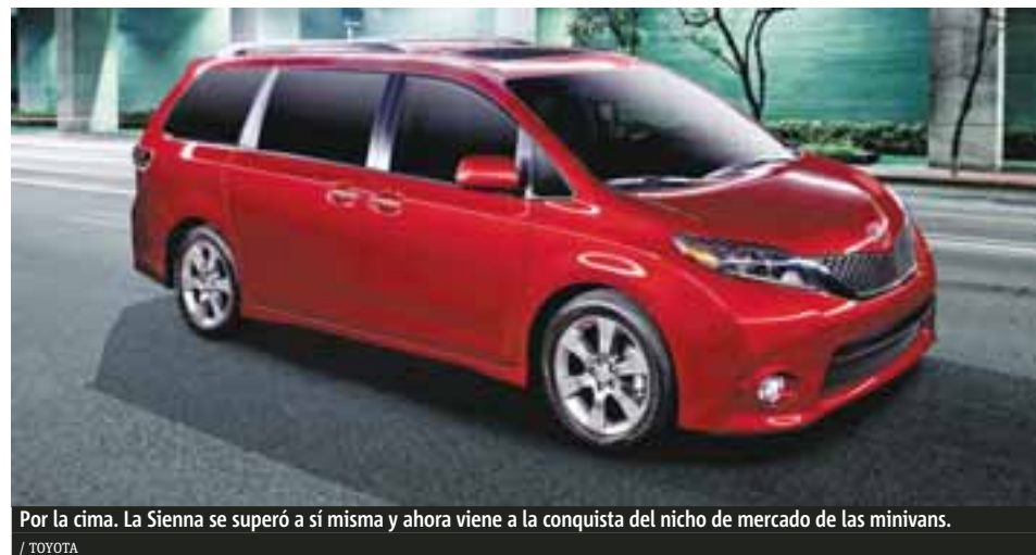
Por la cima. La Sienna se superó a sí misma y ahora viene a la conquista del nicho de mercado de las minivans.

Con rutas específicas, manejamos el Toyota Corolla que cumple sus primeros 50 años y que en México llegará a mediados de octubre. Este auto cambia en el exterior con nuevas fascias, grupos ópticos, así como rines de nuevo diseño. La parte trasera lleva ahora nuevas calaveras y además se oferta una versión más deportiva que presume faldones en la parte baja. El tren motor se mantiene vigente con el 1.8L de cuatro cilindros y 132 hp con transmisión manual de seis velocidades, es una muy mejorada CVT.