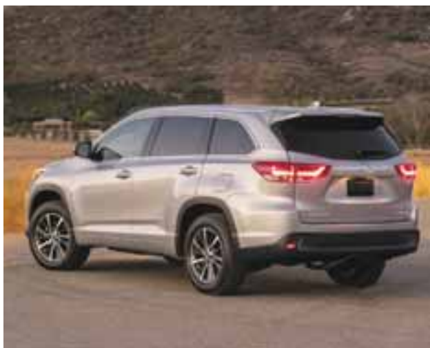
Contra viento y marea. El modelo Highlander supera cualquier terreno. / TOYOTA

Toyota Prius Prime, sin duda la cereza del pastel es este nuevo híbrido enchufable, ya que la propia firma promete hasta 980 kilómetros de autonomía y un manejo en modo completamente eléctrico de hasta 135 km/h. Además, el cargarlo en tomas con corriente de 127 V tardará no más de 3 horas, algo que hoy en día se agradece. Para nuestro mercado aún no está confirmada su llegada, pero creemos que sería una excelente opción y propuesta de auto comprometido con el medio ambiente.