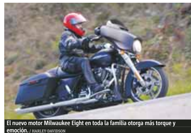
El nuevo motor Milwaukee Eight en toda la familia otorga más torque y emoción. / HARLEY-DAVIDSON