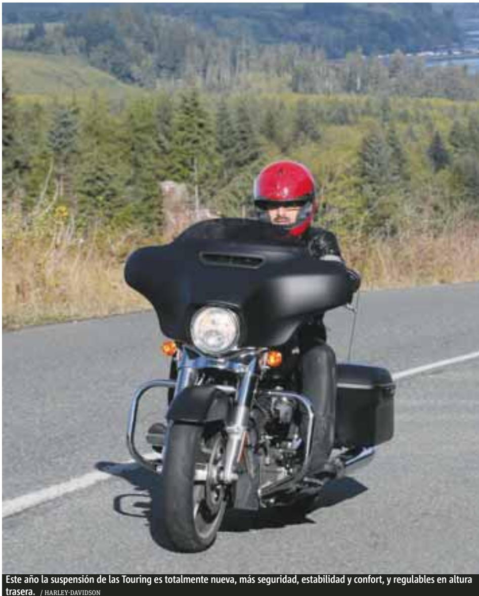
Este año la suspensión de las Touring es totalmente nueva, más seguridad, estabilidad y confort, y regulables en altura trasera.