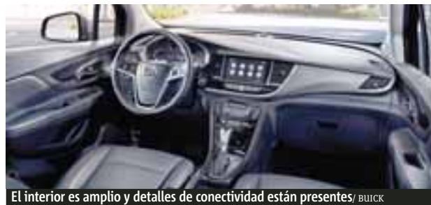
El interior es amplio y detalles de conectividad están presentes