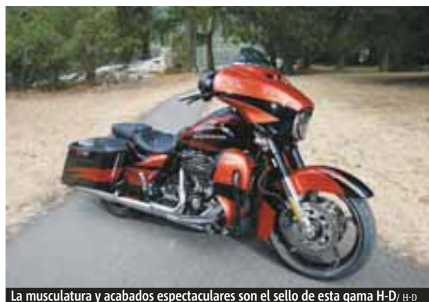
La musculatura y acabados espectaculares son el sello de esta gama H-D / H-D

su ya casi 115 años de existencia: el nuevo Milwaukee Eight. Sin duda, una máquina llena de tecnología que ha impresionado a los fanáticos y a los no seguidores de la marca: más eficiente, más poderoso, con un ruido mucho más afinado, con un trabajo más frío y mejor acomodo en la moto. Viene a renovar el corazón de la marca con ese elemento que emite el sonido registrado de cada Harley en las calles y carreteras. Está desarrollado con el cliente en mente pues cada mejora resulta de un proyecto de ingeniería que a su vez viene de escuchar a los riders. Le