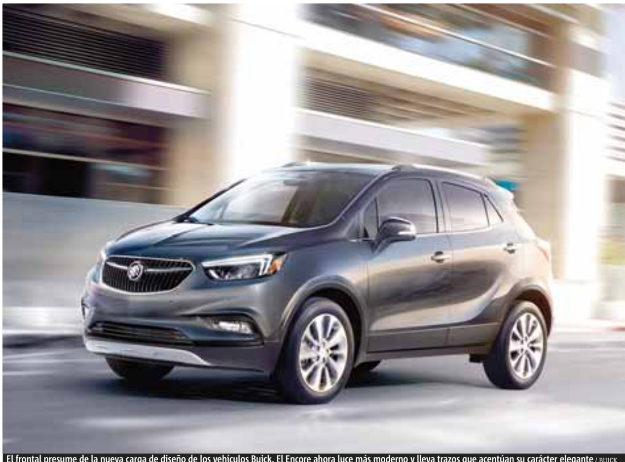
El frontal presume de la nueva carga de diseño de los vehículos Buick. El Encore ahora luce más moderno y lleva trazos que acentúan su carácter elegante

En cuanto al motor, monta un 1.4 turbo de 4 cilindros que libera 138 hp y 148 libras pie de torque a una caja automática de 6 relaciones con