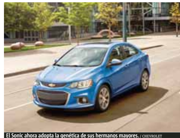
El Sonic ahora adopta la genética de sus hermanos mayores. / CHEVROLET

para el paquete Premier, ah, tiene dos puertos USB. Está equipado con la última versión de Chevrolet MyLink y smartphone integration con Apple CarPlay y Android Auto en el paquete más equipado, y 6 bocinas le permitirán "rockear" al interior. Serán 9 los colores exteriores para llegar al piso de venta a partir del último trimestre del año, tanto en carrocería hatchback como en sedán, y sus versiones son: LS, LT y Premier.