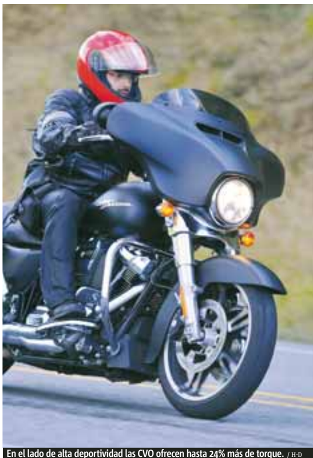
En el lado de alta deportividad las CVO ofrecen hasta 24% más de torque.

Previamente este 2016 conocimos la nueva Roadster una