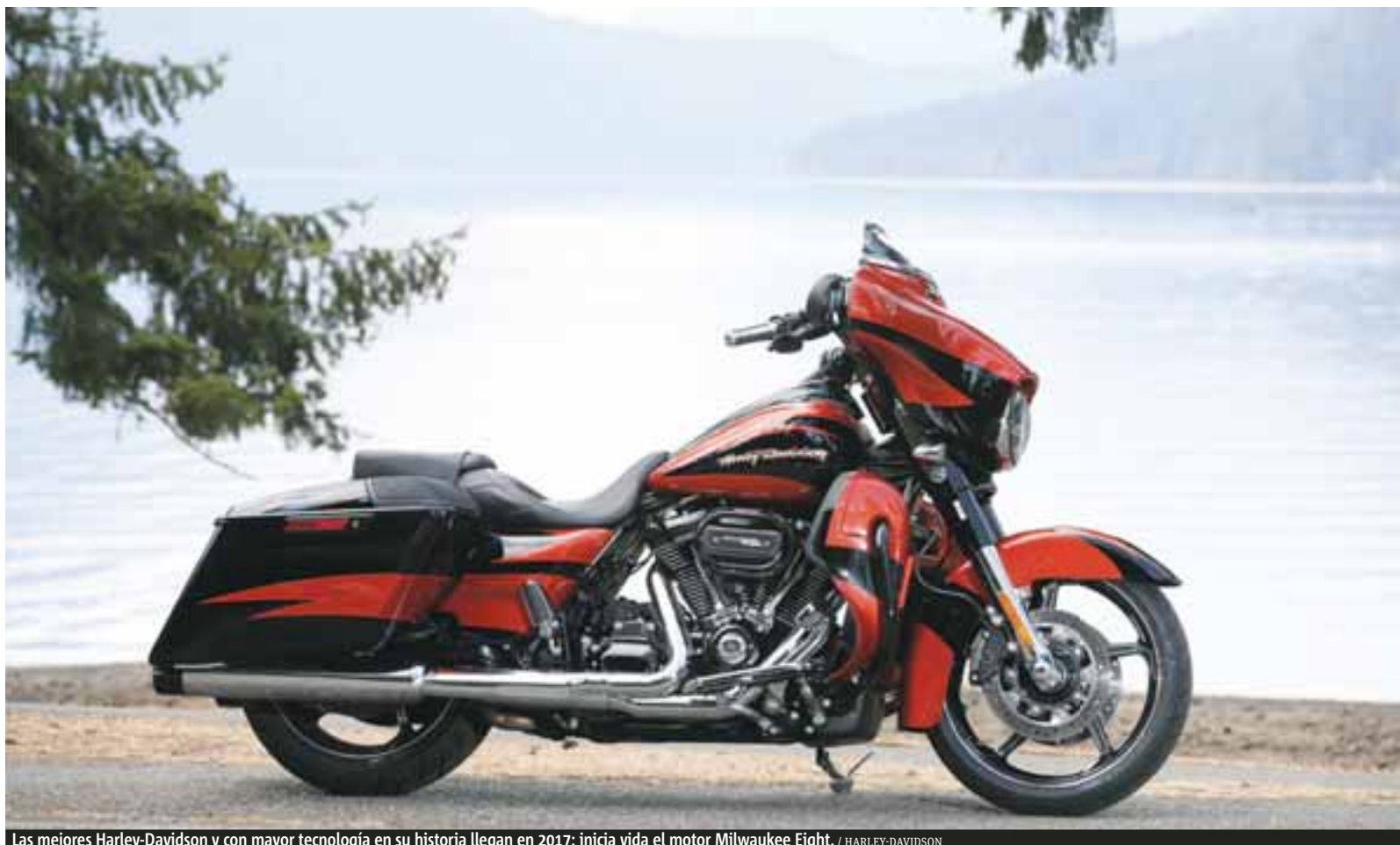
Las mejores Harley-Davidson y con mayor tecnología en su historia llegan en 2017: inicia vida el motor Milwaukee Eight.

presentamos su manejo la semana pasada, pero si lo pudiéramos resumir en una frase: la leyenda Harley-Davidson se ha vuelto a imprimir en el componente clave que da mayor seguridad, confort y emoción a quien se sube.