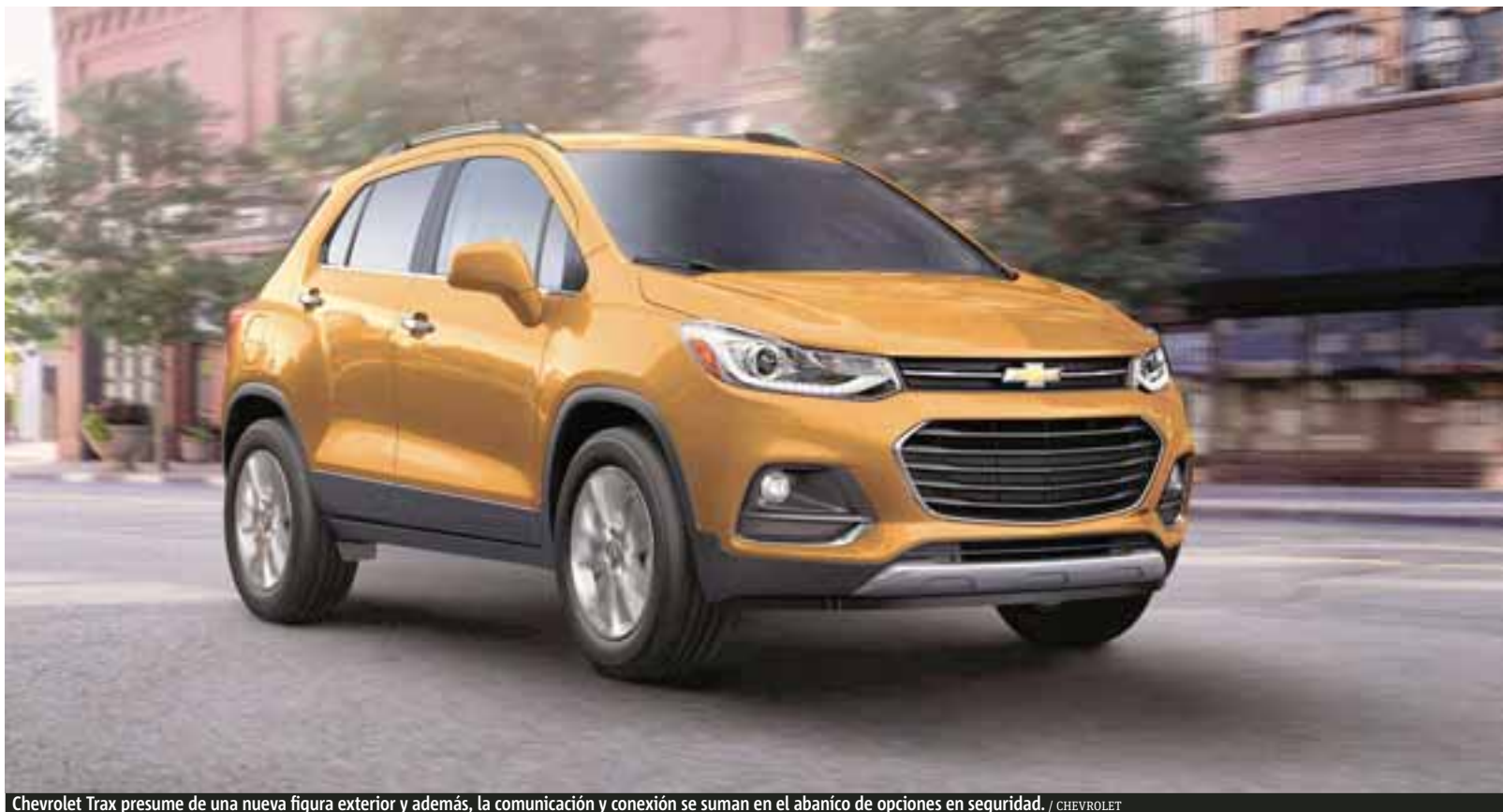
Chevrolet Trax presume de una nueva figura exterior y además, la comunicación y conexión se suman en el abanico de opciones en seguridad.

Por dentro: un nuevo cluster de instrumentos, volante de tres brazos, insertos cromados y manijas exteriores hacen la magia para lucir un aspecto fundamentalmente ejecutivo, al tiempo que una nueva pantalla táctil de 7 pulgadas está disponible