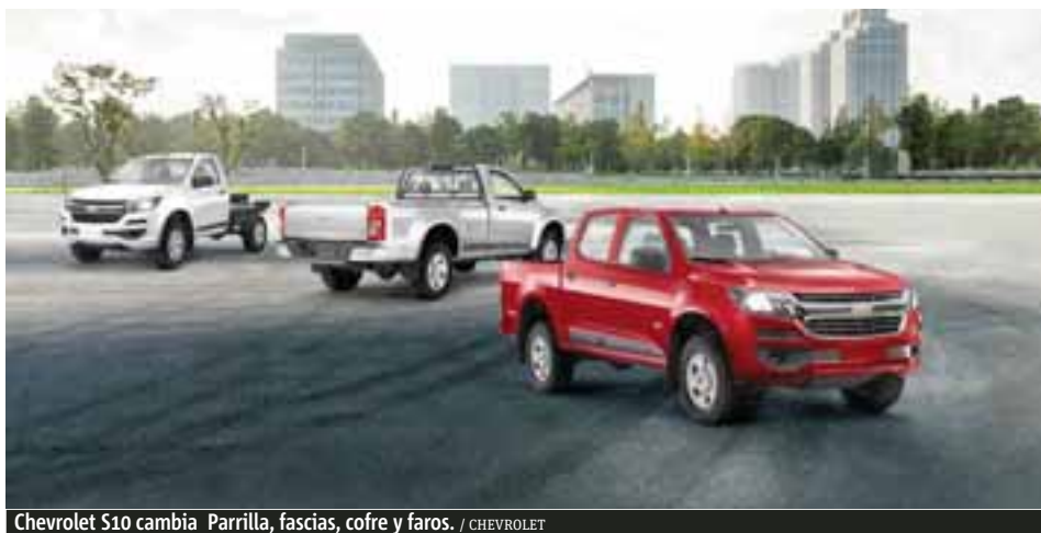
Chevrolet S10 cambia Parrilla, fascias, cofre y faros. / CHEVROLET