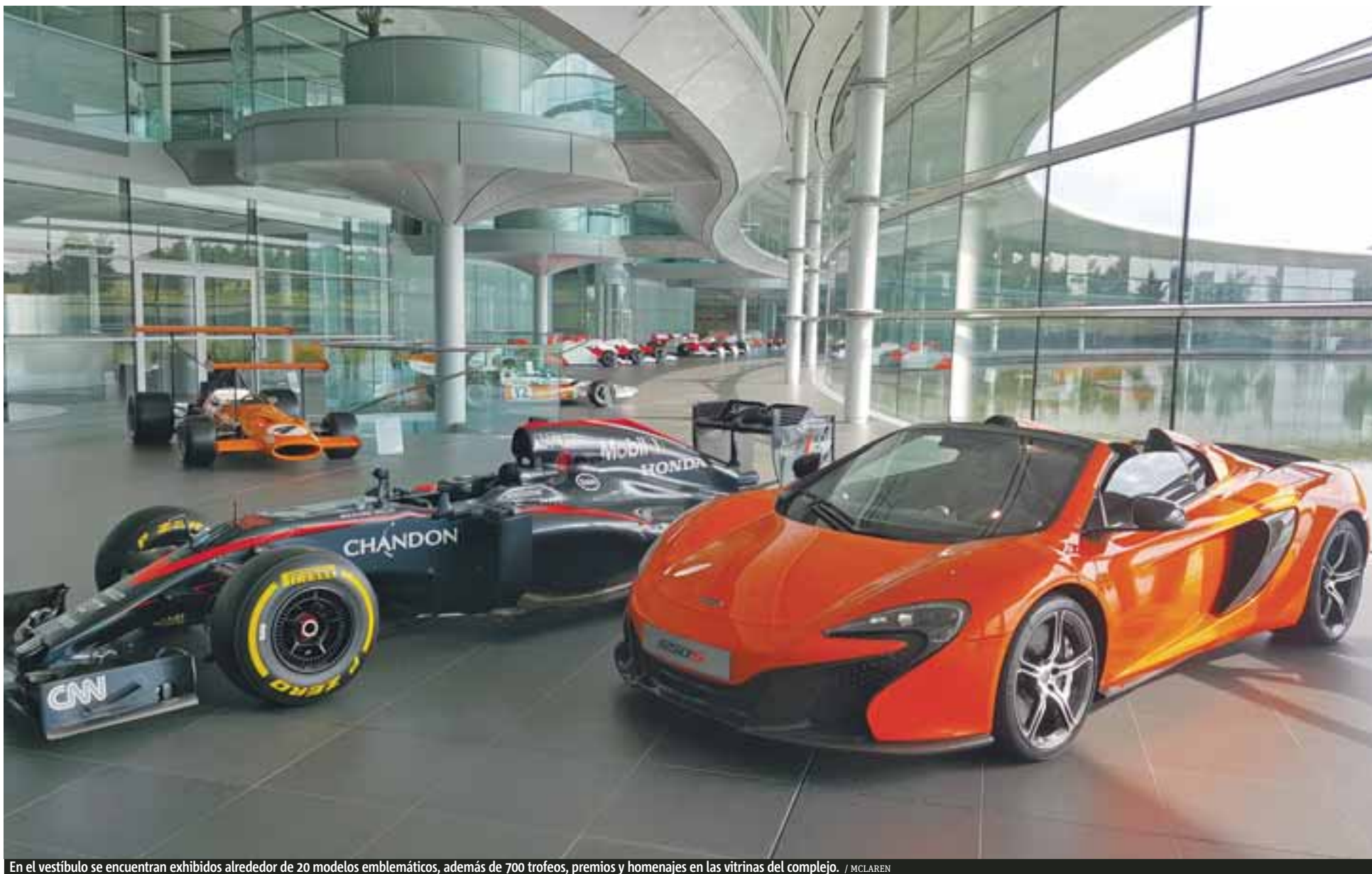
En el vestíbulo se encuentran exhibidos alrededor de 20 modelos emblemáticos, además de 700 trofeos, premios y homenajes en las vitrinas del complejo.

De vanguardia. McLaren Technology Centre está situado apenas unos 30 kilómetros afuera del centro de Londres y, sin lugar a dudas es uno de los complejos tecnológicos, de investigación y desarrollo, más importantes del mundo