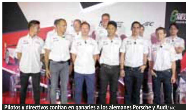
Pilotos y directivos confían en ganarles a los alemanes Porsche y Audi / MC

La acción en el Hermanos Rodríguez arranca hoy (1° de septiembre) a las 09:00 horas con las prácticas 1 y 2, la tercera