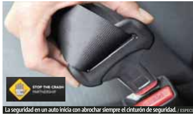
La seguridad en un auto inicia con abrochar siempre el cinturón de seguridad.