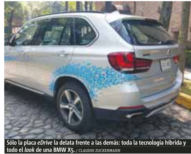
Sólo la placa eDrive la delata frente a las demás: toda la tecnología híbrida y todo el look de una BMW X5.