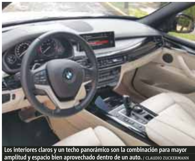
Los interiores claros y un techo panorámico son la combinación para mayor amplitud y espacio bien aprovechado dentro de un auto. / CLAUDIO ZUCKERMANN