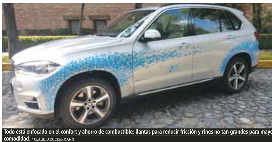
Todo está enfocado en el confort y ahorro de combustible: llantas para reducir fricción y rines no tan grandes para mayor comodidad. / CLAUDIO ZUCKERMANN