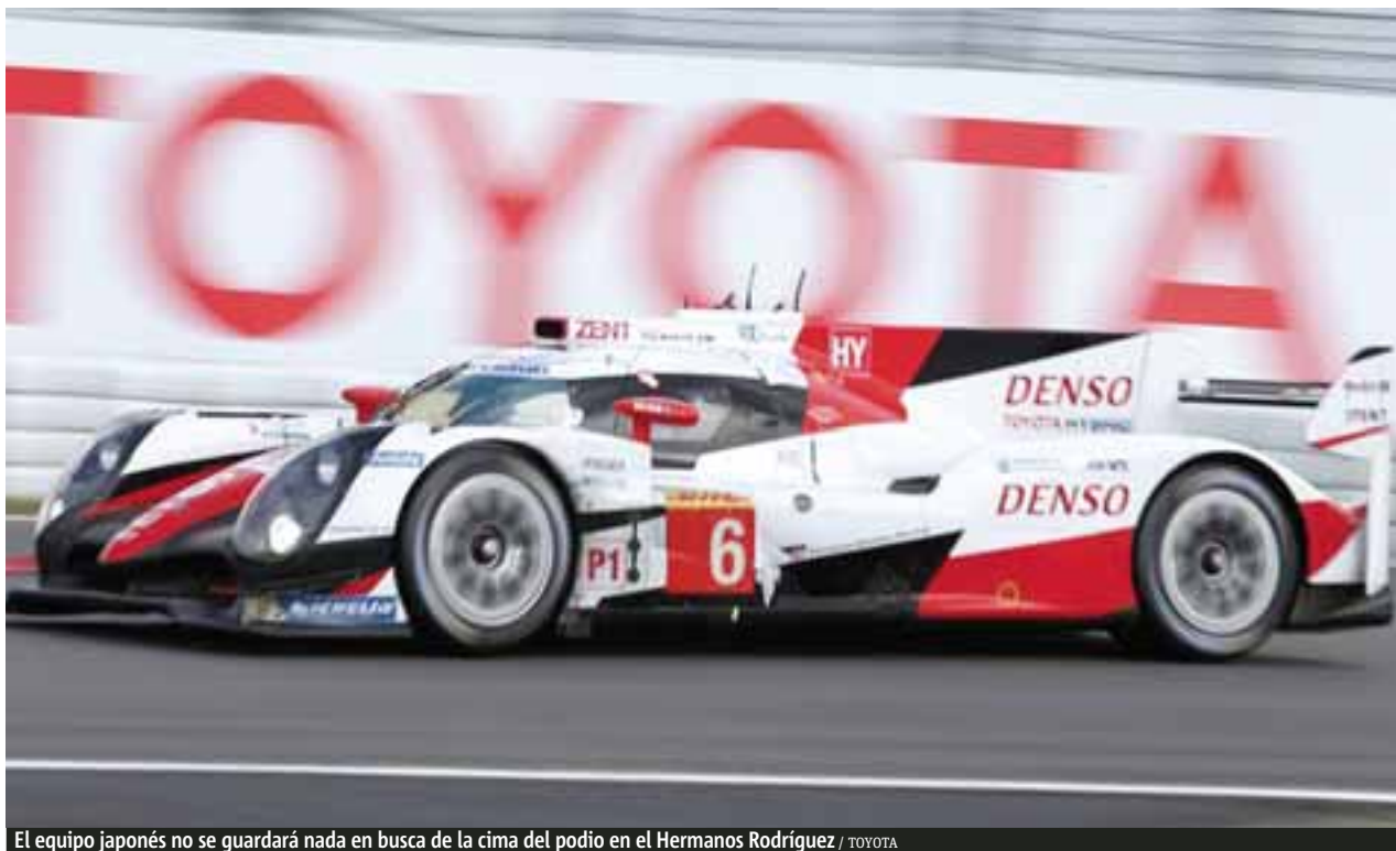
El equipo japonés no se guardará nada en busca de la cima del podio en el Hermanos Rodríguez / TOYOTA

“Demostramos que podíamos ganar en Le Mans, fue duro asimilarlo, no obtuvimos el