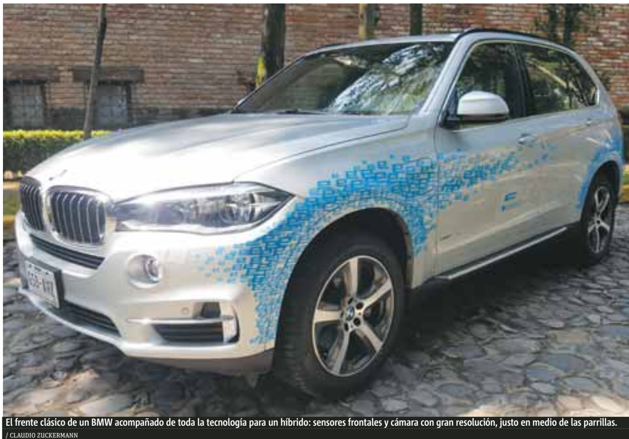
El frente clásico de un BMW acompañado de toda la tecnología para un híbrido: sensores frontales y cámara con gran resolución, justo en medio de las parrillas. / CLAUDIO ZUCKERMANN