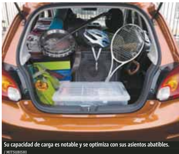
Su capacidad de carga es notable y se optimiza con sus asientos abatibles.