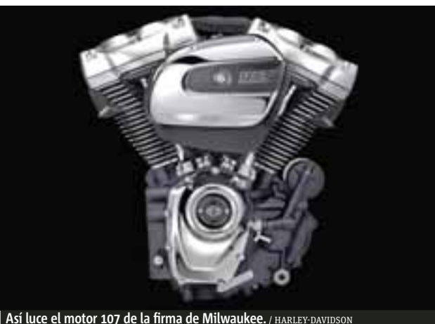
Así luce el motor 107 de la firma de Milwaukee.