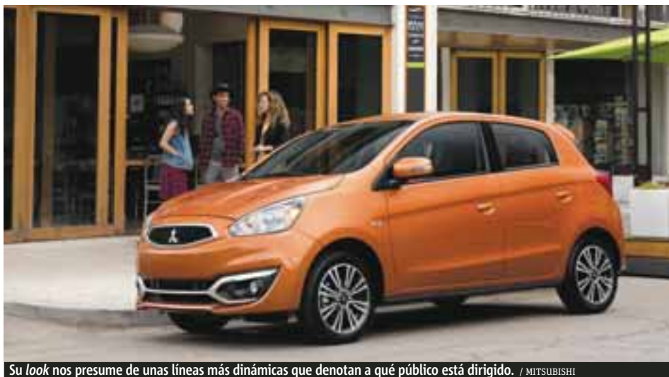
Su look nos presume de unas líneas más dinámicas que denotan a qué público está dirigido. / MITSUBISHI