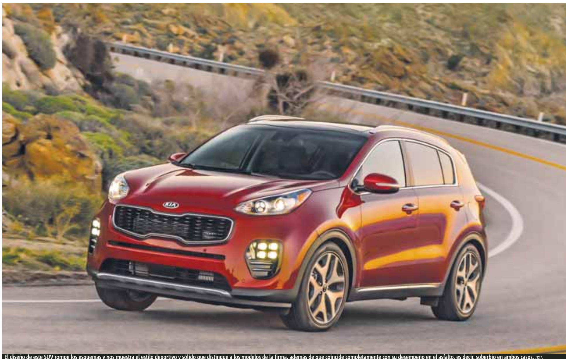
El diseño de este SUV rompe los esquemas y nos muestra el estilo deportivo y sólido que distingue a los modelos de la firma, además de que coincide completamente con su desempeño en el asfalto, es decir, soberbio en ambos casos.