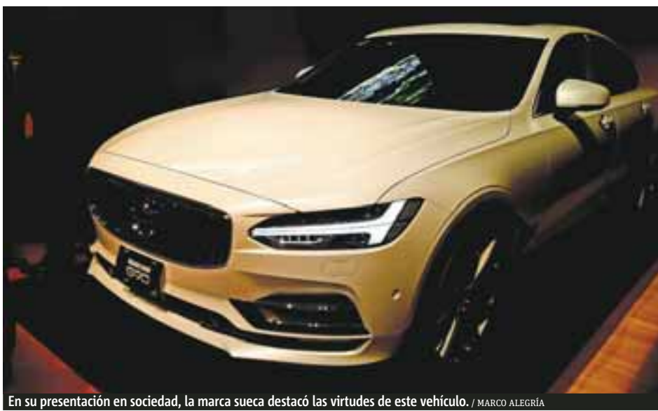
En su presentación en sociedad, la marca sueca destacó las virtudes de este vehículo.