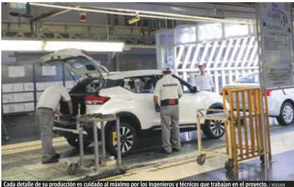
Cada detalle de su producción es cuidado al máximo por los ingenieros y técnicos que trabajan en el proyecto. / NISSAN