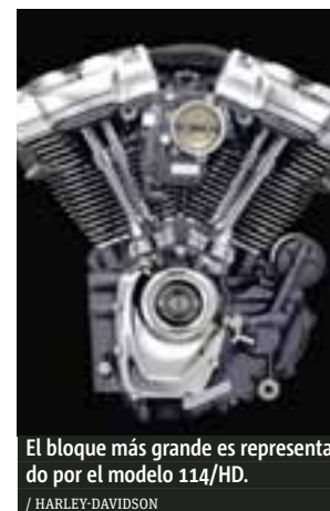
El bloque más grande es representado por el modelo 114/HD. / HARLEY-DAVIDSON