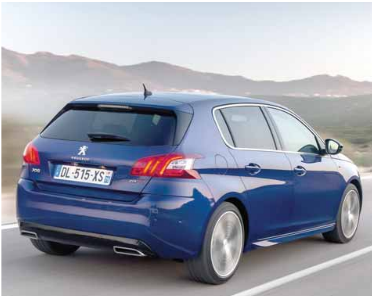
Trasera: la más bella y elegante es sin duda la parte trasera en cuanto a diseño y personalidad. El Peugeot 308 GT presume un portón, fascia y escapes de todo un deportivo europeo.