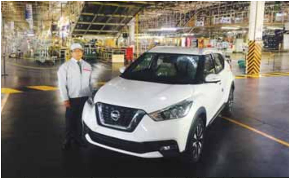
Este modelo viene a romper los paradigmas del segmento y a demostrar la calidad de mano de obra mexicana.

Con un viaje relámpago a la ciudad de Aguascalientes, Nissan mexicana invitó a los medios especializados para conocer de primera mano el nuevo crossover denominado Nissan Kicks y que está fabricado en una de las plantas automotrices más grandes