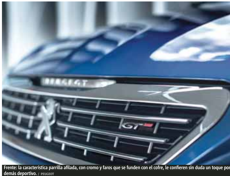
Frente: la característica parrilla afilada, con cromo y faros que se funden con el cofre, le confieren sin duda un toque por demás deportivo. / PEUGEOT

308 GT tiene una altura de la plataforma rebajada: (-7 mm adelante, -10 mm en la parte