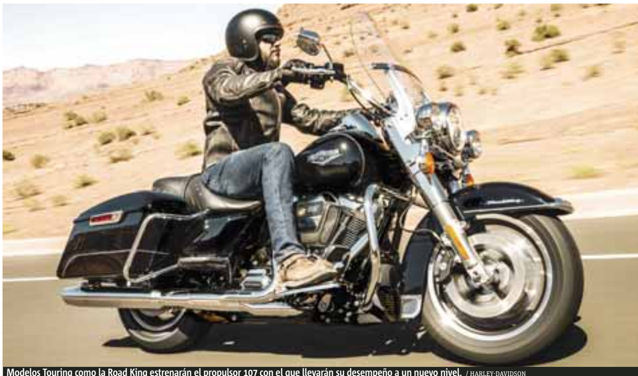
Modelos Touring como la Road King estrenarán el propulsor 107 con el que llevarán su desempeño a un nuevo nivel. / HARLEY-DAVIDSON

Vendrá en dos tamaños y tres diferentes variantes: 107 (1,750 cc), enfocado a los productos: Street Glide, Road Glide, Electra Glide, Road King y Freewheeler, mientras que el más grande 114 (1,870 cc), será empleado en los modelos Ultra Limited, Road Glide Ultra y Tri Glide Ultra.