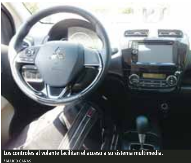
Los controles al volante facilitan el acceso a su sistema multimedia.