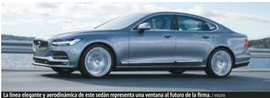
La línea elegante y aerodinámica de este sedán representa una ventana al futuro de la firma.