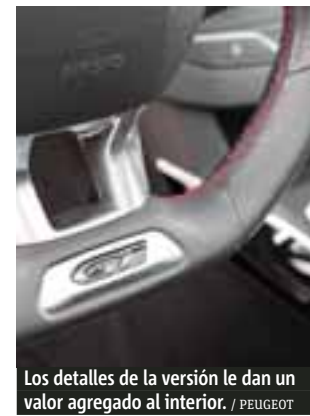
Los detalles de la versión le dan un valor agregado al interior.