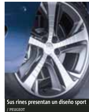
Sus rines presentan un diseño sport / PEUGEOT