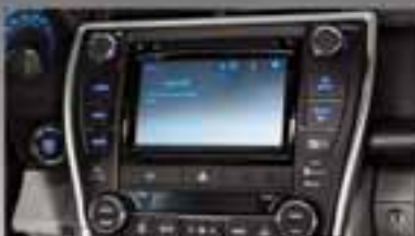
Pantalla multifuncional touchscreen de 7" con sistema de navegación