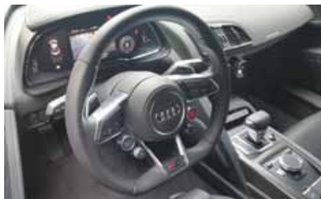
Audi Virtual Cockpit detrás de un volante recortado y varios insertos de fibra de carbono en la consola. Así se hace un superdeportivo. / CLAUDIO ZUCKERMANN