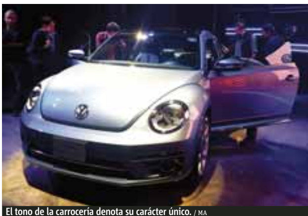
El tono de la carrocería denota su carácter único. / MA