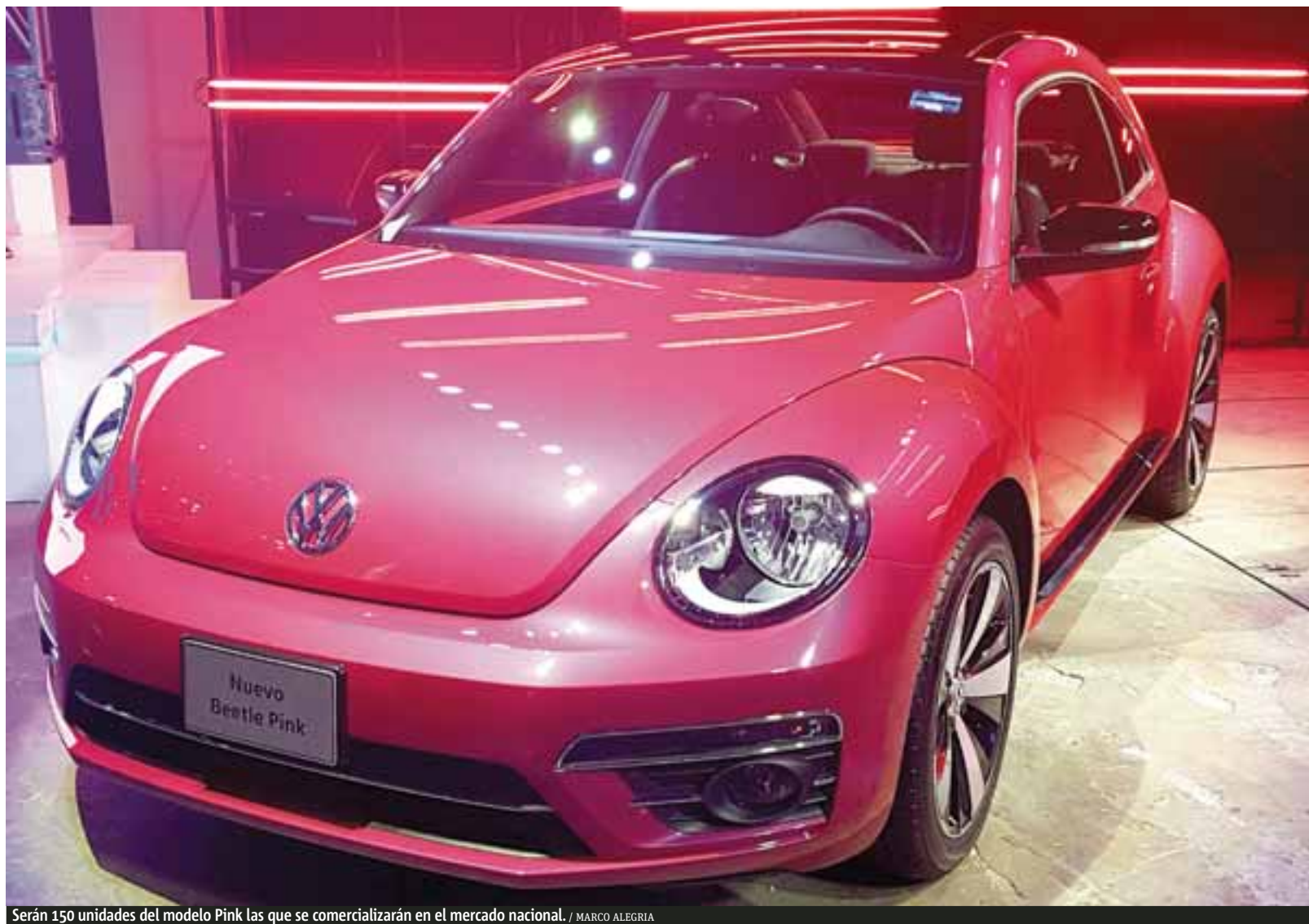
Serán 150 unidades del modelo Pink las que se comercializarán en el mercado nacional.

Previo a la finalización de la historia del vochito , Volkswagen Beetle abrió los ojos en 1998 de cara al cambio de siglo, impactando por su diseño y logrando continuar de