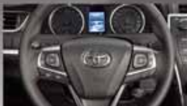
Sistema de conectividad Bluetooth® con reconocimiento de voz y controles al volante

Este anuncio es una referencia publicitaria. Las especificaciones de los vehículos pueden variar de acuerdo a las versiones disponibles. Las fotos de los autos son sólo referencia.