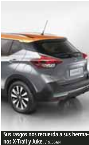
Sus rasgos nos recuerda a sus hermanos X-Trail y Juke.