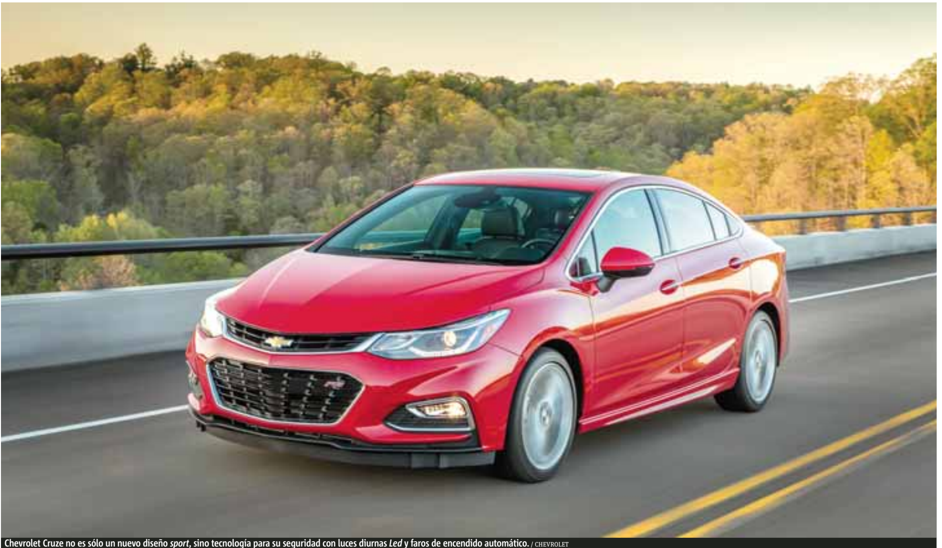
Chevrolet Cruze no es sólo un nuevo diseño sport , sino tecnología para su seguridad con luces diurnas Led y faros de encendido automático.