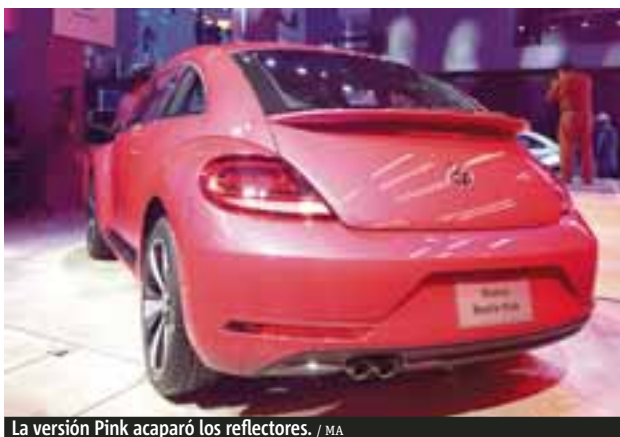
La versión Pink acaparó los reflectores. / MA