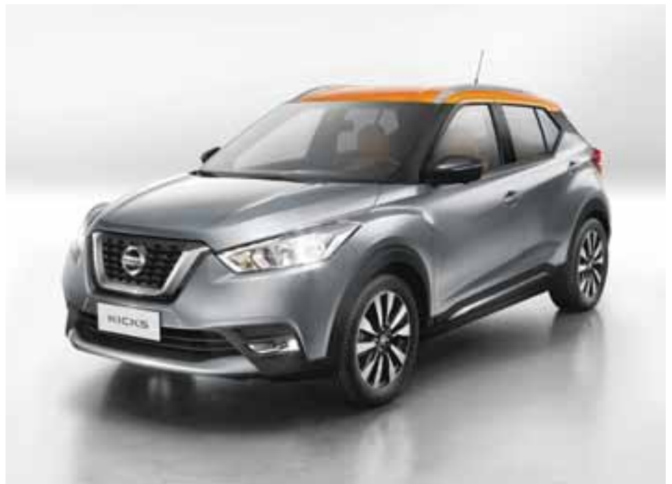
La nueva carga genética que ya vemos en el Maxima ahora se ve reflejada en el Kicks, con una parrilla prominente en forma de V que le confiere un aire deportivo.

Nissan Mexicana confirmó la producción y comercialización en el país de Kicks, un nuevo crossover que ya se comercializa en Brasil, próximamente llegará al resto de América Latina, y posteriormente a más de 80 países alrededor del mundo.