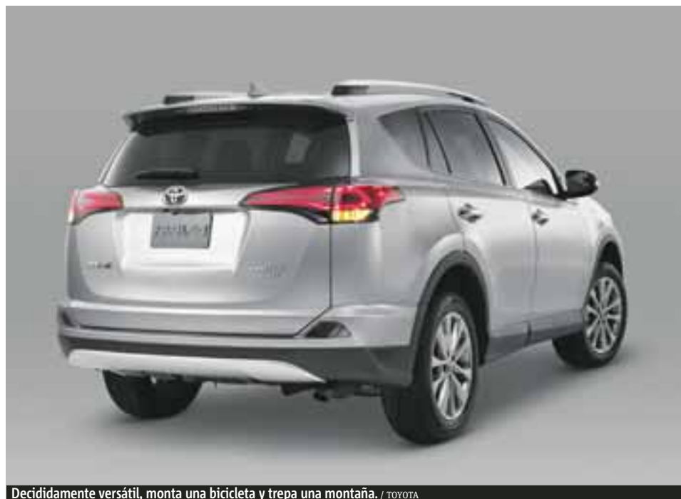
Decididamente versátil, monta una bicicleta y trepa una montaña. / TOYOTA