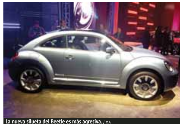
La nueva silueta del Beetle es más agresiva. / MA