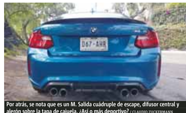
Por atrás, se nota que es un M. Salida cuádruple de escape, difusor central y alerón sobre la tapa de cajuela. ¿Así o más deportivo?

Prueba. BMW ha regresado a las emociones al límite con este potente, ágil, pequeño cohete germano M2 que se perfila a ser uno de los mejores M de todos los tiempos