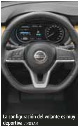
La configuración del volante es muy deportiva.

La producción del nuevo modelo Nissan Kicks se llevará a cabo en Aguascalientes, México y contará con una inversión de casi 150 millones