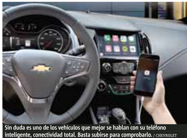
Sin duda es uno de los vehículos que mejor se hablan con su teléfono inteligente, conectividad total. Basta subirse para comprobarlo.

Pero ahí no acaba la nueva era de Chevrolet Cruze, subiéndose al vehículo sobresale el buen habitáculo y lo que hoy todos necesitamos: la conectividad total. Aquí por medio de las dos plataformas más amplias, tanto Android Auto como Apple Car Play, sus aplicaciones estarán dispuestas en