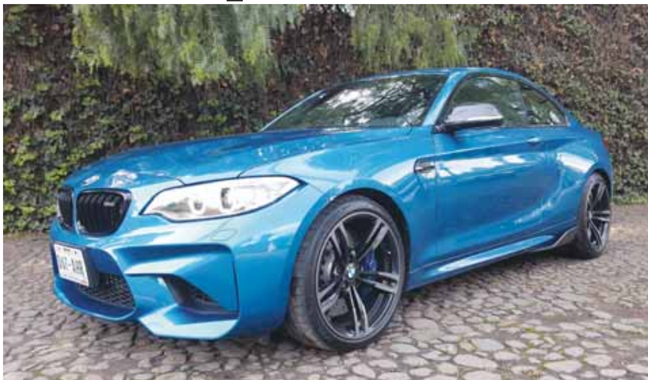
De frente, aspecto ágil y musculoso. Grandes tomas de aire y líneas completamente deportivas para este bólido M2.