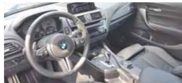
Por dentro, detalles en fibra de carbono, remates de costuras en colores blanco, azul y rojo y la clásica "palanquita" selectora de velocidades, única de los M de BMW. / CLAUDIO ZUCKERMANN