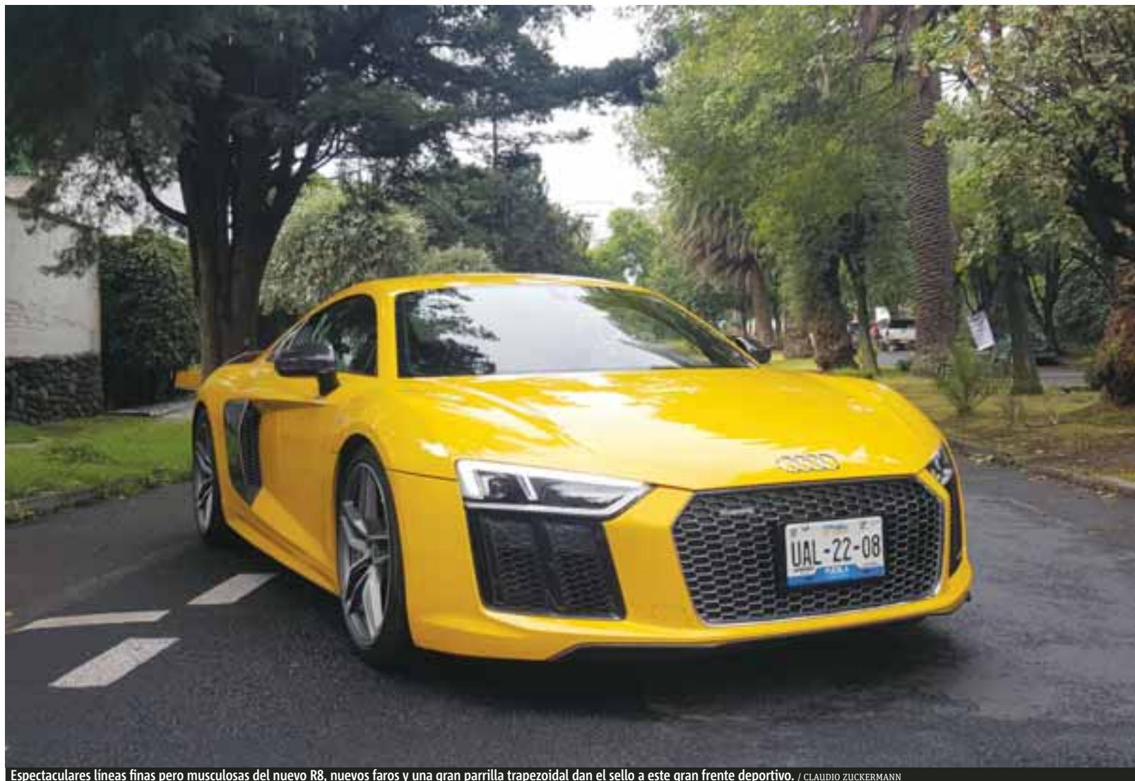
Espectaculares líneas finas pero musculosas del nuevo R8, nuevos faros y una gran parrilla trapezoidal dan el sello a este gran frente deportivo. / CLAUDIO ZUCKERMANN