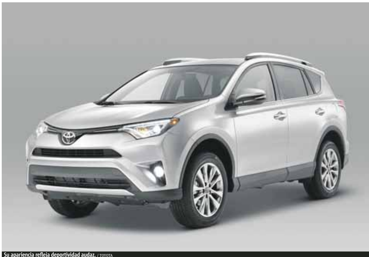
Su apariencia refleja deportividad audaz.

La pantalla central de la consola se incrementa, logrando visualizar de mejor manera el sistema de posicionamiento satelital, y dando pie a una excelente visión de cámara de reversa. El sistema de infoentretenimiento tiene todo lo necesario, y si bien no destacan grandes firmas en el sistema de sonido, es un