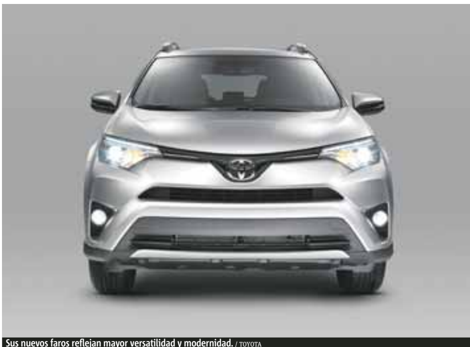
Sus nuevos faros reflejan mayor versatilidad y modernidad.