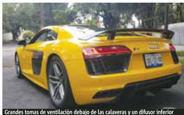
Grandes tomas de ventilación debajo de las calaveras y un difusor inferior dan todo el carácter por la parte de atrás. Si hay dudas, el alerón en fibra de carbono es el toque final.