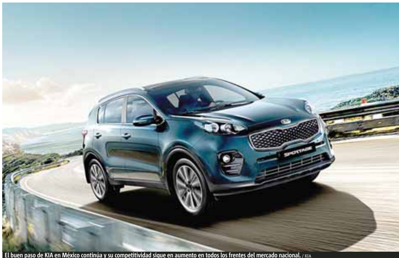
El buen paso de KIA en México continúa y su competitividad sigue en aumento en todos los frentes del mercado nacional.

Para demostrar su eficiencia descargamos la aplicación, llenamos los datos que se nos solicitaron, para después simular la necesidad de