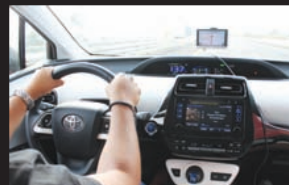
Fácil de entender, mejor para manejar, así es la cabina del Toyota Prius.

Desde su llegada a nuestro país, en 2010, Toyota ha logrado colocar tres mil 730 unidades y en lo que va de 2016 ha hecho lo propio con 422.