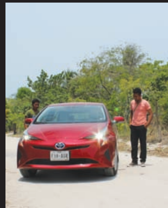
Muchos curiosos nos preguntaron por el auto en todo el trayecto. Llama la atención. / MC