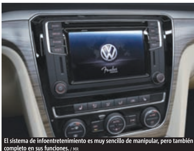
El sistema de infoentretenimiento es muy sencillo de manipular, pero también completo en sus funciones. / MR