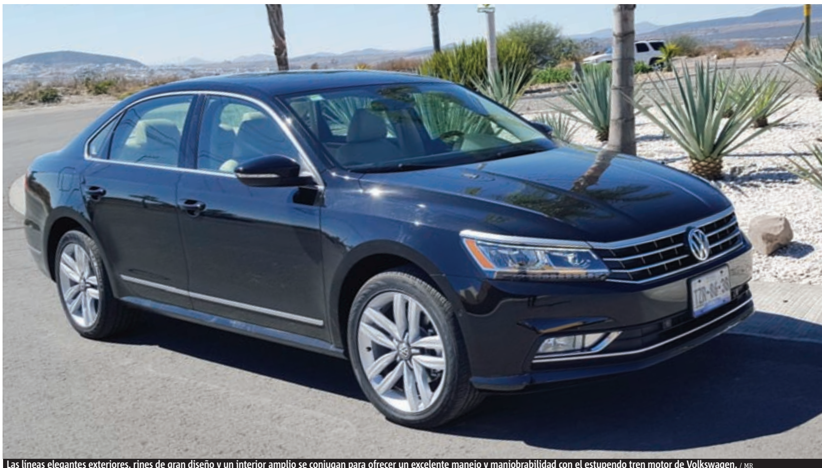
Las líneas elegantes exteriores, rines de gran diseño y un interior amplio se conjugan para ofrecer un excelente manejo y maniobrabilidad con el estupendo tren motor de Volkswagen. / MR