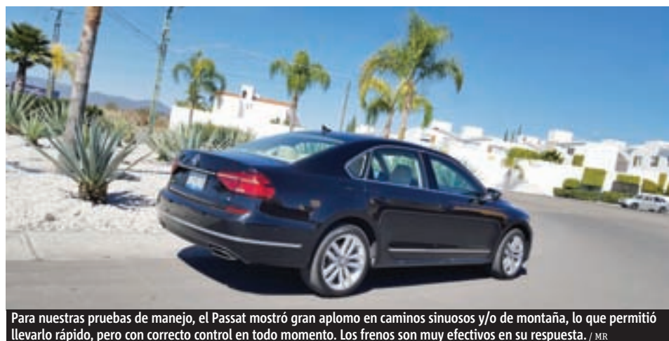
Para nuestras pruebas de manejo, el Passat mostró gran aplomo en caminos sinuosos y/o de montaña, lo que permitió llevarlo rápido, pero con correcto control en todo momento. Los frenos son muy efectivos en su respuesta. / MR