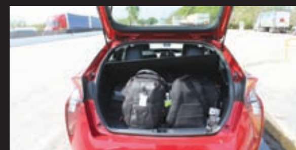
Dos maletas de tamaño grande entran sin comprometer el espacio de la cajuela. Buen detalle.