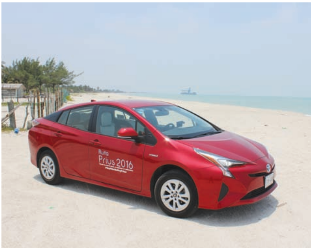
Iniciamos en Playa del Carmen, Quintana Roo y terminamos en Puebla, con una grata experiencia de manejo a bordo del Toyota Prius. / MC

Mientras que su equipo multimedia brinda la posibilidad de estar en contacto con el mundo, sin cables, vía Bluetooth así como cargar la pila de tu móvil con su vanguardista plataforma de recarga.