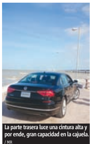
La parte trasera luce una cintura alta y por ende, gran capacidad en la cajuela. / MR