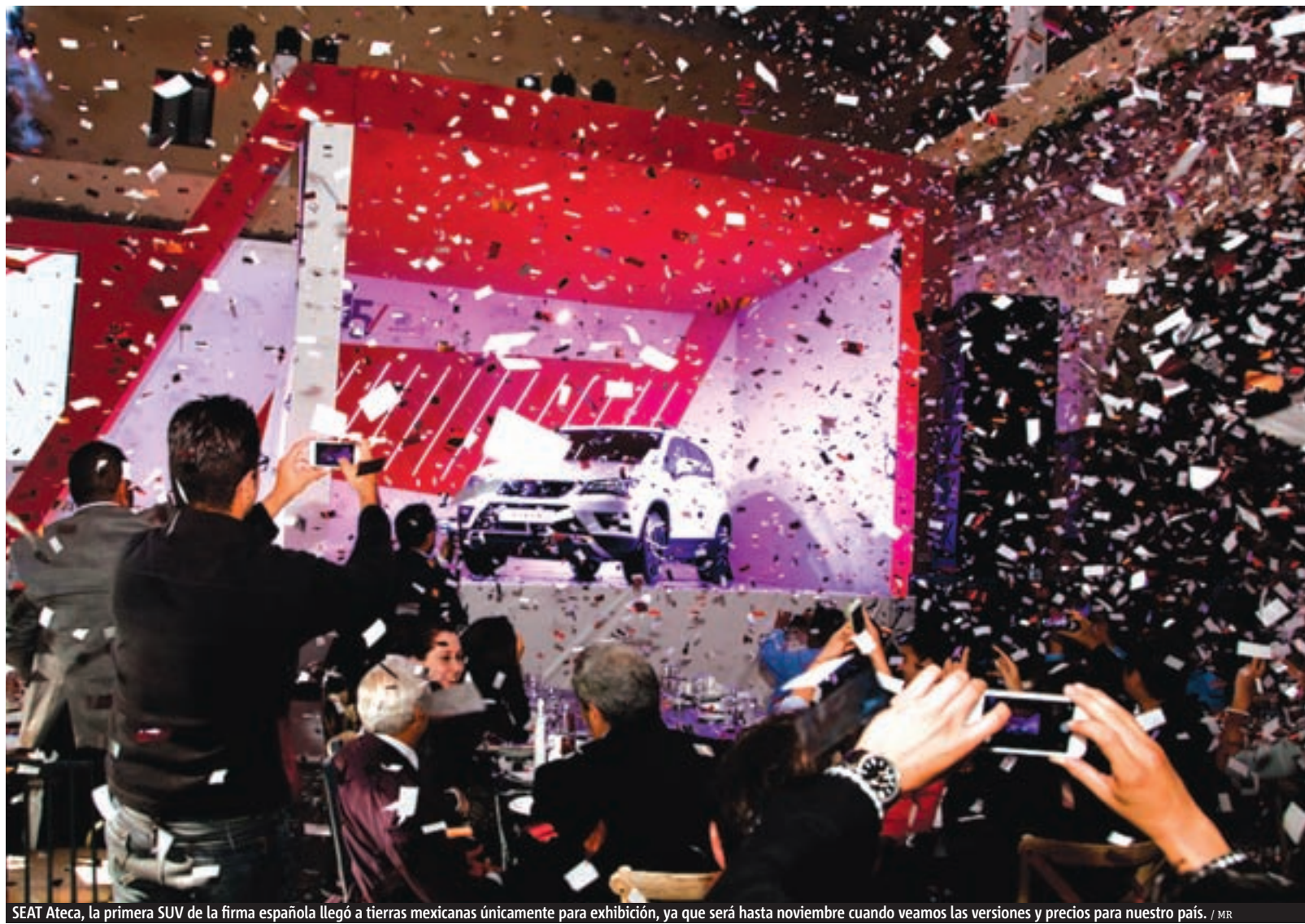
SEAT Ateca, la primera SUV de la firma española llegó a tierras mexicanas únicamente para exhibición, ya que será hasta noviembre cuando veamos las versiones y precios para nuestro país. / MR

Ibiza. 150 unidades de edición especial basado en versión FR. En carrocería SC, combinación de colores Negro, blanco y gris tecnológico con rines de