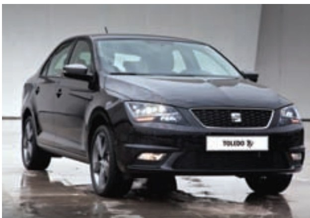
SEAT Toledo, gran auto familiar con motor turbocargado y 110 hp. / SEAT