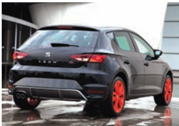
SEAT Leon, de las mejores puestas a punto en equipamiento exclusivo.