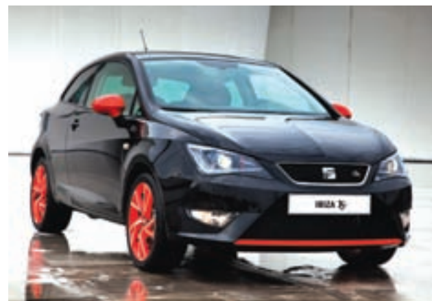
SEAT Ibiza, el consentido de México ahora con detalles exclusivos.