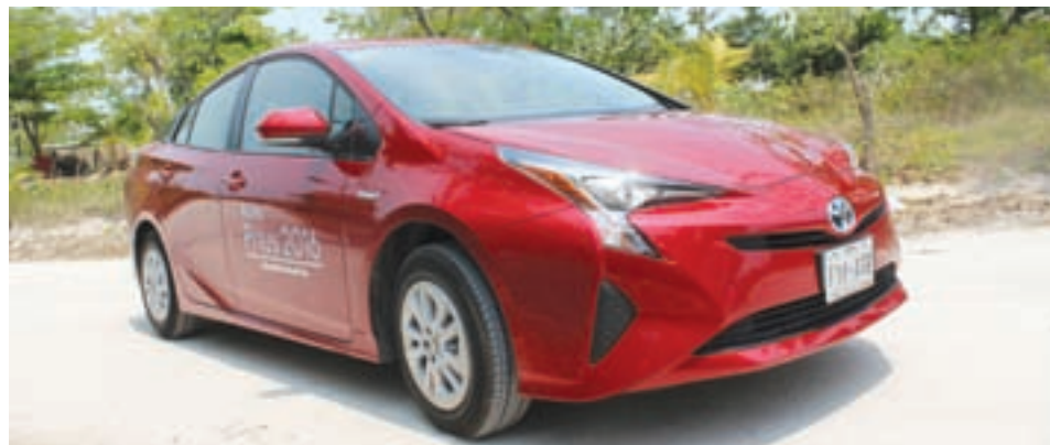
Tanto el exterior como el interior son completamente nuevos: Llama la atención lo bien pensado que está para disfrutar la conducción. /MC

En los tramos de ciudad lo llevamos en modo eléctrico y su propulsor dejó en claro que no es necesario usar una gota de combustible para ir y venir en medio del caos urbano, así como el modo ECO que nos ofrece un