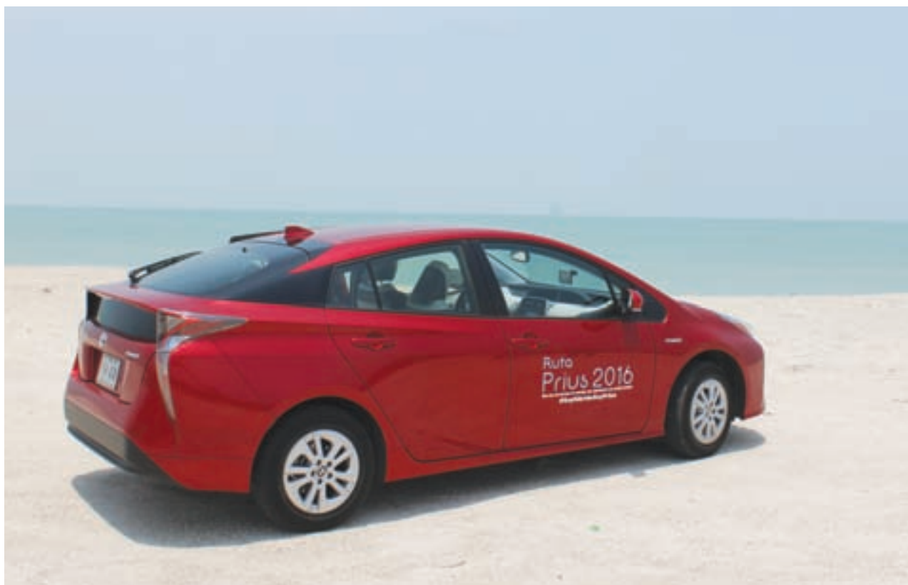
Polémica, así es la parte trasera del auto. Quizá muy adelantada a nuestra época. Gusta o disgusta, pero lo que es un hecho, es que es diferente al resto. / MC