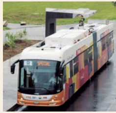
ABB PONE "PILAS" A AUTOBUSES EN 15 SEGUNDOS

La nueva tecnología de recarga fue presentada por primera vez en un autobús eléctrico de alta capacidad que transporta hasta 135 pasajeros. Las unidades serán recargadas en paradas previamente seleccionadas, en un lapso de quince