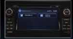
**NissanConnect® con Facebook y Google™ Places