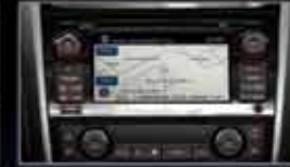
Sistema de Navegación y audio Bose®