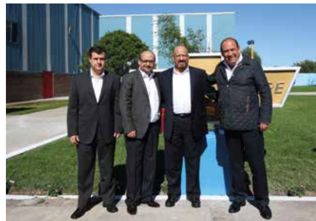
Ernesto Hernández, presidente y director general de GMM, junto con Rubén Moreira, gobernador del estado de Coahuila.

Esta inversión forma parte de los 5 mil millones de dólares anunciada por GM a principio de año para fortalecer sus operaciones en territorio nacional. Cabe destacar que el Chevrolet Cruze es uno de los vehículos con mayor penetración del portafolio Chevrolet a nivel mundial, con más de 3.4 millones de vehículos comercializados des-