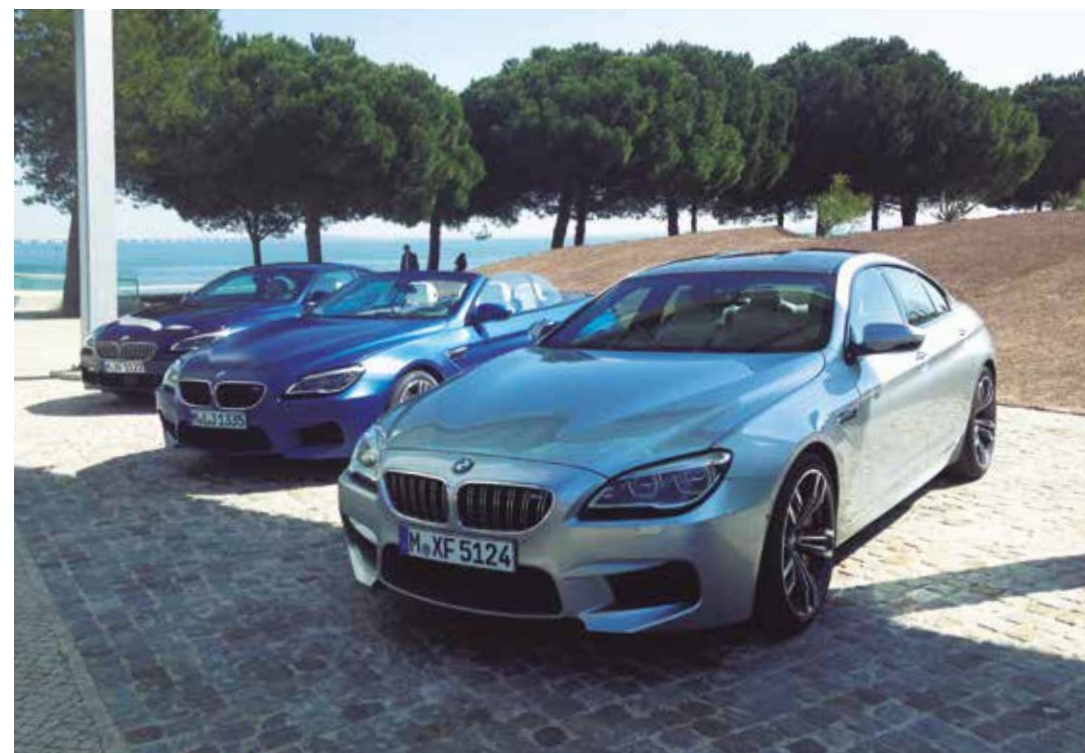
GRANDE Así luce el frontal del nuevo Serie 6. Gran personalidad y distinción.

El Serie 6 de BMW se ha caracterizado por combinar el lujo y la deportividad en su mejor expresión.