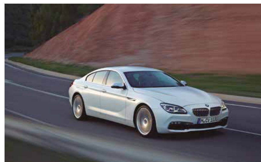
ÁGIL Lo manejamos en las carreteras de Portugal y su marcha fue impecable.