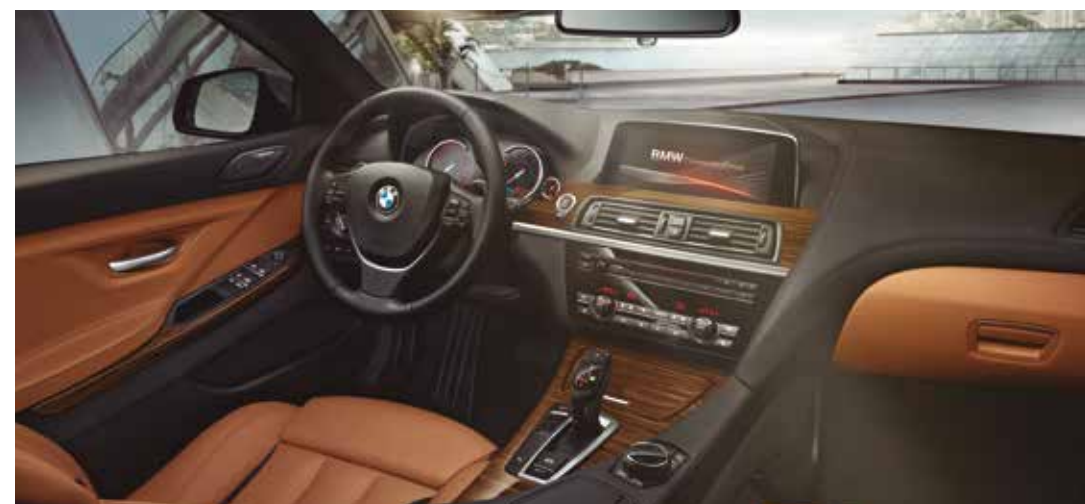
LA ELECCIÓN Detalles particulares son los elegidos por sus afortunados dueños.