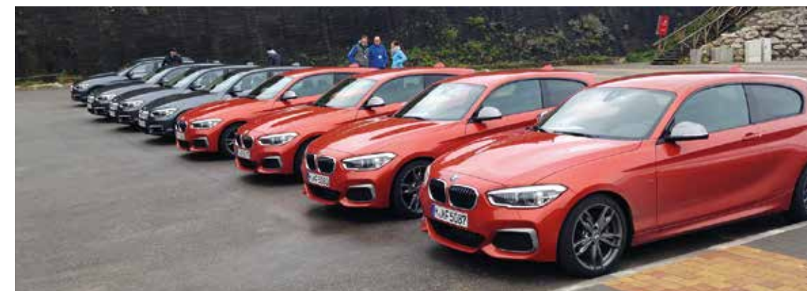
NUEVOS Así lucen los Serie 1 que nos acompañaron en la prueba de manejo en Portugal durante tres días.