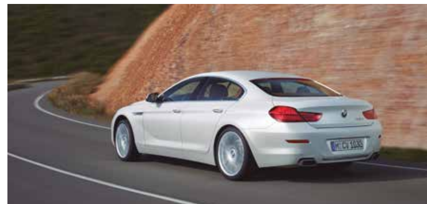
ATRACTIVO La parte trasera es quizá la que mejor define la personalidad del auto