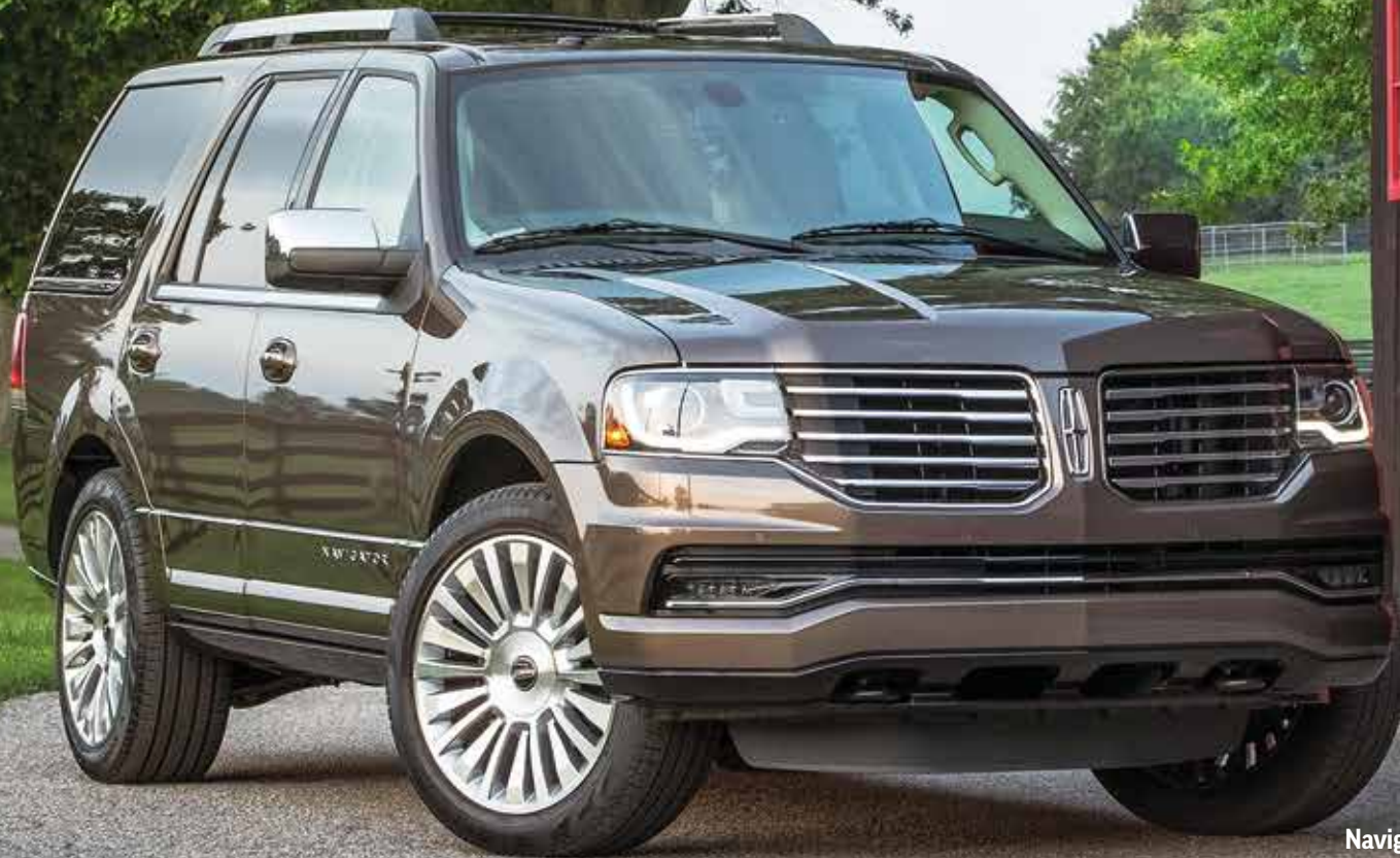
Navigator Reserve L