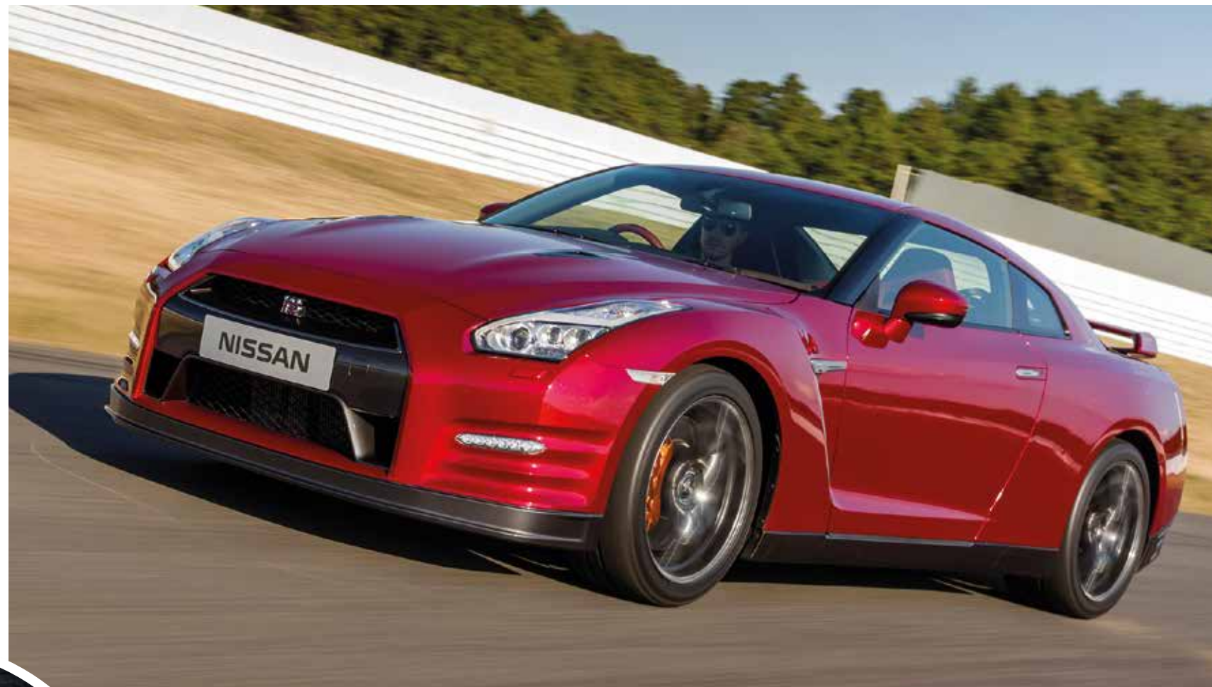
AL CALOR DE LA BATALLA Las pruebas dinámicas y la puesta a punto del motor de este kamikaze se hicieron en la pista alemana de Nürburgring, mejor conocida como el Infierno Verde, uno de los trazados más técnicos y complicados del deporte motor.