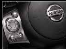
Controles de audio en el volante.