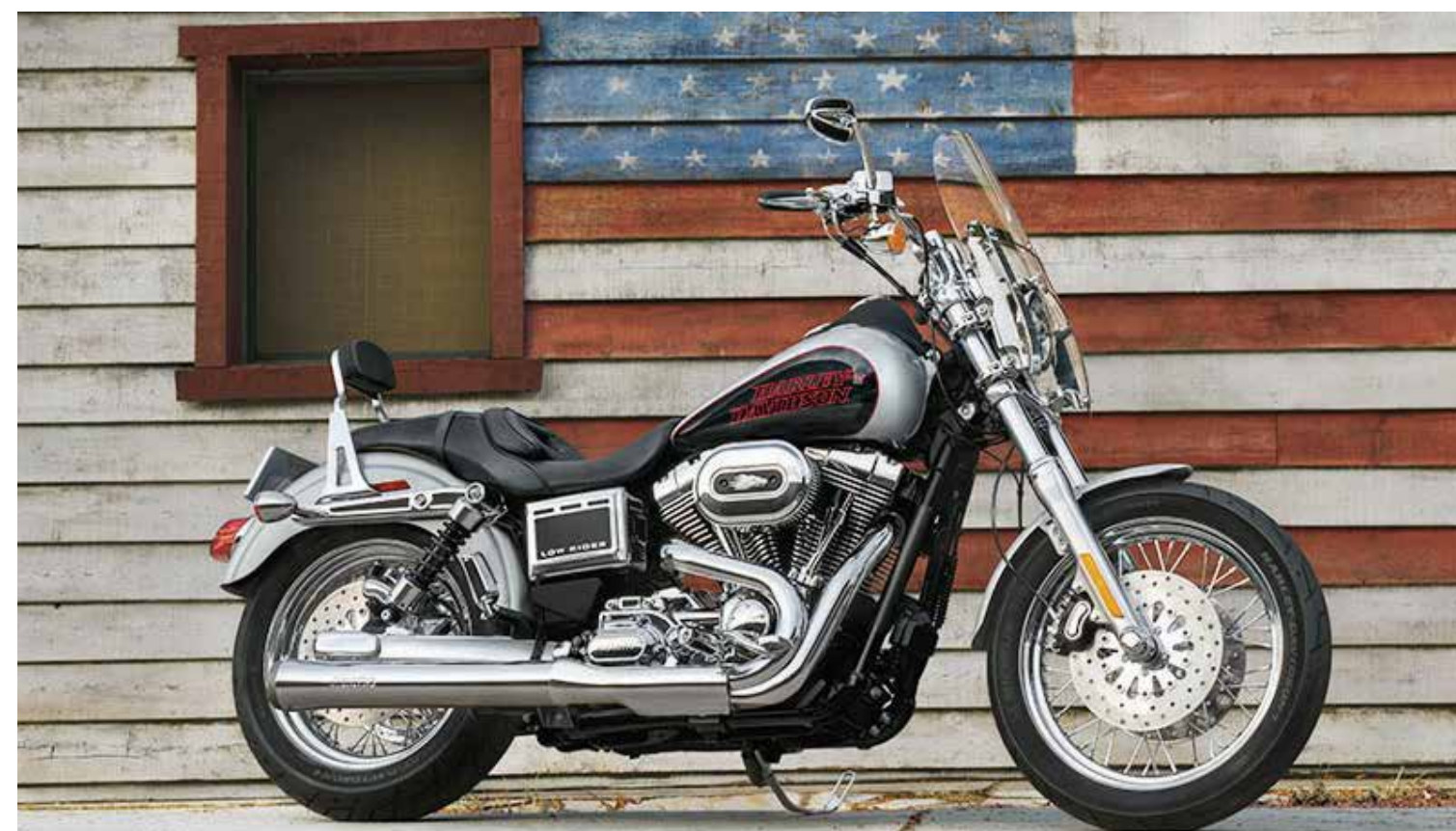
CRONO NATURAL. Low Rider es el homenaje a las motocicletas de los años 70. Hoy una Dyna Low Rider hace revivir el espíritu 100% americano. Llega en 17 mil 295 dólares.