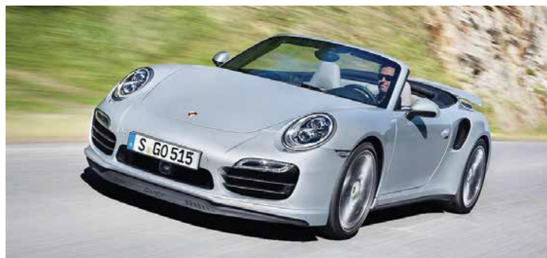
AIRE LIBRE Solo las 65 mph de Miami y nuestro 911 Turbo S Cabriolet nos permitieron disfrutar de la brisa del atlántico