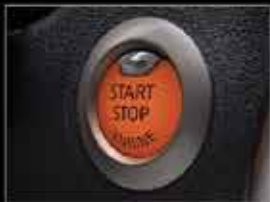
Botón de encendido y llave inteligente.

CON SEGURO GRATIS A CONTADO O CRÉDITO (1) Y ADEMÁS DESDE 10% DE ENGANCHE (2) O MENSUALIDADES DESDE $2,710 (3) CON CREDI NISSAN®