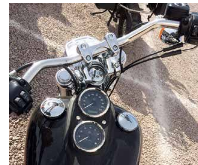
CLÁSICO, MEJOR Sus detalles cromados, rines fuertes, asiento tradicional e indicadores sobre el tanque de gasolina la convierten en un clásico dentro de la gama.

La consola central por arriba del tanque es negra y en vertical muestra el velocímetro y el tacómetro. En su estética los rines sumamente rudos, la altura llama al conductor a poseerla, además de que el asiento inspirado en las motos de hace unas cuatro décadas y sus acenos cromados balanceados con el negro.