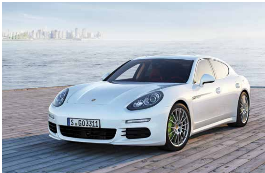
RASGOS Rines específicos, pinzas de frenos en color verde son solo unas cuantas piezas que delatan al Porsche Panamera SE-Hybrid.

Otra característica del 911 Turbo Cabriolet es el panel de techo arqueado con marco liviano de magnesio, como en los modelos anteriores, el techo se abre y se cierra en aproximadamente 13 segundos, a velocidades de hasta 50 km/h.