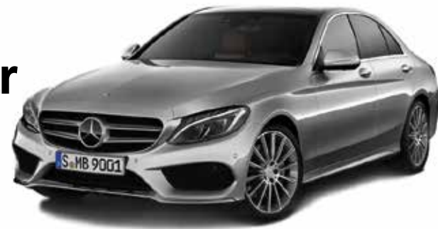
MERCEDES-BENZ CLASE C

deciden quienes merecen ser reconocidos en los diferentes segmentos. La razón de que se le haya otorgado el título al Clase C obedece a que la firma de la estrella se enfocó en llevar