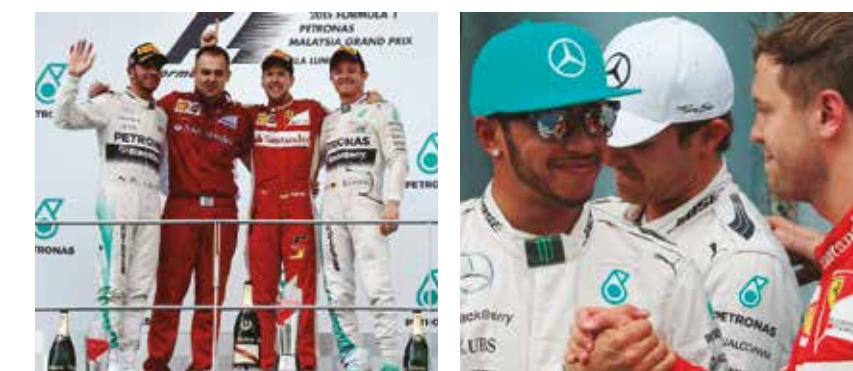
La pelea entre los pilotos de Mercedes-Benz y Ferrari continuará este fin de semana en la tercera fecha de F1.

Por su parte Toto Wolff, jefe del equipo alemán, señaló que tendrán una fuerte batalla por el campeonato este año. "Como hemos dicho desde Melbourne, esperamos una batalla durante toda la temporada para ambos campeonatos del mundo y tenemos que aprovechar al máximo cada oportunidad. China es la próxima oportunidad de hacer eso". Actualmente Lewis Hamilton está colocado como líder del campeonato con tres puntos de diferencia sobre Sebastian Vettel.