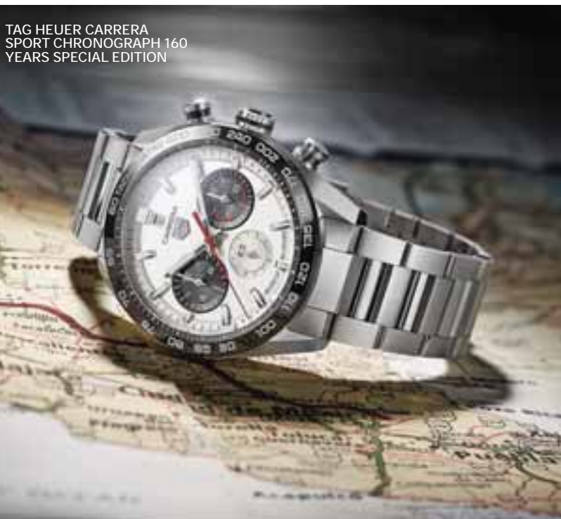
TAG HEUER CARRERA SPORT CHRONOGRAPH 160 YEARS SPECIAL EDITION