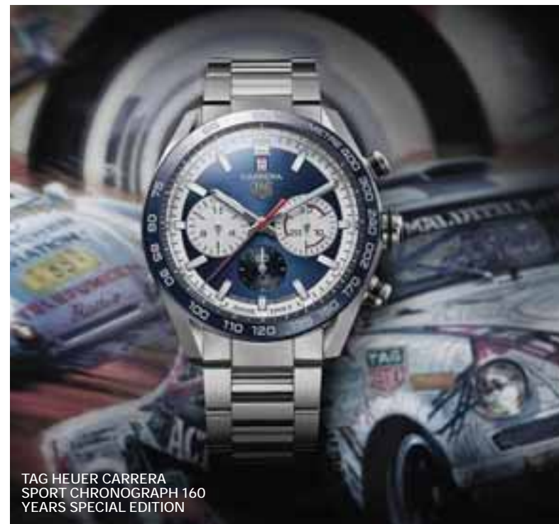
TAG HEUER CARRERA SPORT CHRONOGRAPH 160 YEARS SPECIAL EDITION