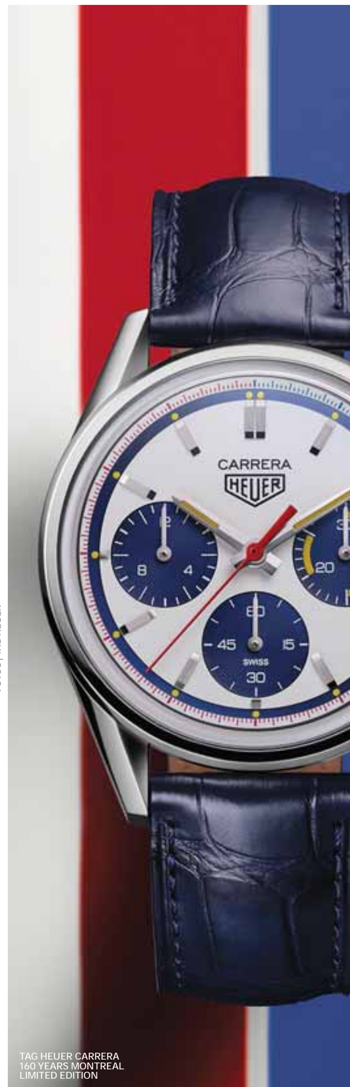
TAG HEUER CARRERA 160 YEARS MONTREAL LIMITED EDITION

Fue hace casi 60 años cuando Jack Heuer, entonces CEO de la marca, escuchó hablar sobre la Carrera Panamericana, un rally por carretera abierta que cruza diferentes estados de México. Desde sus orígenes es caracterizada especialmente por sus peligrosas rutas y por los temerarios pilotos que participan anualmente. A Heuer le atrajo la palabra "carrera", que en español significa: competición, rumbo o trayectoria profesional. Así supo que era el nombre perfecto para un robusto cronógrafo deportivo, y en el año 1963, la marca de relojería suiza de lujo presentó el primer modelo TAG Heuer Carrera. Fue una auténtica hazaña de Jack Heuer y hoy continúa siendo un verdadero modelo insignia de la marca. TAG Heuer continúa ligado a la emblemática Carrera Panamericana, cuenta con participación activa y es el Reloj Oficial de la competencia.