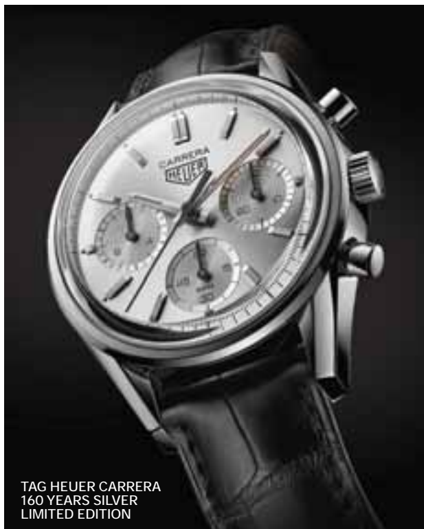
TAG HEUER CARRERA 160 YEARS SILVER LIMITED EDITION

La historia de TAG Heuer cumple, este 2020, 160 años de avant-garde y sí, su "carrera" ha sido sensacional, ligada desde un inicio a los deportes de velocidad y de motor