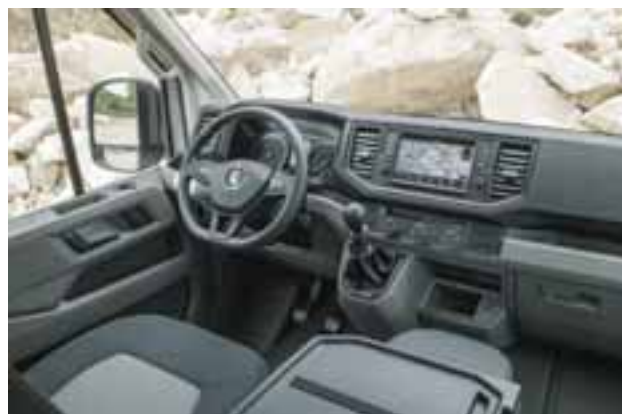
El interior presume de ser ergonómico y contar con una posición de manejo correcta y cómoda. El manejo es similar a la de un auto. |VOLKSWAGEN

La nueva dimensión de Crafter estará por llegar a México en el primer trimestre del próximo año, a definir versiones y precios, se hace en Polonia a razón de 100 mil unidades al año.