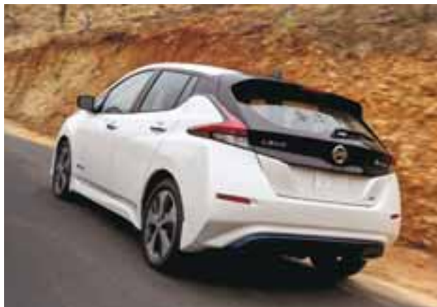
El portón trasero es muy llamativo en color negro y la apertura es de muy fácil acción. Los grupos ópticos son en LED en cuanto a la iluminación y la fascia es de material reciclado, al igual que la mayor parte de los plásticos. | NISSAN