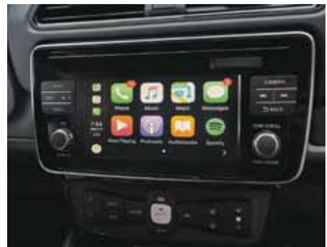
La conectividad está presente y los teléfonos inteligentes, incluso, se pueden recargar por inducción. | NISSAN