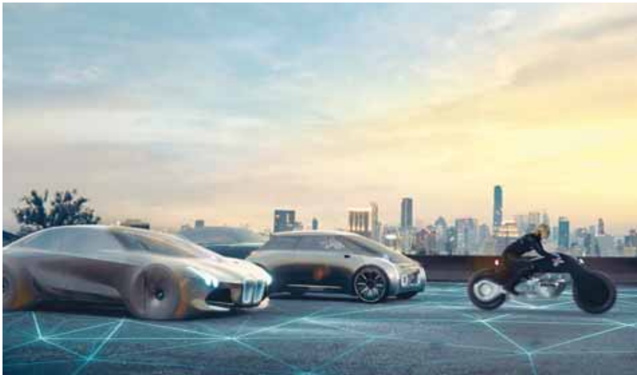
Serán 21 millones de vehículos autónomos para el año 2035 y al día de hoy, las firmas automotrices trabajan a tiempo completo para evitar que se presenten accidentes.