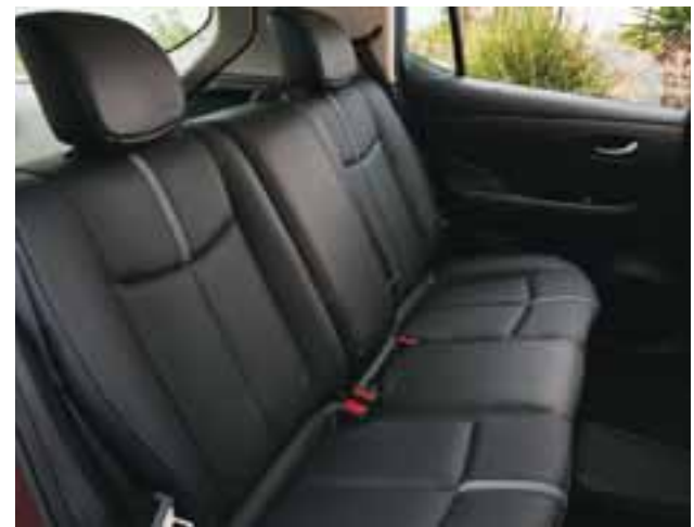
Los asientos son de muy buena calidad y éstos son de cuero. | NISSAN