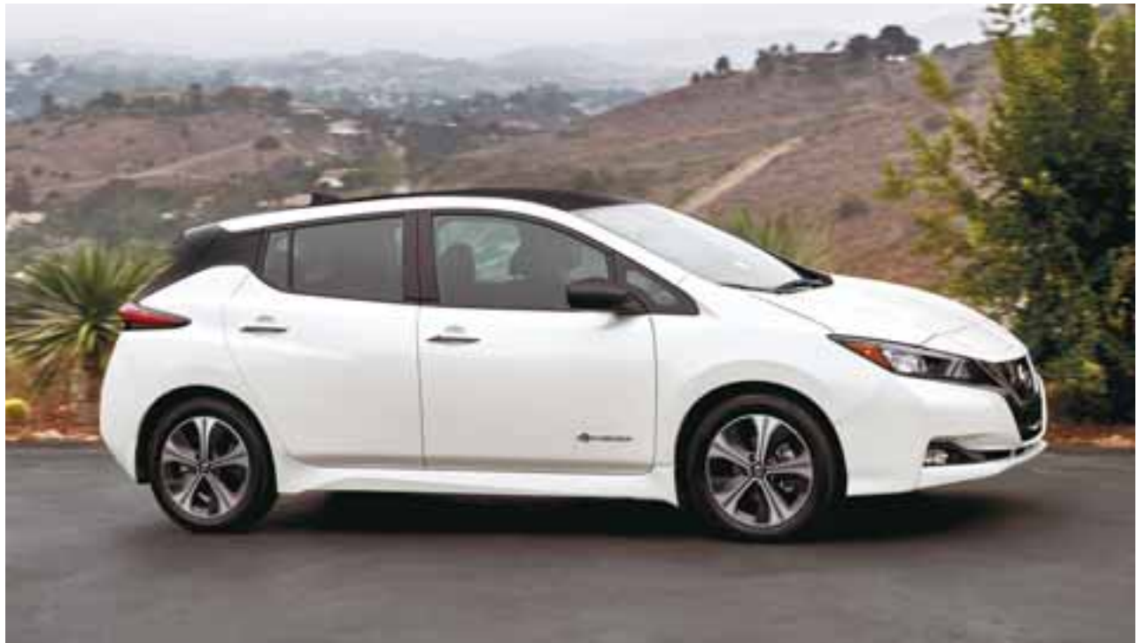
Las líneas laterales del auto, son quizá una de sus mejores cartas de presentación, ahora el diseño es futurista pero muy bien aterrizado en cuanto a una adaptación visual. Los neumáticos son especiales para el Nissan LEAF, ya que son menos resistentes a la fricción y se degradan después de ser desechados. | NISSAN

Para México estaremos muy atentos a su fecha de arribo y precio final.