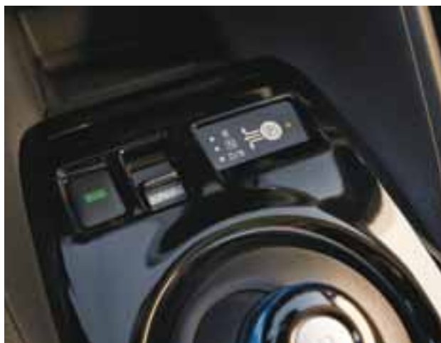
La palanca de cambios continúa con un tamaño muy pequeño pero de muy fácil accionar. | NISSAN