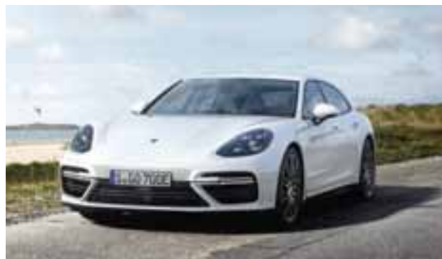
El nuevo Panamera Turbo S E-Hybrid Sport Turismo.

La firma alemana amplía su gama híbrida con una potente versión híbrida enchufable del Panamera Sport Turismo. El nuevo Panamera Turbo S E-Hybrid Sport Turismo combinará un propulsor V8 de cuatro litros con otro motor eléctrico, que le proporciona una potencia conjunta de 680 caballos (500 kW). Con sólo superar el régimen de ralentí el Panamera Turbo ofrece ya 850 Nm de par motor. Eso le permite acelerar de 0 a 100 km/h en 3.4 segundos y alcanzar una velocidad máxima de 310 km/h. Según el nuevo ciclo de homologación europeo (NEDC), el auto