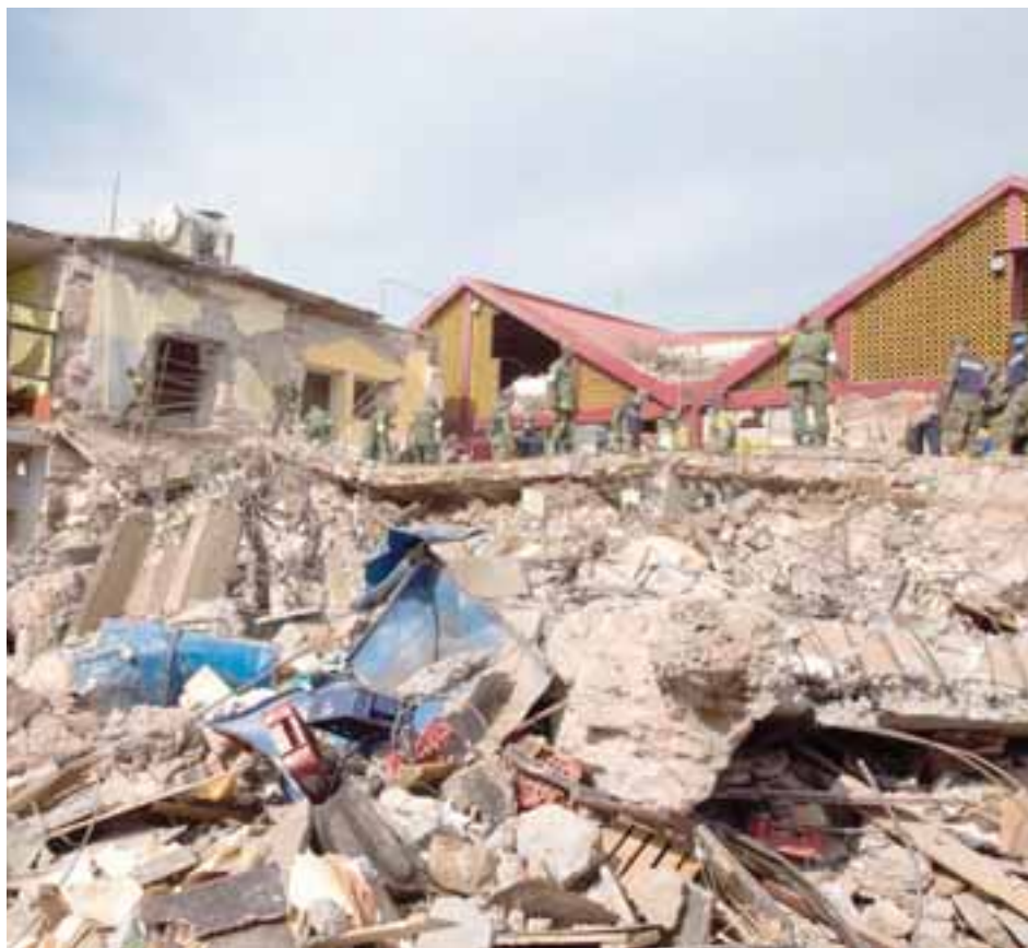
Antes de contratar un seguro analiza las condiciones y ventajas que ofrece.

Ante desastres naturales también es necesario estar protegidos, por ello te damos algunas recomendaciones para proteger tu carro