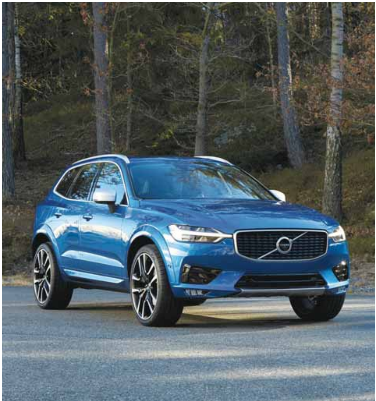
El frontal inferior luce un diseño deportivo gracias a una parrilla con malla en negro brillante. | VOLVO