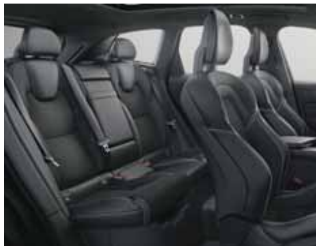
La tapicería está desarrollada en nubuck y piel napa . | VOLVO