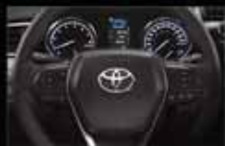
Controles de audio al volante