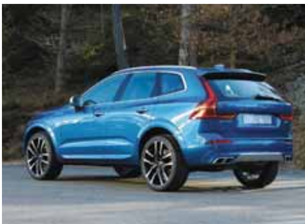
Los rines de 21 pulgadas con diseño deportivo acentúan el carácter de este vehículo.