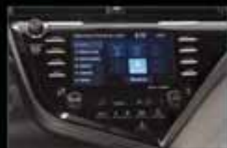
Sistema de conectividad Bluetooth*