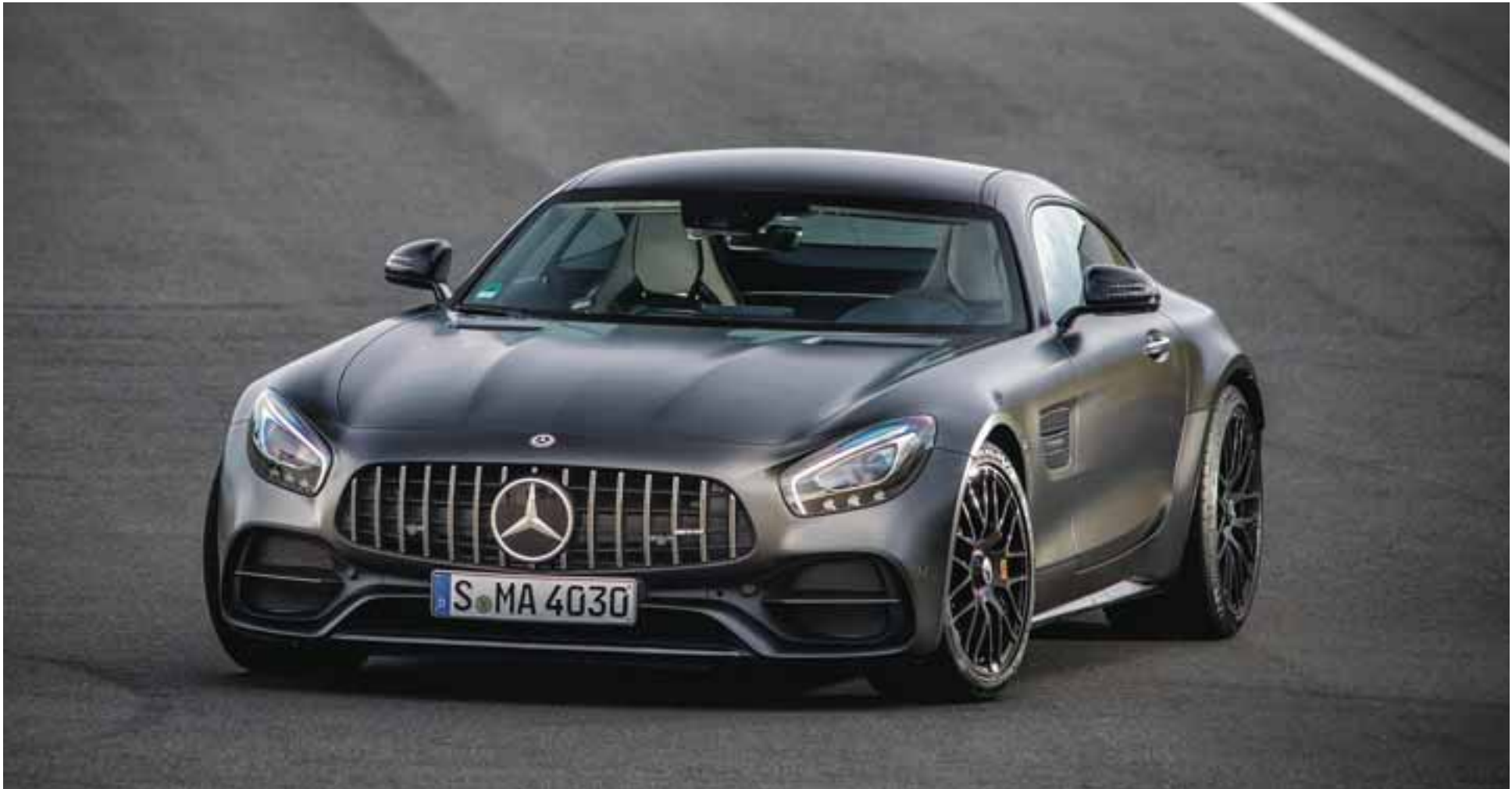
La familia Mercedes-AMG GT se completa con diferentes versiones.

Hasta cuatro diferentes modelos, potencias y equipamiento fueron nuestros anfitriones para conocerlos, manejarlos y disfrutarlos en pista en la parte norte de Alemania