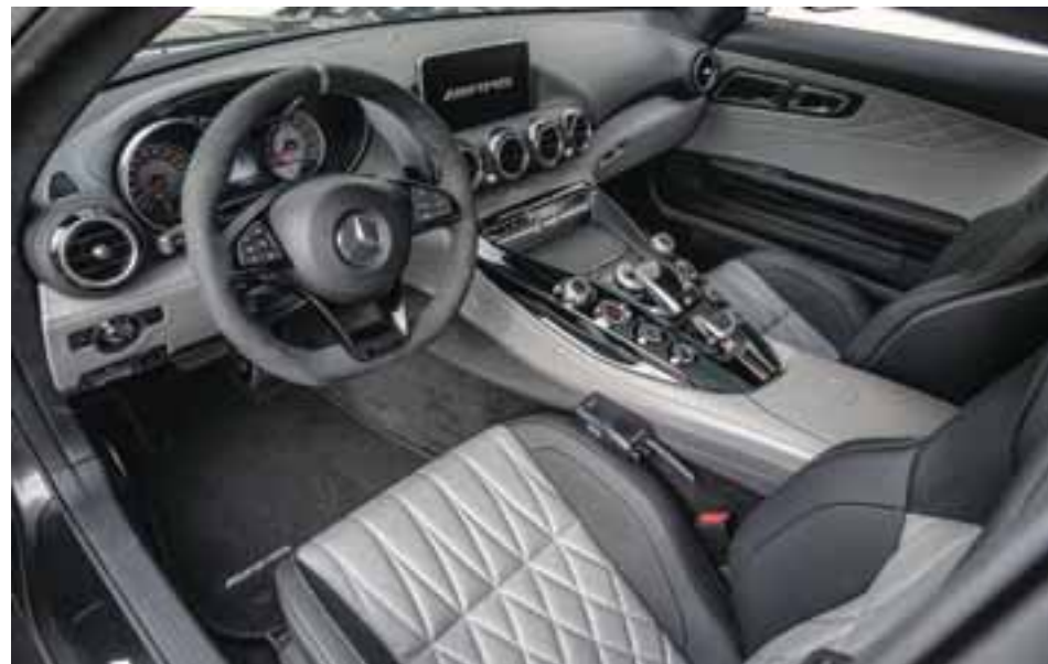
Un deportivo de alta gama.

El sistema de frenos de alto rendimiento AMG con discos de material compuesto de grandes dimensiones, auto-ventilados, ranurados y perforados en todas las ruedas ofrece cotas de desaceleración excelentes y una capa-