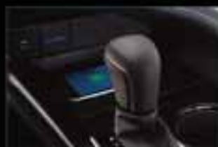
Cargador inalámbrico para smartphone*

Este anuncio es una referencia publicitaria. Las especificaciones de los vehículos pueden variar de acuerdo a las versiones disponibles. Para mayor información pregunta en tu Distribuidor Toyota más cercano. Las fotos de los autos son sólo referencia. Sistema de audio con 9 bocinas. Aplica para la versión XLE NAVI. *Aplica para las versiones SE, XL y XLE NAVI.