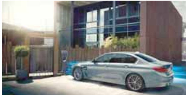
El objetivo es que las personas opten por comprar vehículos eléctricos.