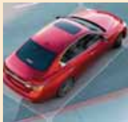
Un sistema que ayuda al conductor. | INFINITI

Este sistema también se complementa de una alerta sonora que funciona con radares. Esto emitirá una alerta para avisar al conductor cuando está cerca de algún objeto. AUTOS RPM