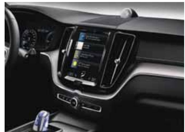
El panel de instrumentos posee una pantalla de 12", desde la cual se gestiona el mayor número de comandos. | VOLVO