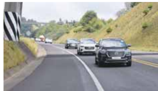
El recorrido nos permitió conocer las capacidades dinámicas de la nueva Hyundai Santa Fe, las cuales cumplen correctamente con el enfoque del vehículo.