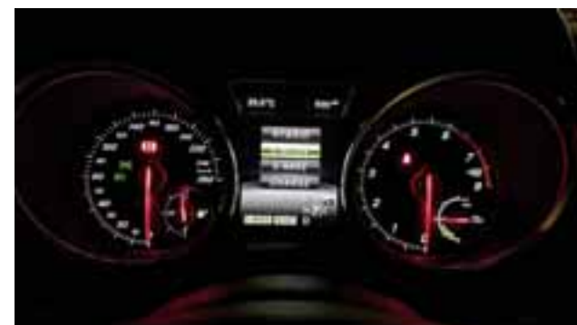
El cuadro de instrumentos es claro y preciso en cuanto a información. Mercedes Benz continúa con la tradición de montar dos grandes relojes.

Mercedes Benz GLE 500 e 4Matic, un millón 490 mil pesos.