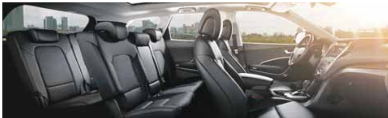
El espacio interior es destacable, incluso personas que superan el 1.70 m de altura viajarán cómodamente. Los asientos frontales presumen de una muy buena sujeción.