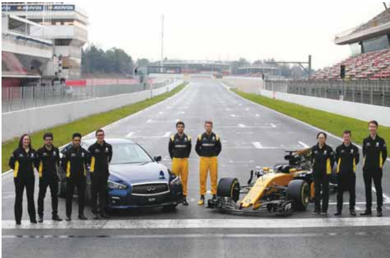
Infiniti Engineering Academy no sólo de técnica se nutren los expertos. La pista y los autos Infiniti con la mejor tecnología son herramientas del día a día. | INFINITI