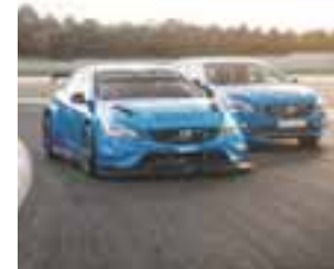
La versión deportiva del S60 Polestar se lució en el Infierno Verde. | VOLVO