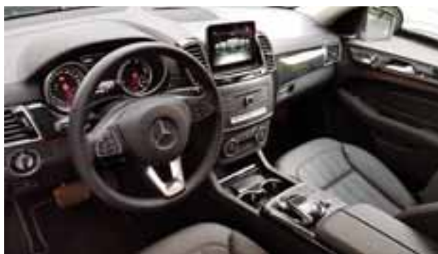
Como siempre, los interiores espaciosos, cómodos y detallados a la perfección. Nada menos en un Mercedes Benz. | MERCEDES BENZ

En este SUV híbrido, podemos recorrer hasta 30 km