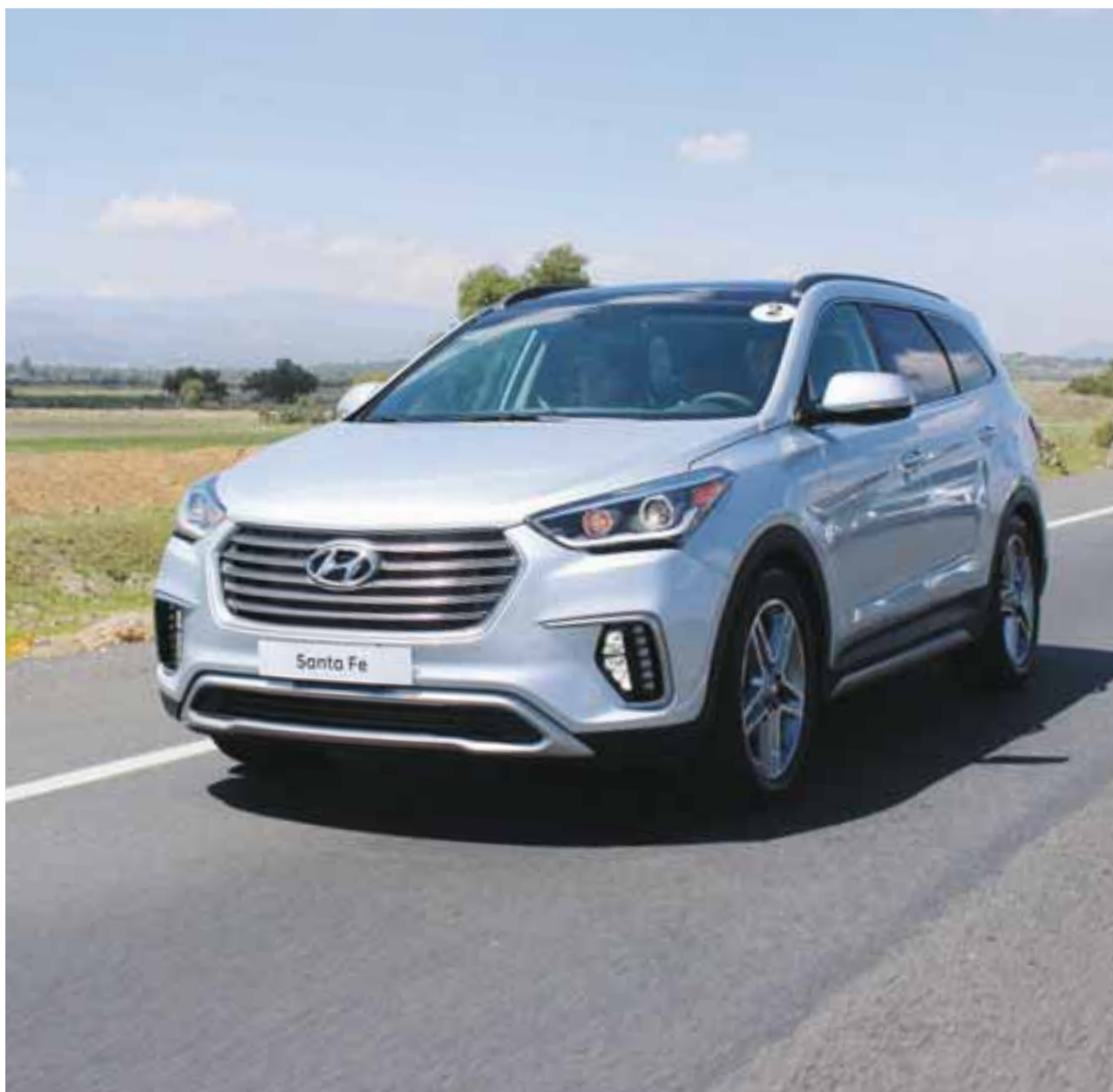
En nuestra prueba de manejo por el estado de Veracruz, la nueva Hyundai Santa Fe demostró una muy buena calidad de marcha y confort.

Como todos los modelos de Hyundai Motor de México, cuenta con la cobertura por dos años contra daños fortuitos para los neumáticos de toda la gama de vehículos nuevos Hyundai. Además del beneficio de cinco años de garantía defensa a defensa.