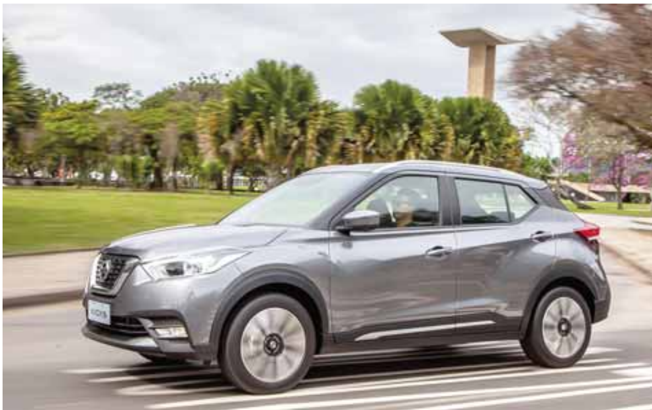
El Nissan Kicks es uno de los modelos más representativos de la firma oriental. Su capacidad para transportar a la familia y bajo consumo son sus mejores cartas.

Por 94 meses consecutivos, Nissan es el líder absoluto en el mercado nacional con un 27.2%