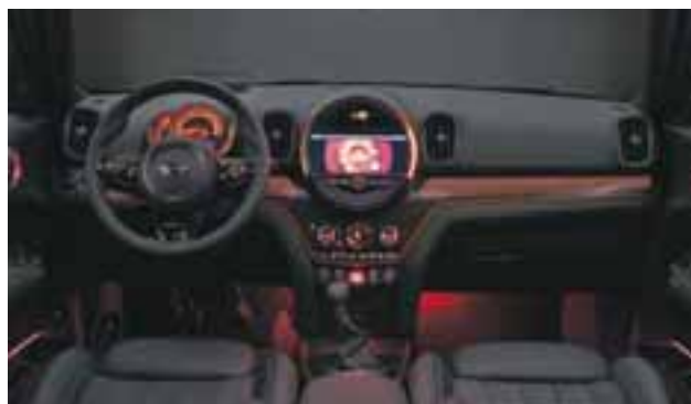
La pantalla central ahora es touch y en la versión Sport se ofrece navegación.

La segunda generación del MINI Countryman, bajo la personalidad The Adventurer , es de dimensiones compactas, es 20 cm más largo que su antecesor que lo llevan a los tres metros de largo, espacio que se refleja en su amplia cajuela, así como en las cinco plazas de pasajeros, que ofrecen comodidad y amplitud sin dejar de lado