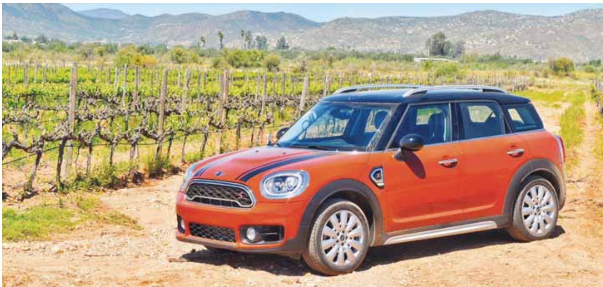
La ruta del vino en el Valle de Guadalupe, BC, marcó sin duda una excelente experiencia de manejo para comprobar las capacidades dinámicas del MINI Countryman de segunda generación.