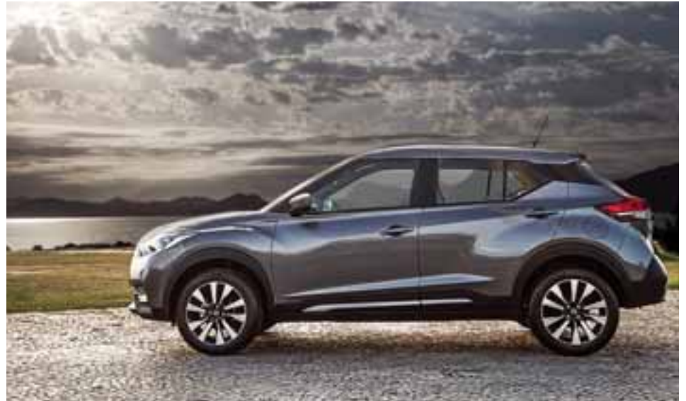
El trazo estético general es más agresivo gracias a una parrilla V-Motion, Signature Lamps y faros de niebla.

Este crossover viene equipado con control activo de trazo, control activo de marcha y asistente activo de frenado en la versión tope de gama. Sin embargo, todas cuentan con sistema de frenos ABS, distribución electrónica de frenado y asistente de freno. Asimismo, el nuevo Around View Monitor brindará una visión periférica en el monitor central gracias al empleo de cuatro cámaras posicionadas estratégicamente.