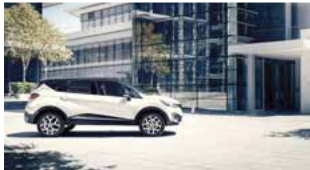
El Renault Captur es sin duda uno de los mejores vehículos de la firma francesa. | RENAULT

Duster: 2,327; Stepway: 813; Koleos: 481; Captur: 272 para un total de 3,893 unidades SUV de venta total en el acumulado del año.