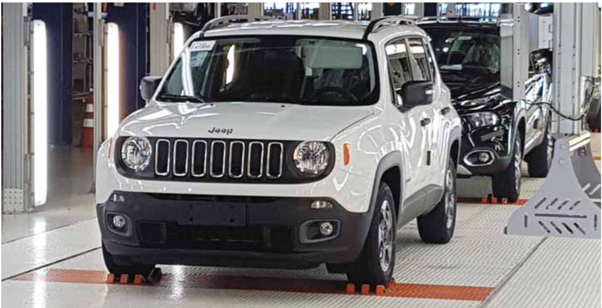
Con una capacidad de producción de hasta 250 mil unidades por año, Jeep Renegade presume de tener un proceso muy cuidadoso y correcto en Brasil, lugar desde donde llega a México. MR