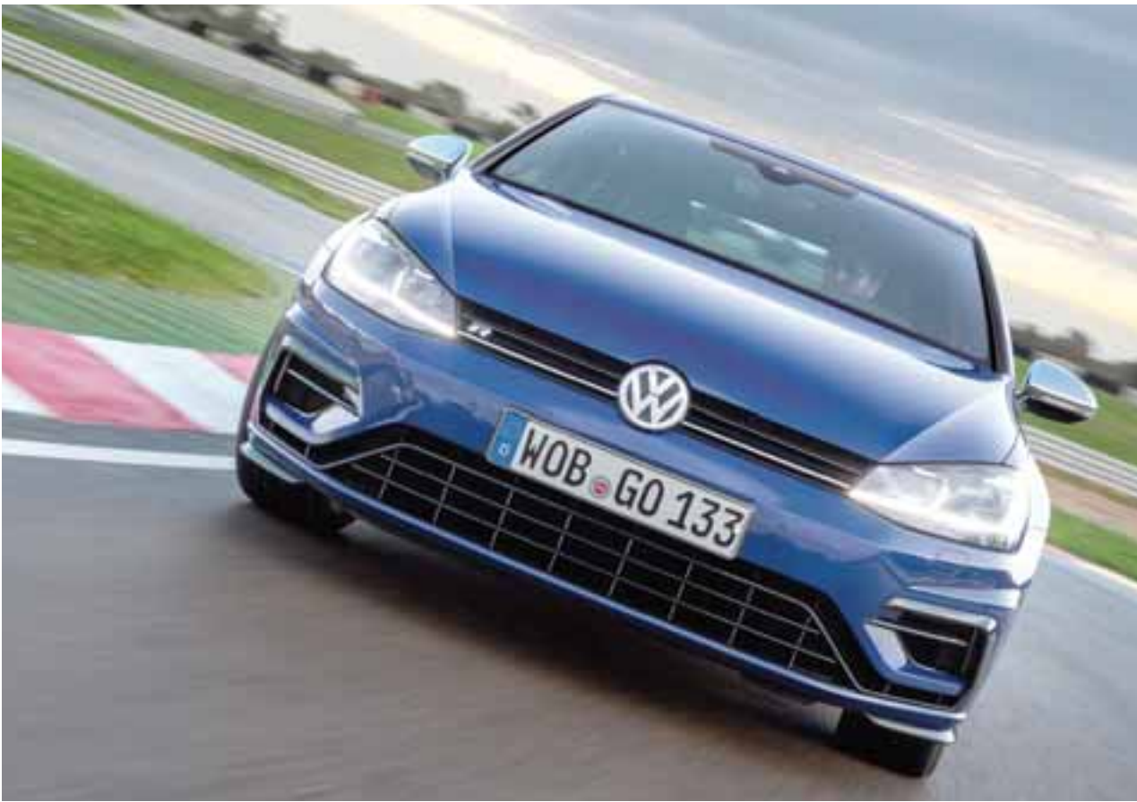
Inconfundible, así es el frontal del Golf R que presume una parrilla cuadriculada más grande y enfocada a la deportividad.