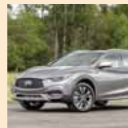
El piloto alemán ya sueña con otro campeonato. | INFINITI

La visión de Tesla respecto a la electrificación de vehículos ha sido muy positiva, no obstante no sólo se tiene que pensar en desarrollar un vehículo eléctrico capaz, de abastecerlo cuando sea necesario, y de la manera correcta: con practicidad y oferta de estaciones de carga. Además la conectividad entre autos evitará accidentes en un futuro. AUTOS