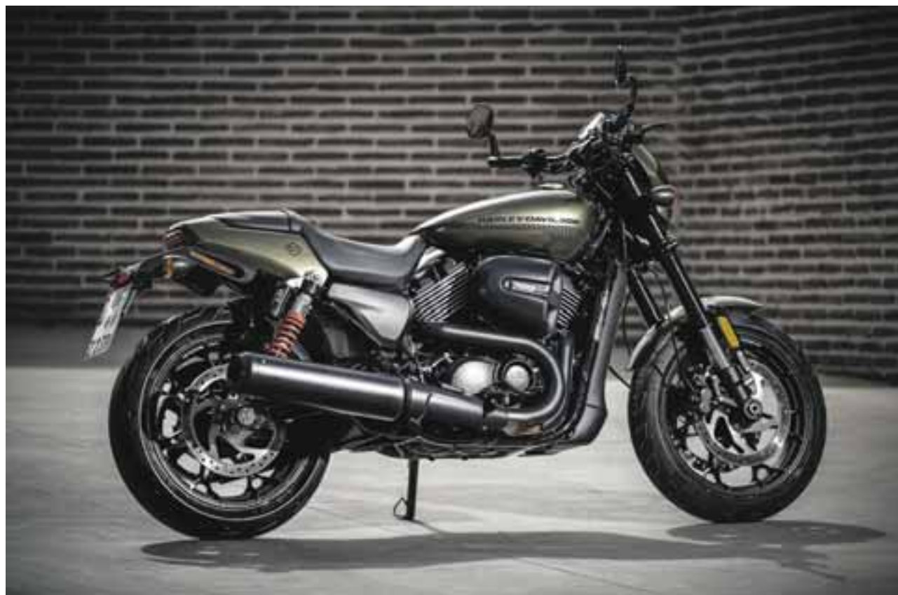
En México la Street Rod cuesta 199 mil 900 pesos, (variación sin previo aviso). | HARLEY-DAVIDSON

Así que te subes a una moto que hoy ha evolucionado, entrega más potencia que el motor con el que inicia la familia no sólo para hacerla más rápida sino mejor balanceada con el torque que también ha subido, la combinación ha dejado un motor que en arranque, rebase y en el camino te hace sentir más seguro pues llevas en el acelerador la