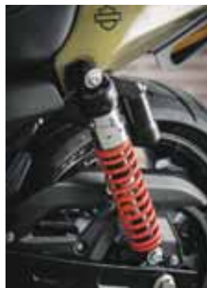
La seguridad es principal, de serie cuenta con frenos de doble disco, dos zapatas y el sistema de reconocimiento sin llave para encenderla.