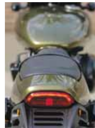
Ligera, con la potencia adecuada, peso y tamaño magníficos, para muchos será su primera Harley-Davidson. | HARLEY-DAVIDSON

energía necesaria para salir adelante de cualquier situación. Para hacerlo, el motor respira mejor con su nueva entrada de aire, pero también lo saca más eficiente con un nuevo mofle de más flujo.