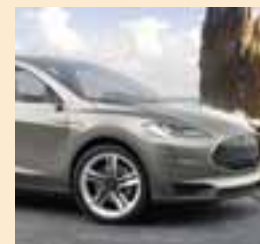
Ahora Tesla, presume de ser la empresa automotriz más valiosa. | TESLA