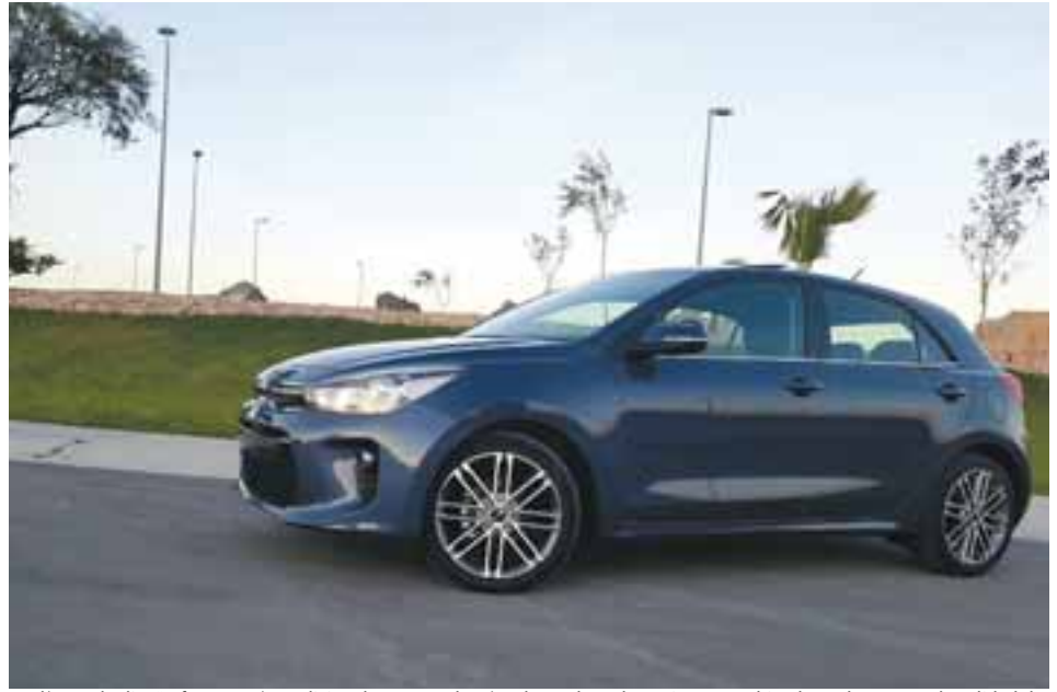
Las líneas de diseño fueron más tradicionales, pero además, el auto luce deportivo y muy bien logrado. Se nota la calidad de materiales usados así como una pintura de buen grado. MR

ción mixta, logramos hasta 14.7 km/l nada mal para un auto con transmisión automática. Ampliamente recomendable.