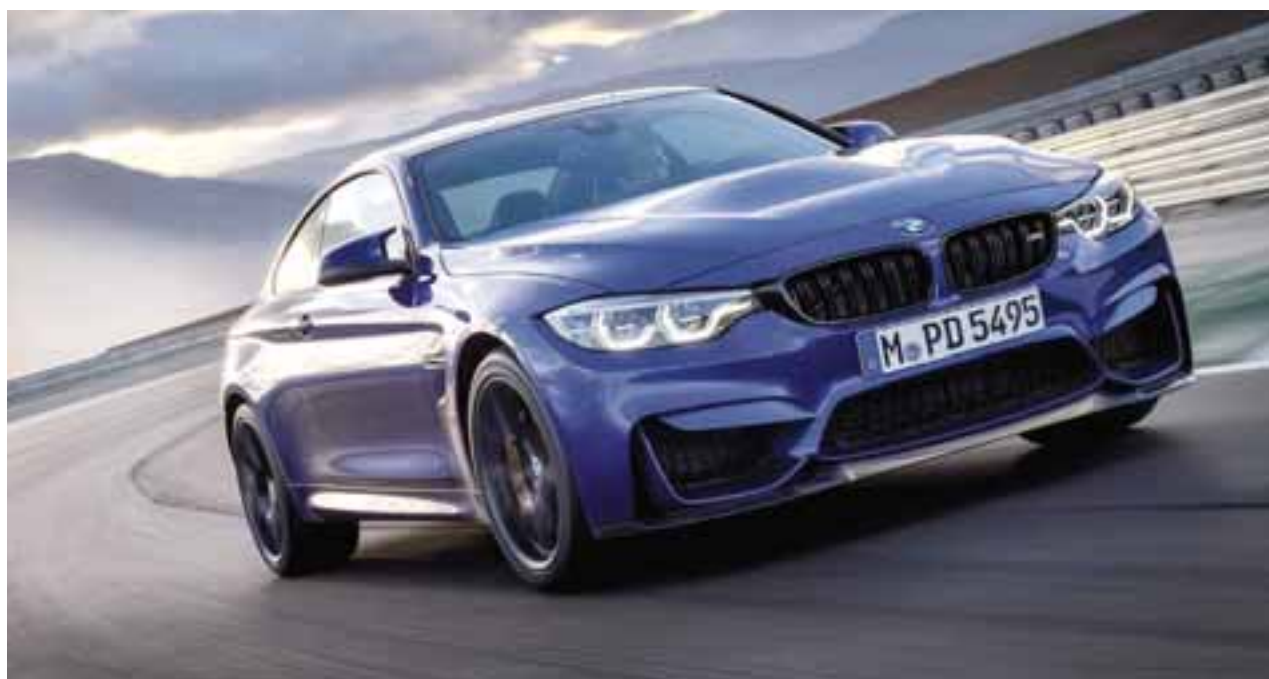
Como un gran BMW, el M4 CS presume de un frontal más afilado, con sendas tomas de aire para dar paso a un mejor flujo de aire con una mejor respuesta en pista.

Hoy el estilo de vida ha cambiado y el estar conectado es lo que también nos ha llevado a tomar decisiones valuando distintas cosas. Hoy en día esto dicta lo que necesitamos para vivir, y ya nos hace sentir incómodos subirnos a un auto que sólo tenga una entrada USB, que no podamos cargar el celular sin cables o que el WiFi del auto no esté funcionando o se le acaben los datos, quizás esto del WiFi en México aún nos faltará unos 24 a 36 meses, pero ya es norma en Estados Unidos. En Europa hasta los taxis ofrecen este servicio gratis. Es más, si usted toma algún autobús en el país es increíble que no lleve servicio de WiFi , o en los aviones... qué decir de las pantallas de los autos, ahora tendremos todo el tablero digital que puede convertirse en su Waze . Así la tecnología está cambiando nuestros hábitos y todo ello afecta en su decisión de compra... auto no conectado tiende a desaparecer. Veamos como evoluciona. ¿Ya se conectó a Internet desde su auto? Falta poco... se lo aseguro, guardará bien su clave para que no le gasten sus datos.