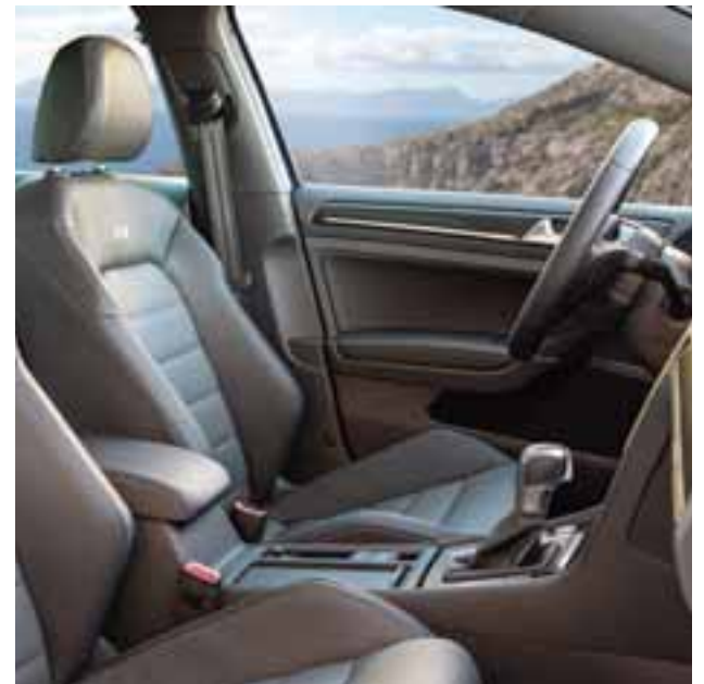
Los asientos en piel y de cubo ofrecen de los mejores agarres en todo momento. | VOLKSWAGEN

renombrada 4Motion, configurada para sujetarse al trazado, pero también para soltar un poco el control y di-