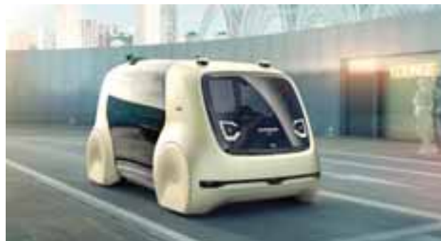
Grupo Volkswagen dejó ver imágenes conceptuales de su futurista Sedric.

Al final del día sabemos que podrán tener algunas diferencias, pero la solución básica es la misma: sistemas GPS de gran información con tiempo real de tránsito, rutas y situaciones; radares que determinen, en conjunto con el GPS, las condi-