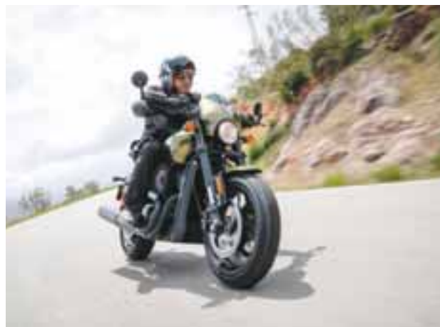
Street Rod es lo más cercano a tu convertible de diario, pero con mucho más movilidad. | HARLEY-DAVIDSON