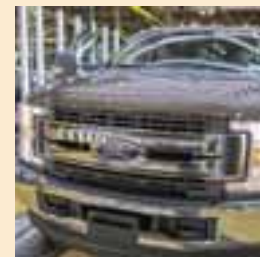
Ford estará presente en nuestro país por muchos años más. | FORD

De acuerdo al centro de investigación Pew Research Center, los millennials tienen entre 20 y 30 años, son la generación más numerosa en EU. INFINITI, con su filosofía Empower the drive , empodera a los conductores y atrae a dichas generaciones con sus atributos únicos: diseño, adrenalina pura, tecnologías innovadoras y compromiso ambiental. AUTOS