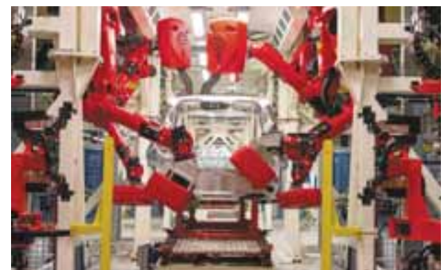
La fábrica del grupo(FCA) localizada en Goiana, Pernambuco, es la más moderna en el mundo. Ahí se ensambla el Renegade, Compass y FIAT Toro. FCA

Las superficies principales, como el suave panel de instrumentos integrado, van intercaladas con atrevidos elementos funcionales como la agarradera del copiloto, indispensable para las aventuras y heredado de su hermano mayor, el legendario Jeep Wrangler. Los detalles de diseño y los colores están basados en el equipamiento típico de los deportes extremos, mientras que las familiares formas en X inspiradas en sus faros traseros se suman al diseño interior del Renegade.