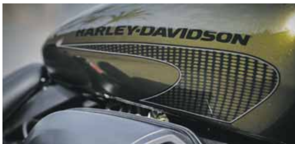
Diseño que conquista, sólo hay que verla. Es, además, un lienzo en blanco pensada para que la personalices. | HARLEY-DAVIDSON

En la suspensión se ha puesto más aluminio y se ha invertido la delantera, resultando mayor capacidad de absorción y, junto con sus resortes traseros expuestos, la moto te permite sentir mucho menos las irregularidades, topes y baches, mientras que en velocidad el curvado es mucho más parejo. El chasis revisado, está plenamente adaptado a confort.