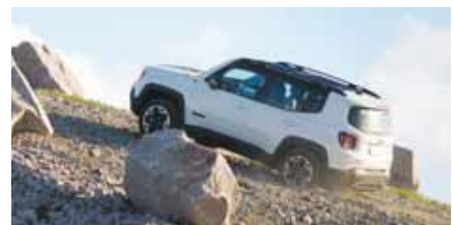
Con pruebas off-Road y on-Road, Jeep Renegade demostró el porqué es un verdadero vehículo Jeep, ya que sabe trepar, pero también andar rápido en pavimento. FCA