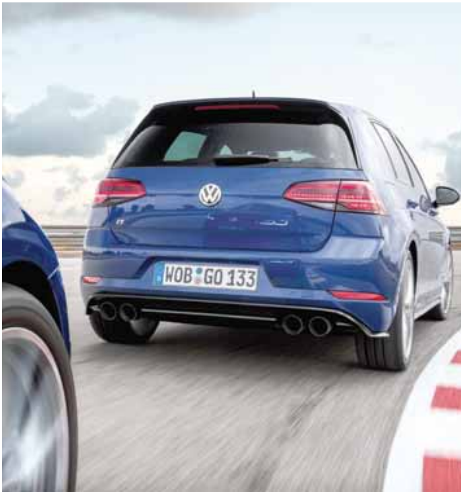
Sin duda de las mejores "traseras" que presume un Golf. La letra R nos indica poder absoluto y diversión. | VOLKSWAGEN