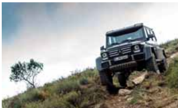
El recorrido de la suspensión trabaja de manera ejemplar, lo mismo que su poderosa gama de motores.

terreno es que se construye en Graz, Austria desde 1973 con un encargo a Daimler por parte de las fuerzas armadas para hacer un auto con capacidades todo terreno y que no se perdiera el estilo y lujo que distingue a la firma alemana. Desde esa época, se han