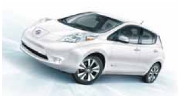
Nissan Leaf es producto de la innovación de uno de los grupos más importantes del planeta.