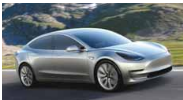
Tesla Model 3 no ha anunciado especificaciones ni precio oficial, sin embargo, se espera mucho de él.

kilómetros y un precio único de 499 mil 900 pesos, luce un diseño aerodinámico completamente novedoso y ya incluye cargador eléctrico.