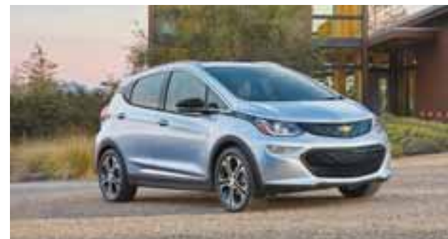
Chevrolet Bolt EV fue nombrado el Auto del Año en el marco del NAIAS 2017. | CHEVROLET MÉXICO

Será develado en julio de este año, así lo confirmó Elon Musk, mandamás de la compañía californiana, y su precio aproximado será de 35 mil dólares. POR GUILLERMO LIRA Y MARCO ALEGRÍA