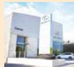
La fachada de la nueva distribuidora luce espectacular.