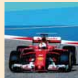
El piloto alemán ya sueña con otro campeonato.

De la mano de Grupo Autosur, el sitio está ubicado en Av. Bonampak Manzana 1 y cuenta con una superficie de 2,162.27 m 2 de terreno y 2,189.77m 2 de construcción. AUTOS