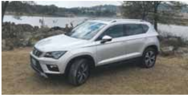
SEAT Ateca también ofrece asistencia de aparcamiento mediante cámaras con visión 360 y sensores.

Un vehículo que probamos en su versión Xcellence, analizando los aspectos que más interesan a las mujeres