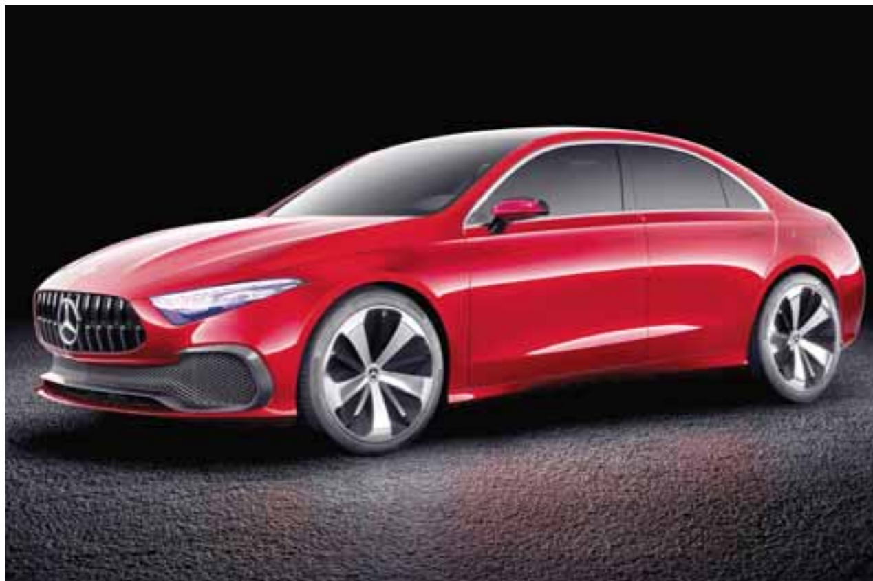
El segmento de entrada al mundo premium tendrá una nueva estrella, ¿lo presentarán como modelo de producción en el auto show de Frankfurt? | MERCEDES-BENZ

China es uno de los mercados más importantes, y su preferencia por eléctricos y autos de lujo es evidente