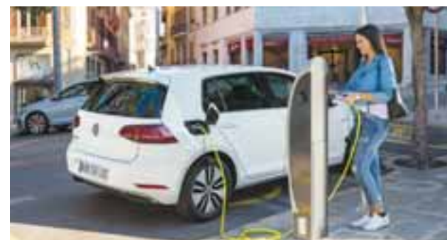
e-Golf podría llegar en 2018 con 300 kilómetros de rango y 136 hp para un manejo totalmente electrizante.