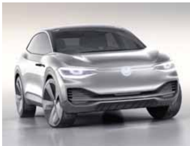
Volkswagen I.D. Crozz es el tercer concepto eléctrico de la marca. | VOLKSWAGEN

Dos ejemplos se vislumbran en este segmento de mercado. Imagine un motor eficiente de cuatro cilindros, un peso menor a un enorme off-road , una imagen más fuerte, elegante y con dimensiones ideales para maniobrar en la ciudad. Toyota acaba de presentar su FT-4X como concepto, mientras Jeep Renegade llega en mayo a nuestro país. Si bien el “jeepero” de corazón, o el que deseaba un FJ Cruiser de Toyota, no encontrará lo mismo en estos nuevos exponentes, una enorme cantidad de clientes nuevos se subirán a este segmento. Siendo honestos, muchos teníamos un 4x4 olvidado en el garaje. Hoy la respuesta está en los “Aventureros Light”. Después de todo, cumplen con las necesidades del cliente y la familia, y gozan de un espacio de carga ideal, ni más, ni menos.