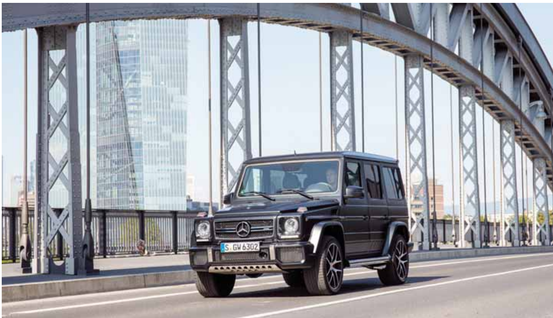
Desde los bosques, hasta la jungla citadina, no hay rival para este legendario 4x4.