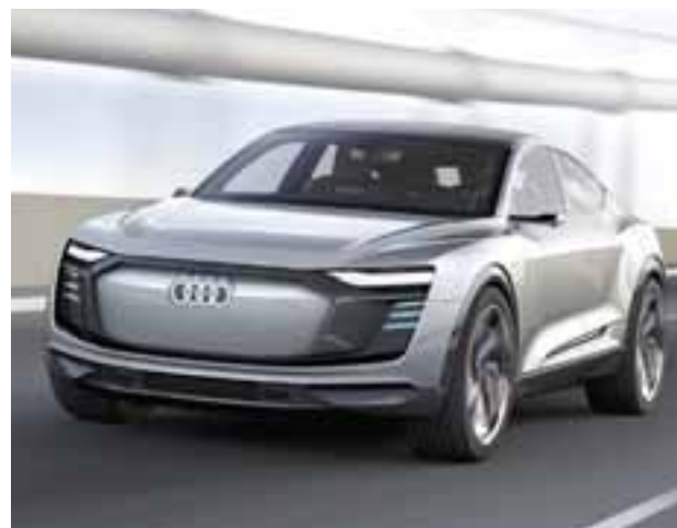
Audi e-tron Sportback Concept: una visión eléctrica, lujosa y deportiva.