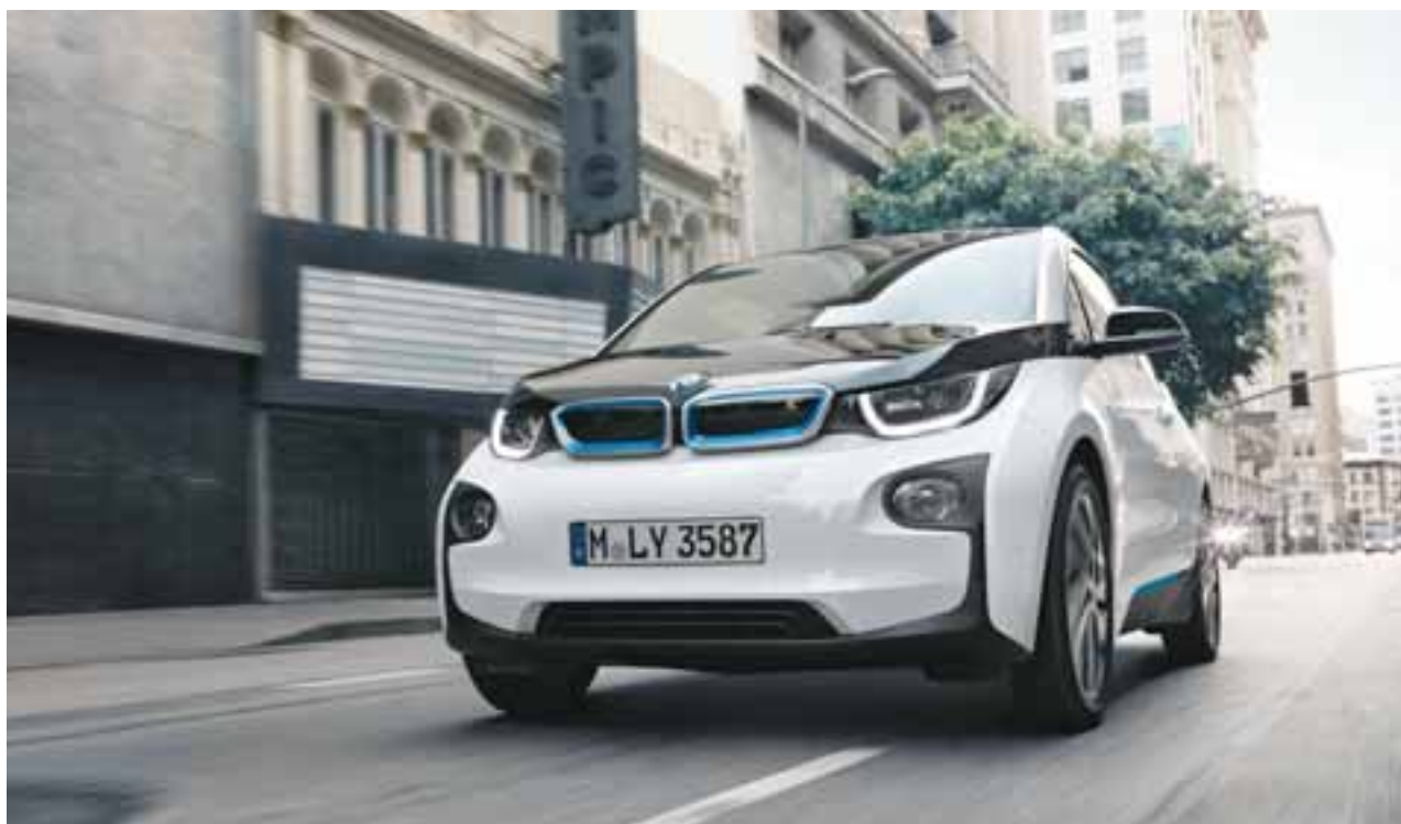
BMW i3 es más amplio, más limpio, más llamativo y rodará más kilómetros que antes.