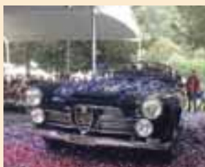
El ganador es el mejor clásico del país, y quizás, de Latinoamérica.

El gran Concurso de la Elegancia, nombró como Best of Show al Alfa Romeo 2600 Spider Touring modelo 1964, ganador también del Best European . Felicidades a AYCO Clásicos y a la familia Mangino, colaboradores en nuestro equipo editorial. AUTOS