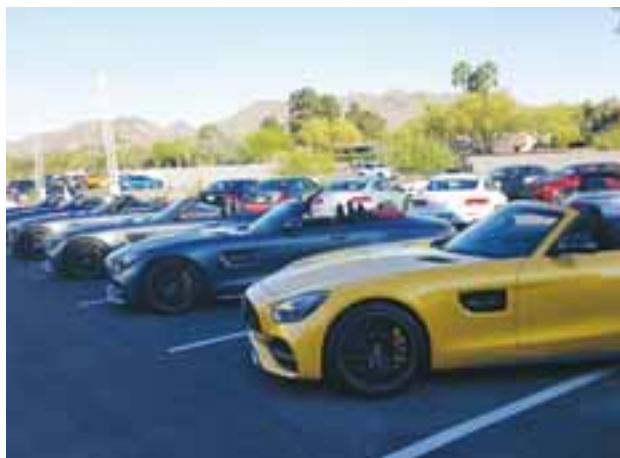
Es difícil decidir qué color cuando el auto lo ofrece todo. Gran presentación de Mercedes-Benz a nivel mundial, el músculo deportivo se nota. | CLAUDIO ZUCKERMANN