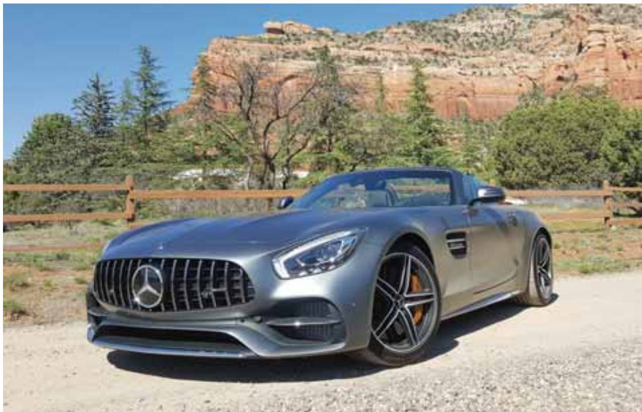
La casa de Affalterbach afinó bien el lápiz para incrementar la hermosura de su GT con nueva parrilla frontal y nueva líneas laterales que sutilmente constituyen un facelift.

Sin temor a equivocarme, este nuevo AMG GT Roadster hará voltear a muchos que tenían la vista puesta en su acérrimo rival, el Porsche 911. La batalla es fuerte, pero AMG, que cumple, este 2017, 50 años de existencia, está a la altura para pelear por el trono de los superdeportivos descapotables.