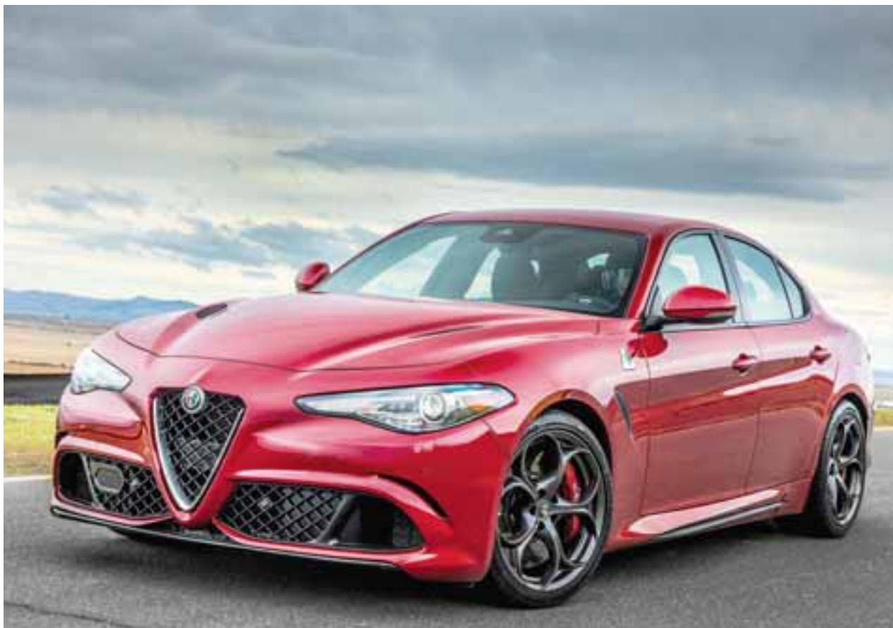
Las tres versiones hacen que este auto suene atractivo, desde el precio, pero también desde su lado deportivo.

TI es el modelo de entrada a la gama Giulia en México. Este vehículo de tracción trasera porta un potente motor turbo de cuatro cilindros y