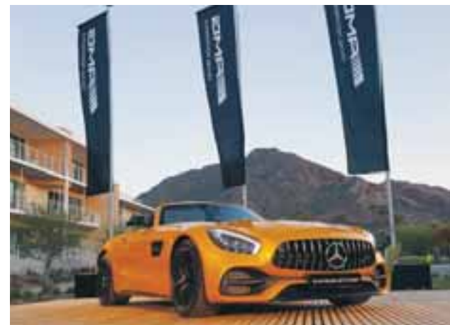
Lo mejor de muchos mundos: elegancia, deportividad y descapotable. ¿Qué más se puede pedir? | CLAUDIO ZUCKERMANN