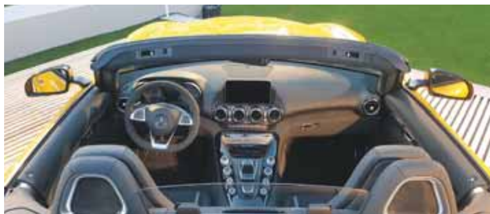
Al interior, mucho piano black y una gigante consola central excelentemente lograda: completamente deportiva, pero elegante, como buen Mercedes-Benz.

millones de pesos es el precio del AMG GT C Roadster