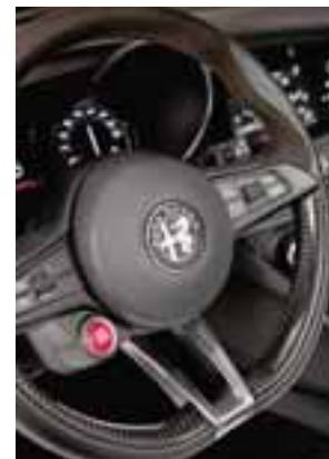
Presiona el botón para descubrirlo. | ALFA ROMEO

Giulia estará disponible en México en dos versiones: Giulia TI y Giulia Quadrifoglio, este último es el modelo que ostenta el récord de velocidad en el circuito de Nürburgring, Alemania, con un tiempo de 7 minutos y 32 segundos, similar al del Porsche 911 Turbo.