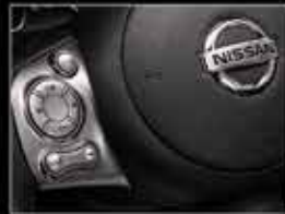
Controles de audio en el volante.