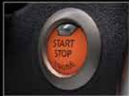
Botón de encendido y llave inteligente.

CON SEGURO GRATIS A CONTADO O CRÉDITO (1) Y ADEMÁS DESDE 10% DE ENGANCHE (2) O MENSUALIDADES DESDE $2,710 (3) CON CREDI NISSAN®