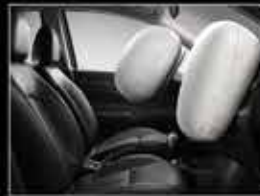
Frenos ABS y bolsas de aire.