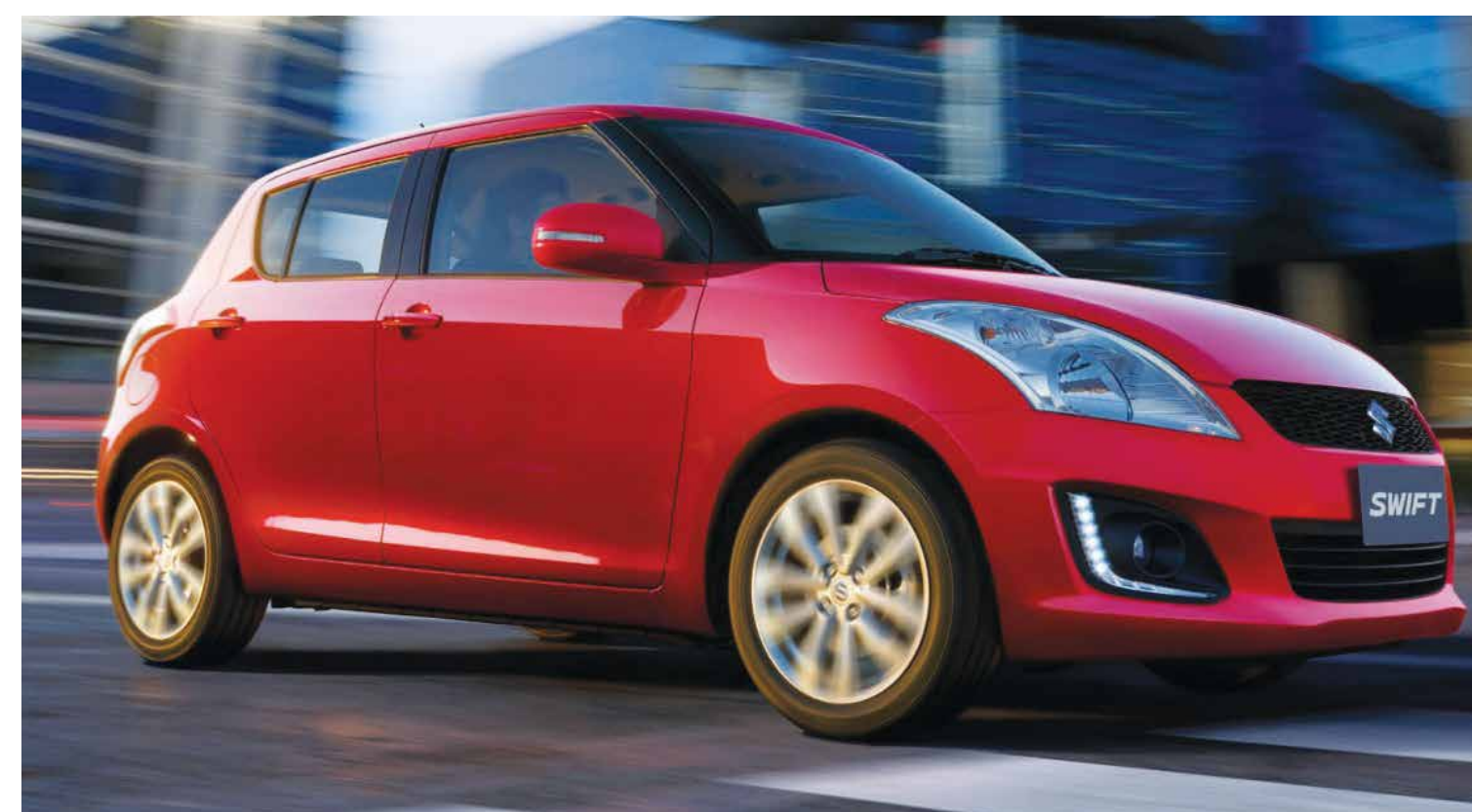
AL DÍA Las luces led de posición, los rines de nuevo diseño y los espejos con la luz de cruce son algunos de los detalles en el Swift 2014.