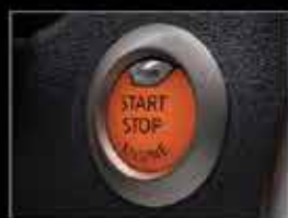
Botón de encendido y llave inteligente.

CON SEGURO GRATIS A CONTADO O CRÉDITO (1) Y ADEMÁS DESDE 10% DE ENGANCHE (2) O MENSUALIDADES DESDE $2,711 (3) CON CREDI NISSAN®