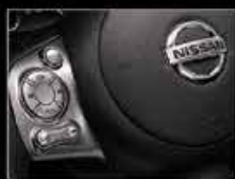
Controles de audio en el volante.