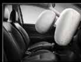
Frenos ABS y bolsas de aire.