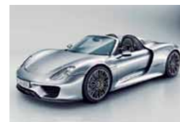
PORSCHE 918 SPYDER

Un real deportivo con tecnología eléctrica, se puede enchufar y delinea la estrategia de la marca con esta energía. Llega preciso para celebrar los 50 años del Carrera.