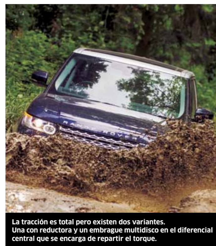
La tracción es total pero existen dos variantes. Una con reductora y un embrague multidisco en el diferencial central que se encarga de repartir el torque.