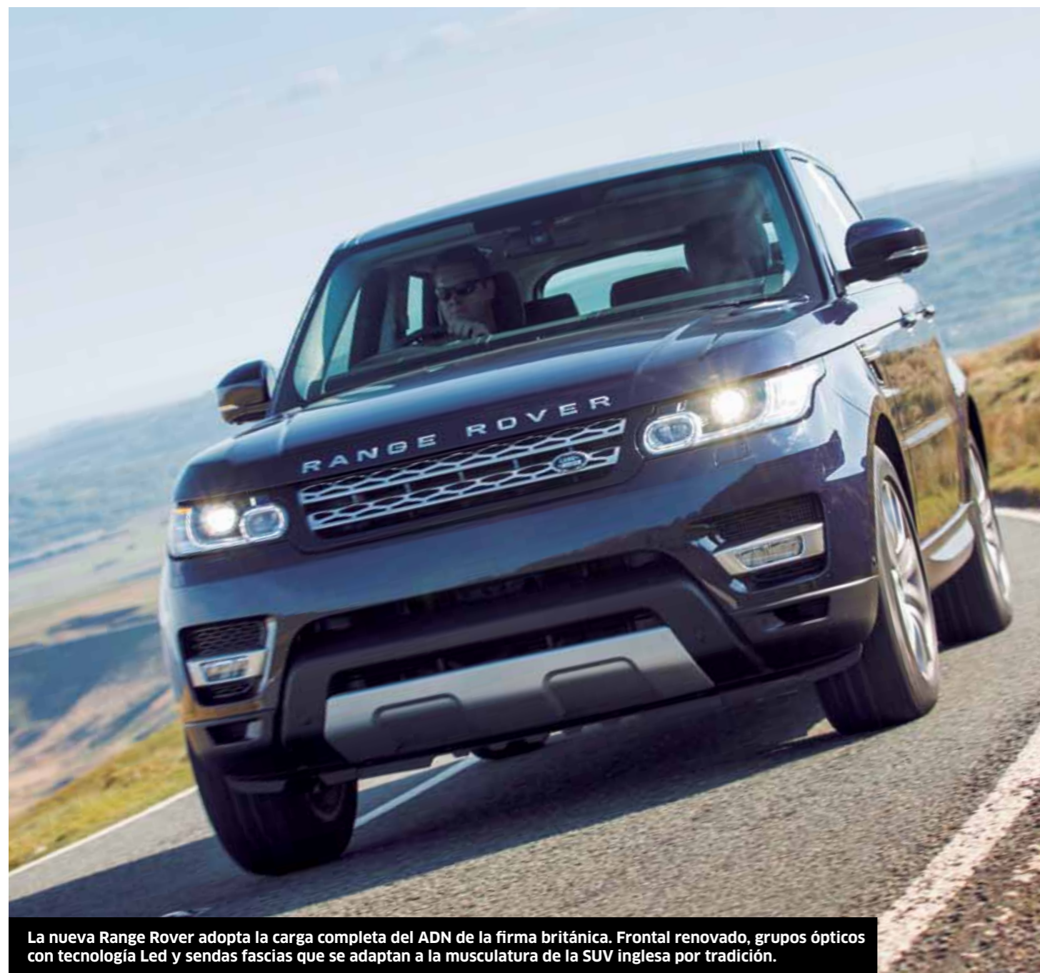
La nueva Range Rover adopta la carga completa del ADN de la firma británica. Frontal renovado, grupos ópticos con tecnología Led y sendas fascias que se adaptan a la musculatura de la SUV inglesa por tradición.