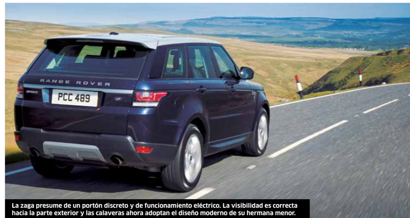
La zaga presume de un portón discreto y de funcionamiento eléctrico. La visibilidad es correcta hacia la parte exterior y las calaveras ahora adoptan el diseño moderno de su hermana menor.