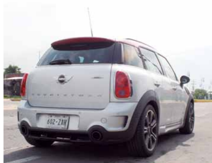
La versión deportiva del MINI Countryman destaca por llevar rines específicos y paquete deportivo.

El espacio interior es obviamente sobresaliente y todos los elementos del auto están orientados a la comodidad de los ocupantes desde el tablero, hasta los