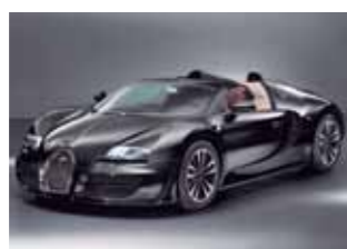
BUGATTI: JEAN BUGATTI

E n el marco del autoshow de Francfort, el grupo VW dejó clara su estrategia eléctrica, la gran potencia en la que se ha convertido a nivel mundial con crecimientos de 4.5% a nivel mundial este año donde no necesariamente la economía ha sido fuerte. Sin embargo con 6.2 millones de vehículos vendidos en todo el mundo conduce hacia la movilidad que quieren las nuevas generaciones, sus