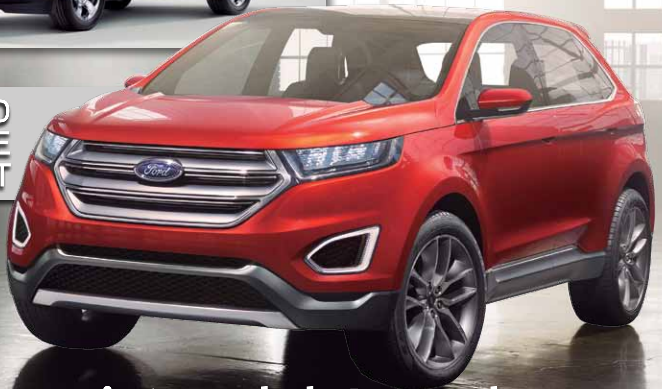
FORD EDGE CONCEPT