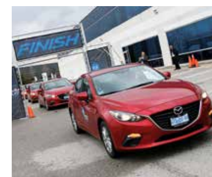
META Oficinas centrales de Mazda en Toronto, Canadá.